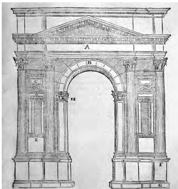
Fig. 1. S. Serlio, Tutte l'opere... , cit., Il terzo libro, c. 112, arco di Castelvecchio a Verona (coll. privata).