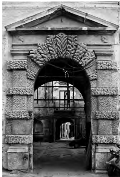
Fig. 7. Palermo. Palazzo Spatafora, portale.

Il secondo gruppo è costituito dai portali del palazzo Mezzoiuso in via Divisi e del palazzo Roccella in via Toledo [figg. 11-12], con semicolonne fasciate da un bugnato rustico uniforme e privi di timpano. Nel primo caso non mancano soluzioni curiose (pentaglifi sopra i capitelli) ma è nel palazzo Roccella, databile agli anni Settanta del secolo 29 , che si riscontra una accentuata propensione verso il "capriccio" e la "bizzarria". Qui il sistema dell'ordine fasciato viene esteso ai registri superiori e invade l'intera facciata. A Serlio si possono ricondurre non solo il motivo dei triglifi (o tetraglifi) a mensola pre-