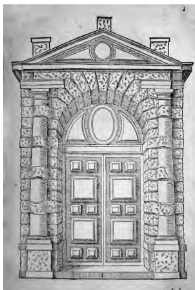
Fig. 5. S. Serlio, Tutte l'opere... , cit., Il sesto libro, c. 3, tav. I, portale del Grand Ferrare (coll. privata).

A questo punto possiamo immaginare che, insieme al portale del palazzo Aragona, anche i portali del complesso "aulico" del Castellammare e della residenza del senatore Giacomo Castrone (deputato per il cantiere di porta Nuova) costituirono modelli di riferimento per successive realizzazioni e rielaborazioni. A Palermo, il portale fasciato, ispirato al modello di Fontainebleau e alle differenti declinazioni proposte da Serlio nell' Extraordinario , si trova replicato, con alcune varianti, in una serie di casi che si concentrano cronologicamente negli anni Sessanta-Settanta e che si caratterizzano per l'uso di un