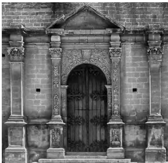
Fig. 2. Castelvetrano. Chiesa madre, portale.