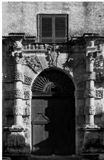
Fig. 13. Polizzi. Palazzo La Farina, portale.

Uno degli episodi più singolari e di problematica interpretazione è quello dell'ex chiesa di Santa Maria dell'Itria ad Agrigento (in via Duomo) [fig. 14]. In questo caso, le scarse notizie a disposizione farebbero propendere per una datazione precoce, forse intorno alla metà del secolo. Sappiamo infatti che la fabbrica venne probabilmente ricostruita su un precedente impianto quattrocentesco all'incirca nel 1548 32 . Il portale con raffinati capitelli compositi «misti di dorico e corinzio», che sembrano ripresi dall'antico ( Libro Quarto , 1537 c. LXII), e un'elegante ghiera con bugne a cuscino costituisce una larga interpretazione del modello fasciato che si combina con schemi ad arco di trionfo illustrati nel Terzo Libro (per il trattamento della trabeazione con fregio dilatato e risalti). L'aspetto più curioso e apparentemente inspiegabile è dovuto alle due "finte" finestre su mensole sopra il portale e alla loro ricercata disposizione