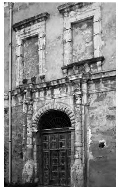
Fig. 14. Agrigento. Ex chiesa di Santa Maria dell'Itria, particolare della facciata.