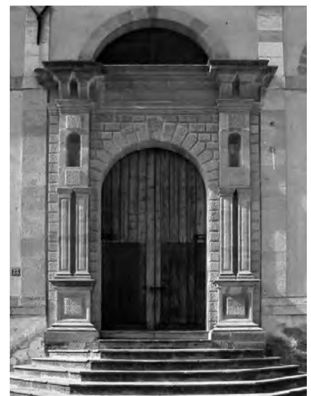
Fig. 18. Caltagirone. Chiesa di San Giacomo, portale laterale.