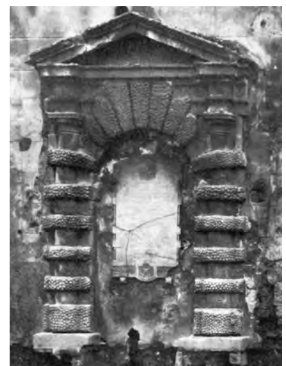
Fig. 4. Palermo. Castellammare, portale della chiesa (distrutta) (da R. La Duca, Il Castello a mare... , cit.).