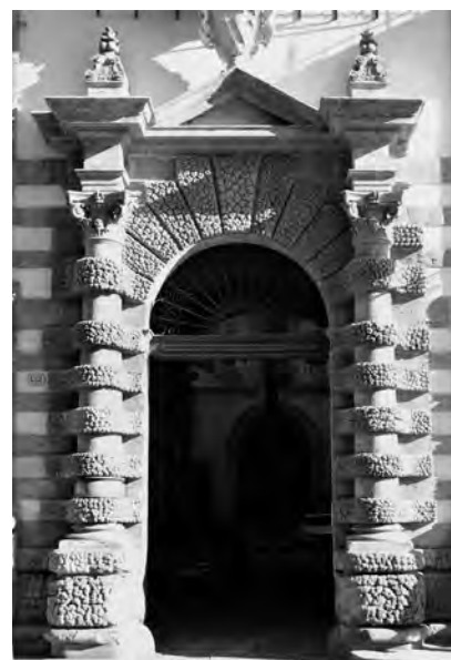
Fig. 6. Palermo. Palazzo Castrone, portale.