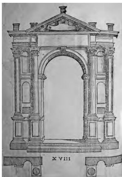
Fig. 19. S. Serlio, Tutte l'opere... , cit., Il sesto libro, p. 26v, tav. XVIII, portale "delicato" (coll. privata).

Un ulteriore caso di architettura civile è legato, infine, al prospetto della Corte Capitaniale a Caltagirone, un edificio realizzato nei primi anni del XVII secolo (1601), su un progetto attribuito allo scultore Antonuzzo Gagini e completato dal figlio Giandomenico (che abbiamo già visto attivo a Caltagirone), titolari di un'apprezzata impresa di famiglia che opera con continuità in questa cittadina, dove aveva lavorato anche Giandomenico senior 41 . La raffinata sequenza di portali e finestre che articola il prospetto, undici variazioni sullo stesso tema, somma ai modelli delicati dell' Extraordinario (tavole XVII, IV, VII, VIII, X) quelli del Settimo Libro (1575, c. 79, porta dorica). In particolare, la