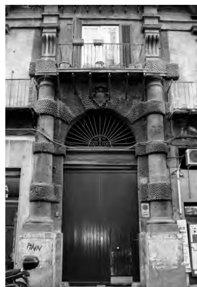
Fig. 12. Palermo. Palazzo Roccella, portale.