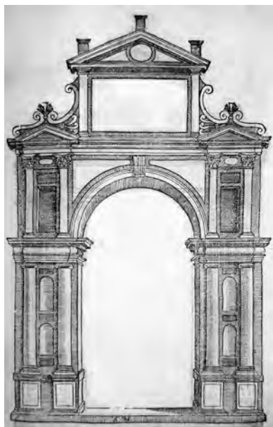
Fig. 15. S. Serlio, Tutte l'opere... , cit., Il sesto libro, c. 25, tav. XV, portale "delicato" (coll. privata).

Fin qui i portali rustici e l'elenco potrebbe agevolmente ampliarsi 34 . Come si è visto, infatti, la diffusione dei portali bugnati, riscontrabile soprattutto nell'area occidentale dell'isola, sia nelle grandi città che nei centri della provincia,