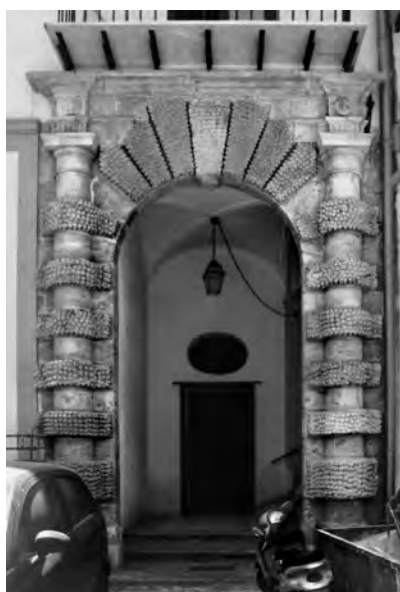
Fig. 11. Palermo. Palazzo Mezzoiuso, portale.