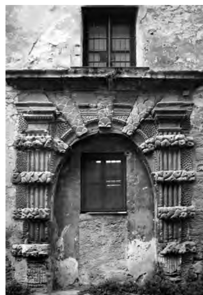
Fig. 10. Palermo. Portale in vicolo della Salvezza.