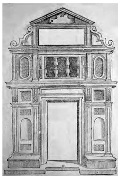
Fig. 21. S. Serlio, Tutte l'opere... , cit., Il sesto libro, p. 18v, tav. II, portale “delicato”.

Come si è visto i portali tratti dai libri dell'architetto bolognese furono sfruttati in Sicilia sino ai primi anni del Seicento, mentre gli esiti successivi testimoniano l'immissione di una nuova ondata di modelli. L'opera comunque non fu dimenticata, citazioni più o meno dirette continuarono a essere presenti in molteplici fabbriche e l'interesse per il trattato si protrasse almeno fino al XVIII secolo 42 . Nel 1726 Giovanni Amico inseriva l'architetto e teorico bolognese tra i fondatori del linguaggio classicista, accanto a Vitruvio, Palladio, Vignola e Scamozzi 43 . La presentazione offerta da un colto architetto del Settecento siciliano rende con pienezza più di ogni altro documento il debito profondo che la Sicilia ha avuto nei confronti di Sebastiano Serlio.