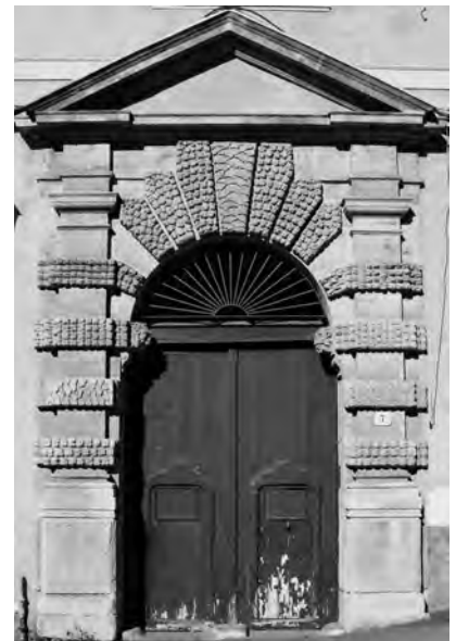
Fig. 8. Palermo. Palazzo Sant'Isidoro, portale.