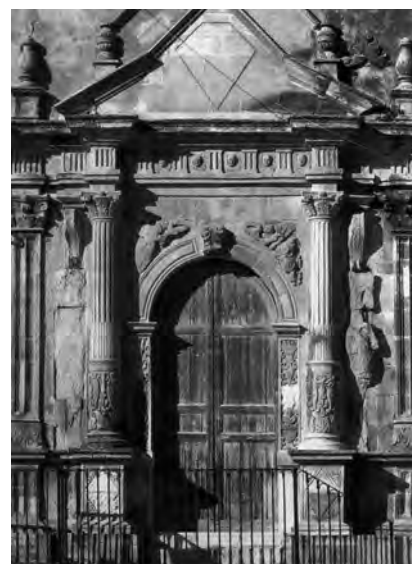
Fig. 20. Scicli. Chiesa di Santa Maria della Consolazione, portale laterale.