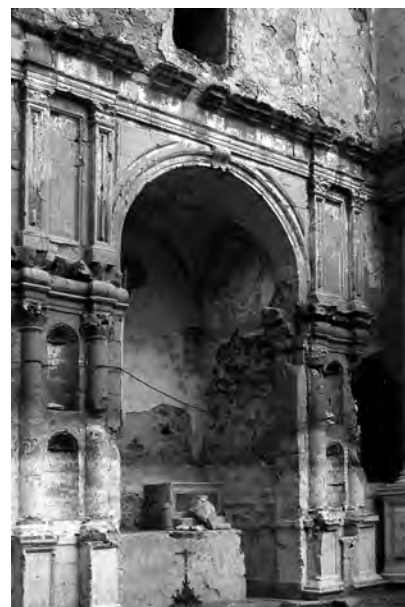
Fig. 16. Agrigento. Ex chiesa di Santa Maria dell'Itria, cappella.