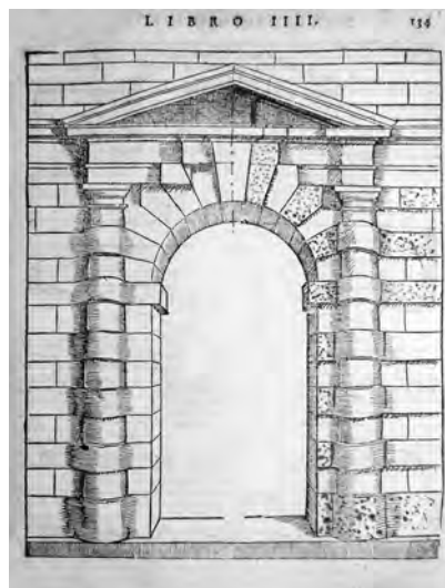
Fig. 3. S. Serlio, Tutte l'opere... , cit., Il quarto libro, c. 134, portale tuscanico rustico (coll. privata).

Il riferimento al palazzo degli Aragona e Tagliavia appare importante anche per riuscire a precisare le date di diffusione del tipico portale con colonne fasciate che costituisce il modello di maggior fortuna nel secondo Cinquecento, a partire forse dai portali esistenti nel Castellammare di Palermo. E infatti, il primo esempio di portale a bugne, chiaramente ripreso dal modello tuscanico rustico del Quarto Libro (1537, c. XIII), sembra essere stato quello della distrutta chiesa del Castellammare [figg. 3-4] di cui esisteva il "gemello" nel contiguo palazzetto viceregio con la loggia (anch'esso demolito nel 1922). È noto che negli anni Quaranta (1541-1546) viene avviato un cantiere di radicale ristrutturazione della residenza del Castellammare per volere di Ferrante Gonzaga, il cui progetto è stato attribuito a Domenico Giunti, architetto e pittore di corte. Appare pertanto possibile ipotizzare, per i due portali serliani, una realizzazione in concomitanza con gli interventi di trasformazione e di ammodernamento promossi dallo stesso viceré 20 . La cronologia più plausibile per i due portali del Castellammare finisce per anticipare alla metà degli anni Quaranta del secolo l'esplosione di questa moda.