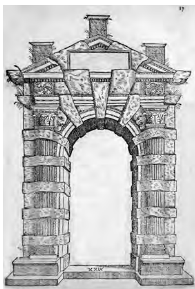
Fig. 9. S. Serlio, Tutte l'opere... , cit., Il sesto libro, c. 17, tav. XXIX, portale "rustico", (coll. privata).

Ai primi anni Settanta (1572 ca.) è riferibile pure il portale del palazzo dei ba-