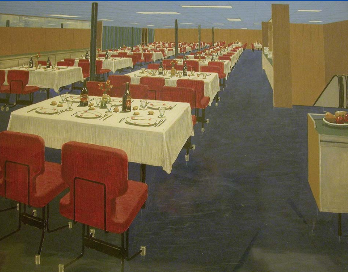
Centro Archivi di Architettura della Biblioteca Politecnica, Genova (Fondo Gardella) "Arredamento lotto 10 TAV. 4", 1950-1955, disegno a colori incorniciato, tempera su carta