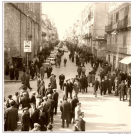
Alcamo. Foto Archivio Scafidi, 1965

Dialoghi Mediterranei, n. 36, marzo 2019