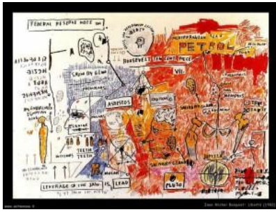
Jean- Michel Basquiat

1995: 194). Per esempio: individuare nella democrazia un “valore universale” presuppone che ci si intenda sul significato di “valore universale”. La questione non dovrebbe essere posta in modo astratto ma essere l’esito di un ragionamento di questo tipo: è possibile trovare delle obiezioni al fatto di considerare la democrazia un valore o, che è lo stesso, è possibile «stabilire se in ogni parte del mondo gli uomini possano avere ragioni» sufficienti per considerarla tale? (Sen 2004: 67). E questo al di là del fatto che l’esercizio concreto di questa forma di governo possa lasciare a volte perplessi proprio in nome della difesa di quei principi su cui essa si fonda. Il problema allora, per riprendere