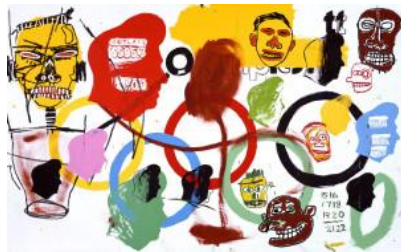
Jean- Michel Basquiat

che creano e tengono insieme le ‘comunità saldate insieme da idee’ con cui si viene a contatto nel nostro polimorfo mondo culturale. È proprio perché ci sono tante idee e principi attorno a cui crescono ‘comunità di credenti’ che si devono fare paragoni, fare scelte, farle ripetutamente, rivedere le scelte fatte in altre occasioni, cercare di conciliare esigenze contraddittorie e spesso incompatibili [...]. Si diventa consapevoli che ‘l’appartenenza’ e ‘l’identità’ non sono scolpite nella roccia, non sono assicurate da una garanzia a vita, che sono in larga misura negoziabili e revocabili; e che i fattori cruciali per entrambe sono le proprie decisioni, i passi che si intraprendono, il modo in cui si agisce e la determinazione a tener fede a tutto ciò» (Bauman 2003: 16).