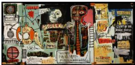
Jean Michel Basquiat