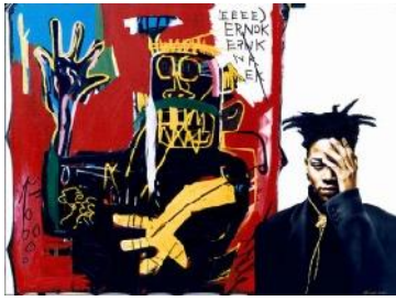
Jean- Michel Basquiat

un modo o nell'altro, a subire un processo di indigenizzazione: questo è vero della musica come degli stili abitativi, dei procedimenti scientifici come del terrorismo, degli spettacoli come delle norme costituzionali. In poche parole, le singole culture possono riprodursi o ricostruire le loro specificità sottoponendo le forme culturali transnazionali ad un processo di indigenizzazione» (cit. in Callari Galli 2004: 25). In questo senso, si è parlato di "istituzionalizzazione globale della vita mondiale" e di "localizzazione della globalità" come di processi contemporanei. Da un lato, dunque, a una deterritorializzazione dei prodotti culturali si accompagna