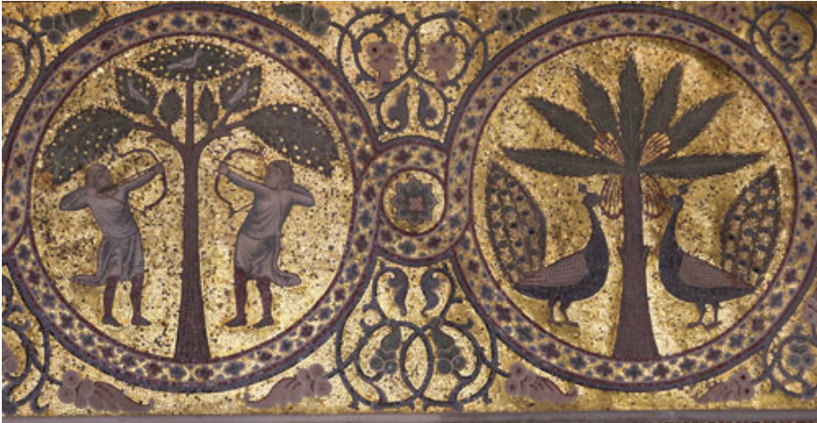
Figure 8. Mosaics in Castello della Zisa (Palermo).

A question arises: will changes in urban and natural landscape due to RPW attacks modify the perception, appreciation and total value of Sicilian arts in the future? [20-21]