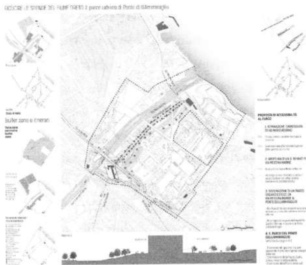
Fig. 3. Riprogettazione nel senso della valorizzazione della Buffer-Zone del Ponte dell'Ammiraglio, ricomprensente anche le altre emergenze normanne del Palazzo di Maredolce e della chiesa di S. Giovanni dei lebbrosi, in uno con l'intera area urbanizzata parecchio degradata, ricucita intorno al fiume dell'Oreto, per il cui risanamento è in corso un'intensa campagna di partecipazione (Varvarà, 2017).