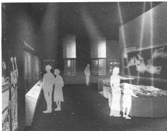
Fig. 4. Un render di progetto del riallestimento museografico del Museo Archeologico Regionale "Pietro Griffo" di Agrigento (progetto del prof. arch. Aldo R. D. Accardi; elaborazione grafica dell'Autore; © Aldo R.D. Accardi, 2021). Nell'immagine si coglie lo stretto legame che gli oggetti e le storie narrate hanno con il territorio circostante, dentro cui si s'inseriscono il museo ed il parco archeologico.

sviluppo. Anzi, al di fuori delle aree urbane strutturate, ovvero in territori fragili, l'istituzione della Buffer Zone può generare processi di inesorabile entropia. In relazione alle Linee Guida Unesco e a partire dalla valutazione di alcuni specifici Piani di gestione, oggi più che mai appare necessario orientare i Piani di Gestione dei siti Unesco verso un maggior rapporto tra le Core Zones e il loro contesto di riferimento, mettendo in luce il potenziale progettuale espresso dalle Buffer Zones. Un terreno comune per l'integrazione tra progettazione strategica (prodotti culturali e comunicazione) e gestione territoriale (servizi culturali e valorizzazione), dove la multidisciplinare ricerca condotta nell'ambito della "museografia" e del "restauro", quali specialistici ambiti della progettazione, possano declinare, nei modi più appropriati, i temi della fruizione ( enjoiment ) e valorizzazione sulle buffer-zone Unesco, al fine di mutarne la mera individuazione di dispositivo di protezione e pianificazione urbanistica, in una di zona franca di valorizzazione sostenibile e inclusiva, in cui una forte centralità è assegnata all'accessibilità fisica e culturale.