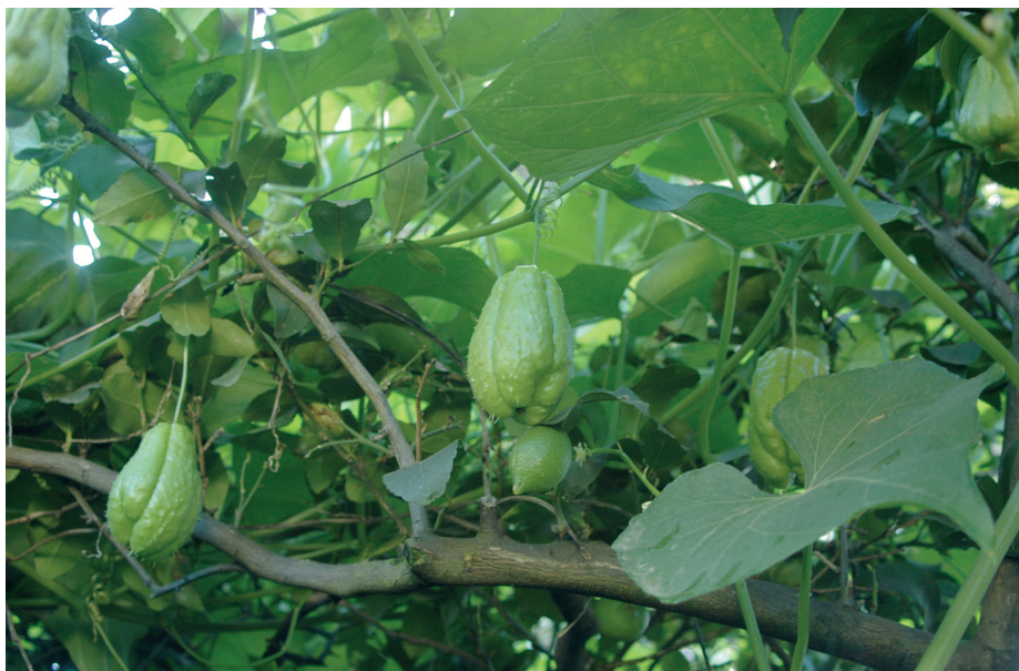
Fig. 5 — Gli alberi su cui la pianta di Sechium edule si sviluppa forniscono il supporto adeguato alla crescita dei frutti. — The trees on which the Sechium edule plant grows provide adequate support for fruit growth.