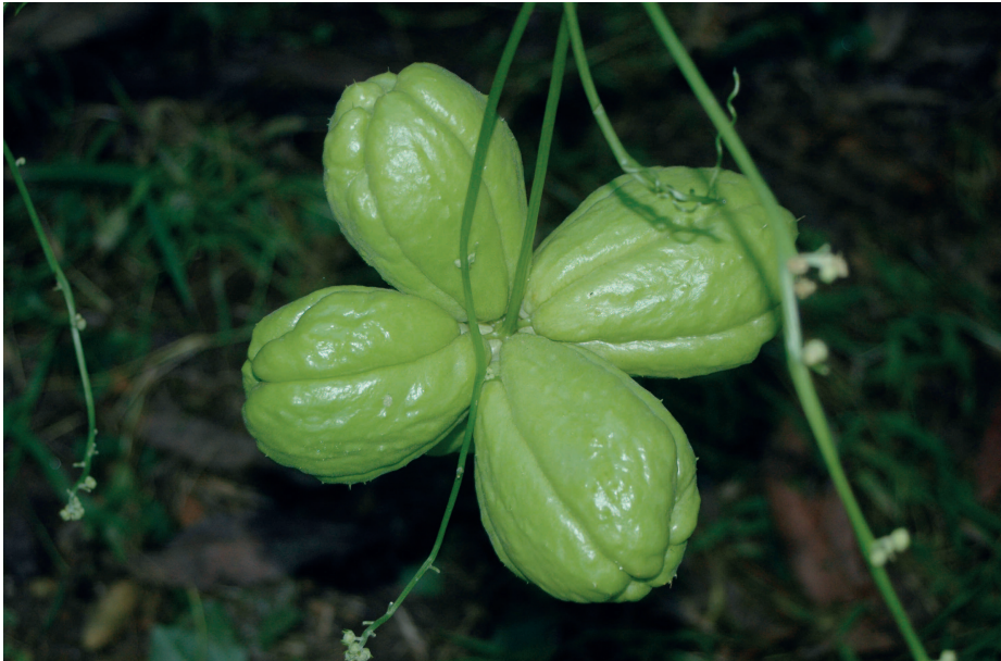
Fig. 2 — Molto spesso i frutti del Sechium edule non sono singoli. — Very often the fruits of Sechium edule are not single.

Attualmente la specie è coltivata soprattutto lungo la costa settentrionale dell’Isola, e coincide in buona misura con l’area di coltivazione degli agrumi; la pianta, infatti, ha necessità di essere irrigata e non tollera il vento che ne danneggia le foglie, sfrangiandole e causa la caduta dei frutti. Nelle piccole isole è nota la coltivazione solamente a Lipari. L’irrigazione è indispensabile perché la pianta priva di irrigazione va facilmente in stress e smette di crescere. Infatti negli agrumeti del Palermitano dove la specie viene coltivata tra i