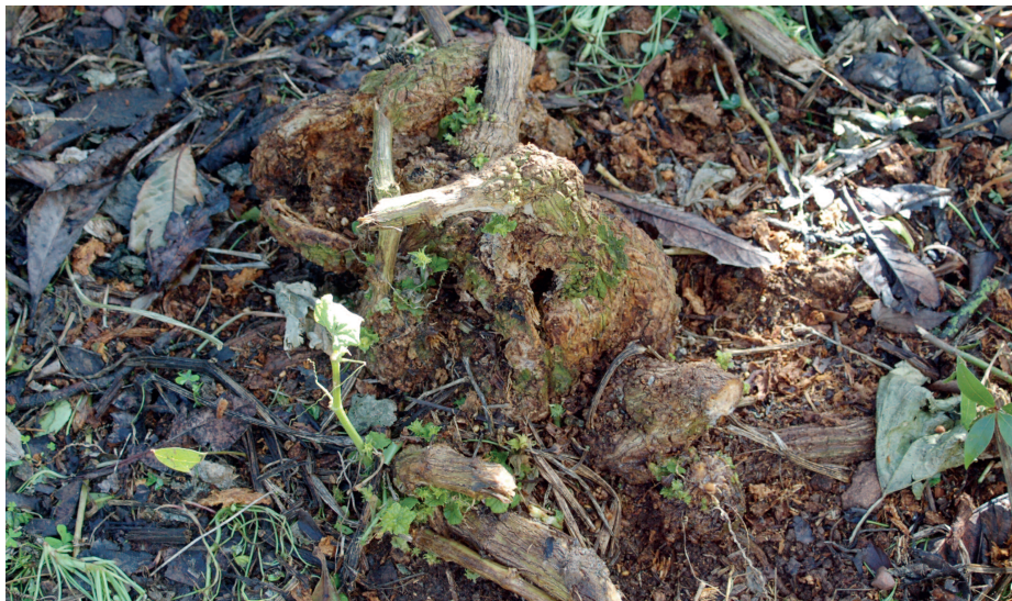
Fig. 7 — La pianta di Sechium edule si accresce e nel tempo assume l'aspetto di una vecchia "ceppaia". — The Sechium edule plant grows and over time takes on the appearance of an old "stump".