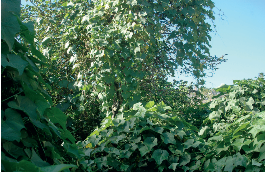
Fig. 4 — Caratteri di “liana” del Sechium edule si “apprezzano” considerando la capacità di ricoprire le piante vicine. — The “liana” characters of Sechium edule are appreciated considering the ability to cover neighboring plants.

Come rimarcato da molti autori la specie è una lianosa e cresce bene arrampicandosi su qualsiasi supporto artificiali (muri, reti metalliche, graticciate), ma anche sulle altre piante. È tradizione, infatti nel Palermitano farla arrampicare sugli alberi di agrumi e di nespolo del Giappone (Figg. 4 e 5) ma anche su supporti artificiali appositamente costruiti. La propagazione avvie-