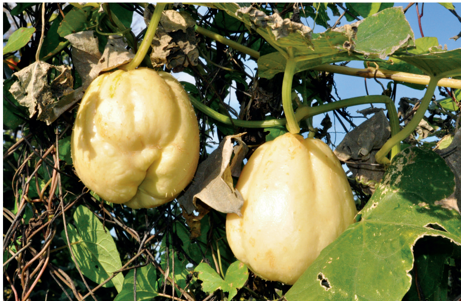
Fig. 3 — Questa “varietà” bianca di Sechium edule è diffusa alle Eolie e mostra una maggiore spinescenza. — This white “variety” of Sechium edule is widespread in the Aeolian islands and shows a greater one spinescence.

limoni, nel periodo di forzatura quando cioè i limoni non vengono irrigati per stimolare la produzione di una fioritura straordinaria (cfr. LA MANTIA, 2006) l’acqua viene immessa nei giardini per irrigare solamente le zucche. L’irrigazione è necessaria anche per garantire una elevata produzione dei frutti anche se a partire dall’autunno le piogge sono sufficienti. I frutti si raccolgono da metà ottobre a tutto dicembre. In questi ultimi anni come scrivono BRANCA & LA MALFA (2018) “The use of this vegetable is increasing”; questo è vero ed è dovuto anche alla sempre maggiore presenza di persone provenienti da altri Paesi sia sudamericani che asiatici dove la specie è maggiormente utilizzata. Inoltre la presenza di genti provenienti soprattutto dai Paesi asiatici (Bangladesh, etc.) ha stimolato il consumo degli apici delle piante utilizzate come verdura. In Sicilia, infatti, queste parti della pianta non vengono utilizzate mentre oggi è frequente rinvenire i getti apicali nei negozi etnici sempre più diffusi anche nei celebri mercati storici palermitani. Gli agricoltori palermitani, invece, lasciano crescere la pianta indisturbata perché più la pianta si accresce, maggiore è la quantità di frutti che essa produce. Uno dei fattori avversi alla specie, il più temuto, è infatti il ratto nero Rattus rattus o il surmolotto o ratto delle chiaviche Rattus norvegicus che rosicchiano le cime; essi di fatto sono l’unica avversità per la quale si mette in atto una difesa della