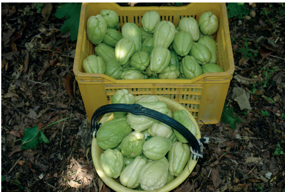
Fig. 8 — Il rinnovato interesse verso il Sechium edule, dovuto anche alla diffusione di persone provenienti dai Paesi tropicali, crea nuove opportunità per il commercio dei frutti. — The renewed interest in the Sechium edule, also due to the spread of people coming from tropical countries, creates new opportunities for fruit trade.