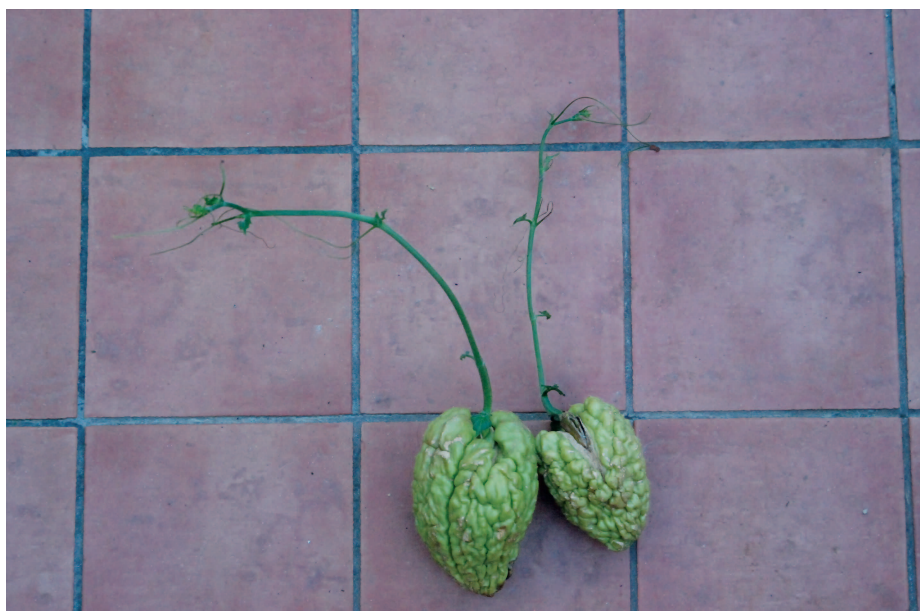
Fig. 6 — Frutti maturi di Sechium edule che hanno emesso i getti che andranno a costituire la nuova pianta. — Ripe fruits of Sechium edule that have released the jets that will form the new one plant.