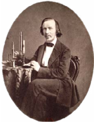
Fig. 4 Haeckel e il suo microscopio, 1858 (Haeckel W. 1914: s.p.).

considerazione scientifica e considerazione estetica della natura, anzi il proporsi di quest'ultima come compensazione per quanto andava inevitabilmente perduto nella prima" (D'Angelo 2001: 36). Haeckel mette però in dubbio la legittimità stessa di tale separazione: egli si propone di cogliere la natura in maniera naturale e visibile , senza imprigionarla in formule matematiche, convinto che la matematica sia importante, ma non indispensabile per lo studio del vivente, il quale può essere autenticamente compreso solo osservandolo nel suo ambiente e studiandone lo sviluppo formale. Un processo in cui non si deve tollerare bensì necessariamente ammettere l'ingresso del soggetto nella scienza, perché lo sguardo del naturalista che indaga la natura non è mai impersonale, né le operazioni di osservazione, rappresentazione e concettualizzazione possono essere in alcun modo scisse nel fare scientifico.