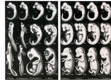
Fig. 5 Illustrazione della Biogenetische Grundgesetz che riproduce gli embrioni di otto specie di vertebrati (in ordine: pesce, salamandra, tartaruga, pollo, maiale, bue, cane e uomo) in tre stadi dello sviluppo ontogenetico, mostrando una notevole somiglianza negli stadi precoci di sviluppo e una graduale differenziazione in quelli successivi (Haeckel 1895).

Haeckel propone perciò di concedere maggiore fiducia nel nostro accesso sensoriale alla realtà e negli strumenti che ci consentono di potenziare le nostre capacità estetiche, rendendo perspicui anche gli aspetti più nascosti della natura, carpendone i segreti e interpretandone le forme. "Pensate solo", affermava lo zoologo, "allo smisurato rivolgimento di tutti i nostri concetti teorici che noi dobbiamo all'uso generale del microscopio" (Haeckel 1892: 14) che "ci ha fatto conoscere molte migliaia di specie di minimi esseri che erano nascosti al nudo occhio e che tuttavia per la molteplicità delle loro graziose forme [...] suscitano in noi altissimo interesse" (ivi: 235). Haeckel era indubbiamente un virtuoso nell'uso di tale strumento