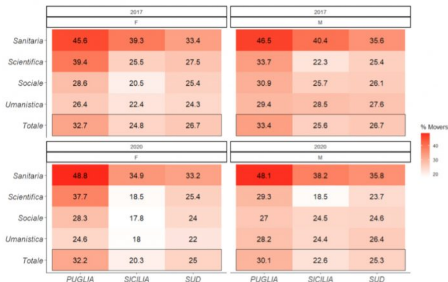
Figura 3: Percentuale di movers tra gli immatricolati all'università residenti in Puglia, Sicilia e al Sud per genere e area disciplinare, coorti 2017 e 2020.

Guardando alle singole aree disciplinari, non sorprende, per via della programmazione nazionale, che i corsi dell'area Sanitaria siano fra i pochi ad aver mantenuto un alto livello di mobilità (35,8% per i maschi, 33,2% per le femmine). Per tutte le altre aree si osserva una diminuzione di 2,4 punti percentuali al Sud. In Puglia il maggiore calo si registra nell'area Scientifica per i maschi (-4,4 punti percentuali) e nell'area Umanistica per le femmine (-1,9 punti percentuali). In Sicilia, si registra, invece, una forte riduzione nell'area Scientifica per le femmine (-7 punti percentuali) e nell'area Umanistica per i maschi (-4,2 punti percentuali).