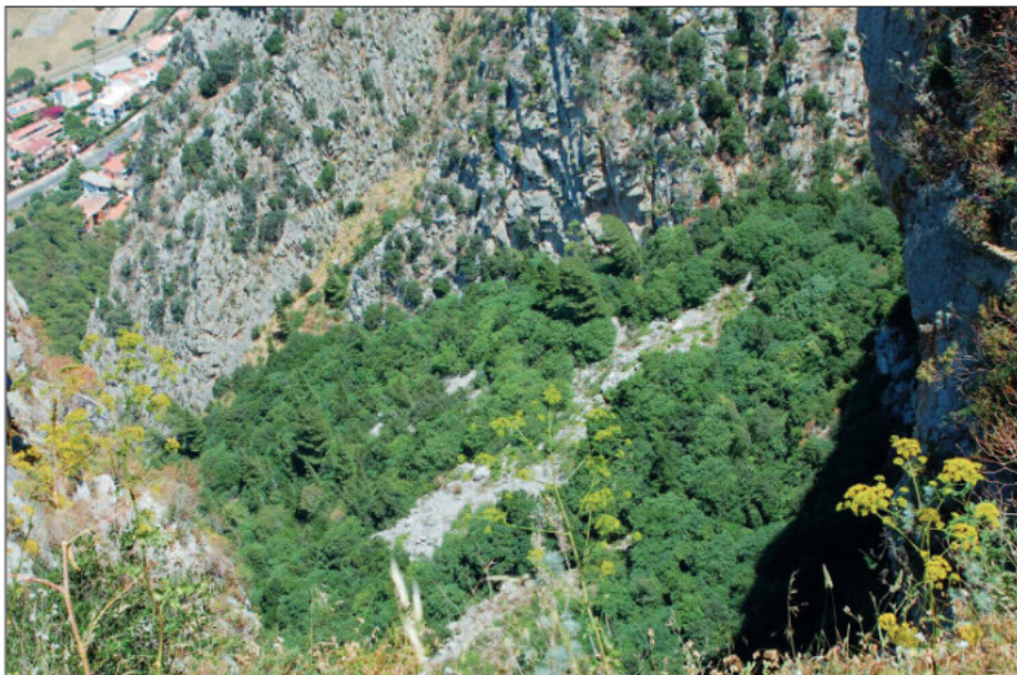
Fig. 5 — Foto scattata alcuni anni fa che mostra straordinari nuclei di vegetazione probabilmente unici superstiti della costa settentrionale della Sicilia. — The photo taken a few years ago shows extraordinary vegetation spots, probably the only survivors of the northern coast of Sicily.

inutile e quelle piante furono distrutte, solo dalla parte occidentale, negli appicchi della Real Favorita, in punti inaccessibili anche alle capre, vegeta qualche raro cespuglio di elce”. Lo stesso autore scrive: “Per concludere: il Monte Pellegrino nei tempi storici, dagli arabi e noi, è stato sempre adibito per libero pascolo pubblico e privato di bestiame, è pertanto non vi potè mai vegetare bosco di sorta alcuna”. In definitiva siamo di fronte ad un esempio di distruzione molto antica e continuata della vegetazione forestale, ma ciò nonostante la vegetazione di Monte Pellegrino è importante con riferimento soprattutto alla vegetazione rupicola (GIANGUZZI et al. , 1996) ed anche per i lembi di vegetazione forestale che rimangono dove si hanno anche manifestazioni biologiche peculiari come la rifioritura del leccio dovuto al particolare microclima (LA MANTIA et al. , 2003) (Fig. 5). Questi lembi sono rimasti relativamente indisturbati, sebbene in qualche caso interessati da incendi (cfr. LIVRERI CONSOLE, 2002) questi ultimi però hanno interessato recentemente (giugno 2016) i rimboschimenti con effetti importanti. A differenza di quello che è accaduto in altre aree dei monti di Palermo, dove gli incendi hanno innescato delle dinamiche “positive” (MAGGIORE et al. , 2005), gli effetti su Monte Pellegrino sono decisamente negativi per la stabilità di queste fitocenosi.