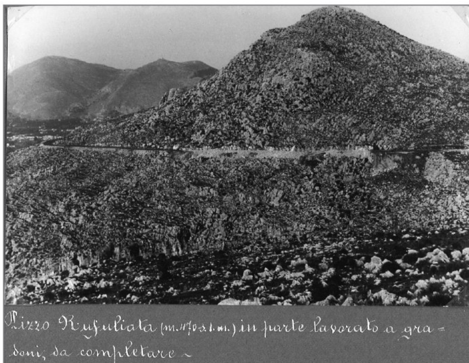
Fig. 3 — Immagine del 1952 presa dal “Progetto esecutivo dei lavori di sistemazione idraulico-forestale del Monte Pellegrino ...”, in cui sono evidenziati i gradoni realizzati per mettere a dimora le piante. — Picture taken in 1952 from the “Executive project of the hydraulic-forestry works on Monte Pellegrino...” highlighting the terraces built to plant out the seedlings.

analizzare i risultati per ciascuna specie. In un altro paragrafo, “Cura degli alberi”, lo stesso autore scrive: “A che varrebbe piantare se poi dovesse averci una grande incuria nella conservazione e nella manutenzione?”; e prosegue elencando i mali della mancata manutenzione dei boschi sino ad allora realizzati, mali comuni a quasi tutte le aree rimboschite e che tanti problemi hanno causato in futuro tra cui in primis i mancati diradamenti. SCROFANI (1946) affronta la questione del pascolo, con parole che riporto di seguito, perché è una analisi di un problema odierno in tutte le aree “marginali della Sicilia”: “Nelle condizioni in cui si trova, il pascolo è povero di specie pabulari, predominandovi delle erbacee di scarso o niente affatto valore nutritivo. Questo stato di fatto è stato anche determinato dal continuo ed eccessivo sovraccarico degli animali pascolanti, i quali, gradatamente, hanno determinato il peggioramento sempre più accentuato della cotica erbosa. Anche in un programma ridotto in cui si ammetta la continuazione del pascolo per ragioni economiche, per un migliore sviluppo qualitativo e quantitativo di esso si