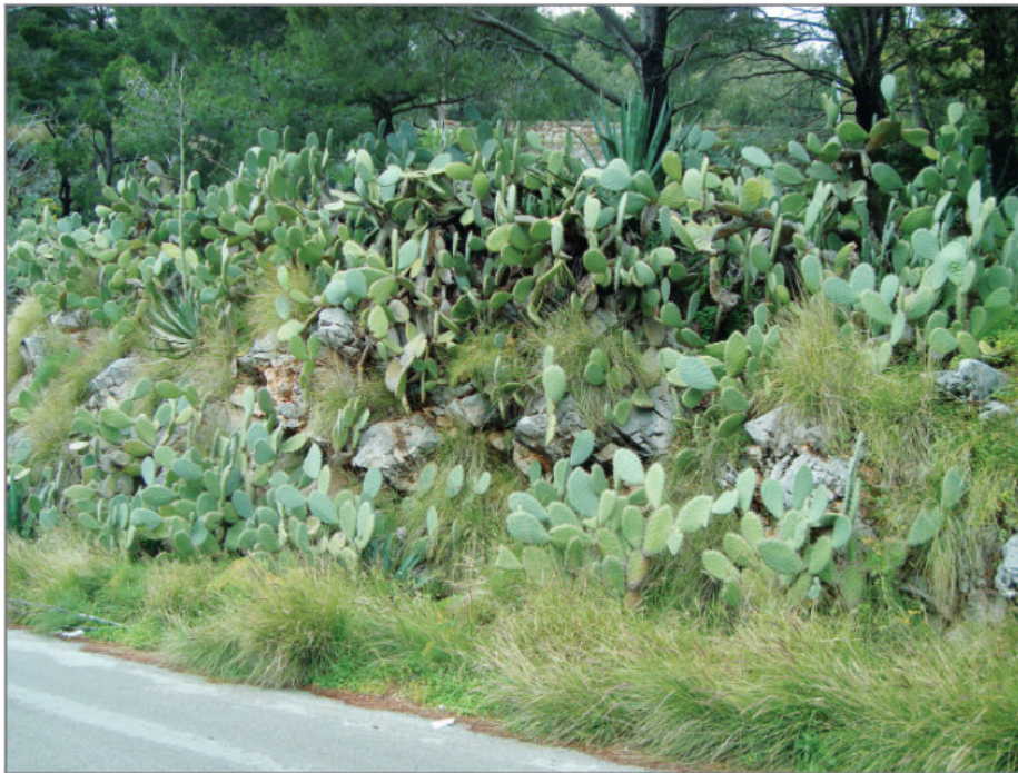
Fig. 6 — Emblematica immagine di una porzione di Monte Pellegrino dove le specie aliene non lasciano spazio alle specie autoctone. — Emblematic image of a section of Mt. Pellegrino where alien plants leave no space for native species.

Indicazioni gestionali per i boschi esistenti saranno contenute nel redigendo piano di Gestione ad opera del Dipartimento SAAF, ma bisognerebbe pensare ad una “destinazione d’uso” di tutte le aree del Monte da stabilire prima e per vaste superfici, in modo da salvaguardarne la funzionalità ecosistemica, e consentire le possibilità di intervento. Tuttavia qui si vuole sottolineare un pericolo per la conservazione e il recupero della vegetazione che è dato dalla invasività delle piante aliene che rappresentano un vulnus a qualunque ipotesi di intervento, soprattutto l’ailanto Ailanthus altissima e il Pennisetum setaceum ma anche molte altre specie (Fig. 6) (cfr. PASTA et al. , 2010; BADALAMENTI et al. , 2012). Certamente non si può dire che non eravamo stati avvertiti. SILDARELLI (1951) scrive: “Nei pressi della clinica Orestano, fra i fichi d’india e le agave, occhieggia una promettente coltre di alianti, decisa a diventare invadente”. Più recentemente GIANGUZZI et al. (1996), ma anche il “Piano di Sistemazione” della zona A della Riserva, hanno ribadito i rischi derivanti dalla diffusione delle aliene invasive (LIVRERI CONSOLE, 2002).