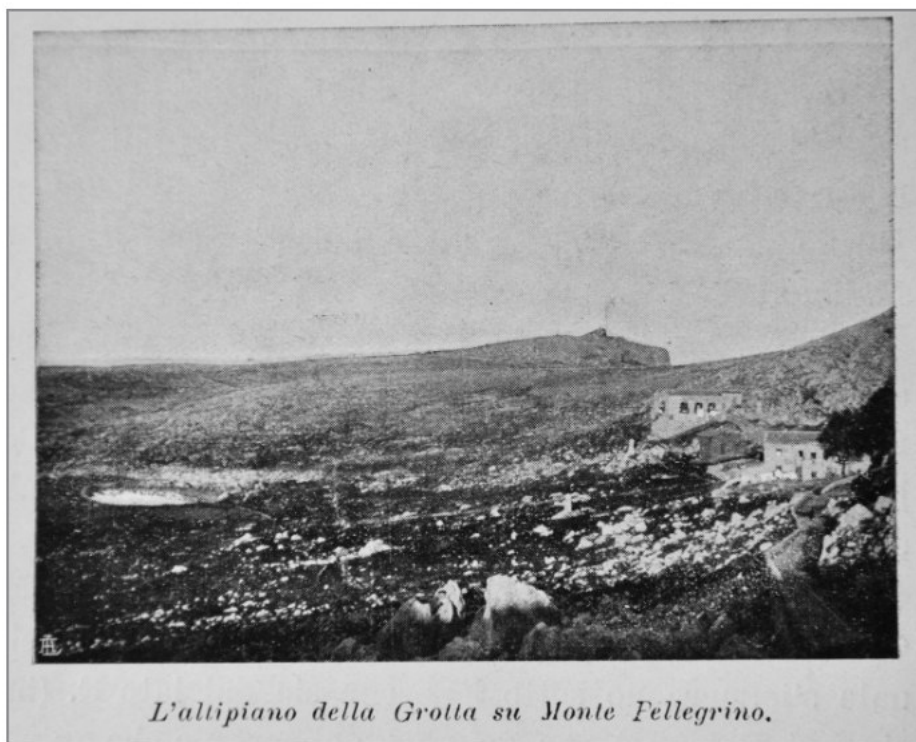
Fig. 2 — Foto tratta da GEMMELLARO (1910), che mostra un dettaglio del Monte con il “Gorgo” totalmente privo di vegetazione. — Photo taken from 1 (1910) showing a detail of the Mt. Pellegrino with the “Gorgo” totally devoid of vegetation.

veva verso la fine del Seicento. Una concisa attestazione della scarsa feracità del Pellegrino tramanda V. Amico, Dizionario topografico della Sicilia, Palermo 1855, I, p. 404: «Sebbene le radici di quel monte feraci siano in biade, tuttavia le sue vette, sassose essendo, abbondar possano solamente in fertili pasture, ma in gran parte mostrarsi squallide per la loro sterilità».