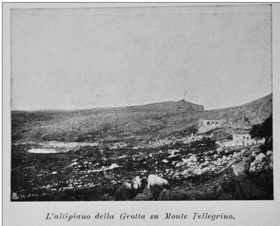
Fig. 2 — Foto tratta da GEMMELLARO (1910), che mostra un dettaglio del Monte con il “Gorgo” totalmente privo di vegetazione. — Photo taken from 1 (1910) showing a detail of the Mt. Pellegrino with the “Gorgo” totally devoid of vegetation.

veva verso la fine del Seicento. Una concisa attestazione della scarsa feracità del Pellegrino tramanda V. Amico, Dizionario topografico della Sicilia, Palermo 1855, I, p. 404: «Sebbene le radici di quel monte feraci siano in biade, tuttavia le sue vette, sassose essendo, abbondar possano solamente in fertili pasture, ma in gran parte mostrarsi squallide per la loro sterilità».