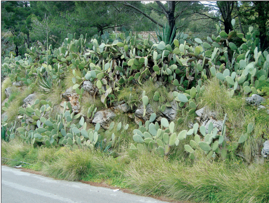
Fig. 6 — Emblematica immagine di una porzione di Monte Pellegrino dove le specie aliene non lasciano spazio alle specie autoctone. — Emblematic image of a section of Mt. Pellegrino where alien plants leave no space for native species.

Indicazioni gestionali per i boschi esistenti saranno contenute nel redigendo piano di Gestione ad opera del Dipartimento SAAF, ma bisognerebbe pensare ad una “destinazione d’uso” di tutte le aree del Monte da stabilire prima e per vaste superfici, in modo da salvaguardarne la funzionalità ecosistemica, e consentire le possibilità di intervento. Tuttavia qui si vuole sottolineare un pericolo per la conservazione e il recupero della vegetazione che è dato dalla invasività delle piante aliene che rappresentano un vulnus a qualunque ipotesi di intervento, soprattutto l’ailanto Ailanthus altissima e il Pennisetum setaceum ma anche molte altre specie (Fig. 6) (cfr. PASTA et al. , 2010; BADALAMENTI et al. , 2012). Certamente non si può dire che non eravamo stati avvertiti. SILDARELLI (1951) scrive: “Nei pressi della clinica Orestano, fra i fichi d’india e le agave, occhieggia una promettente coltre di ailanti, decisa a diventare invadente”. Più recentemente GIANGUZZI et al. (1996), ma anche il “Piano di Sistemazione” della zona A della Riserva, hanno ribadito i rischi derivanti dalla diffusione delle aliene invasive (LIVRERI CONSOLE, 2002).