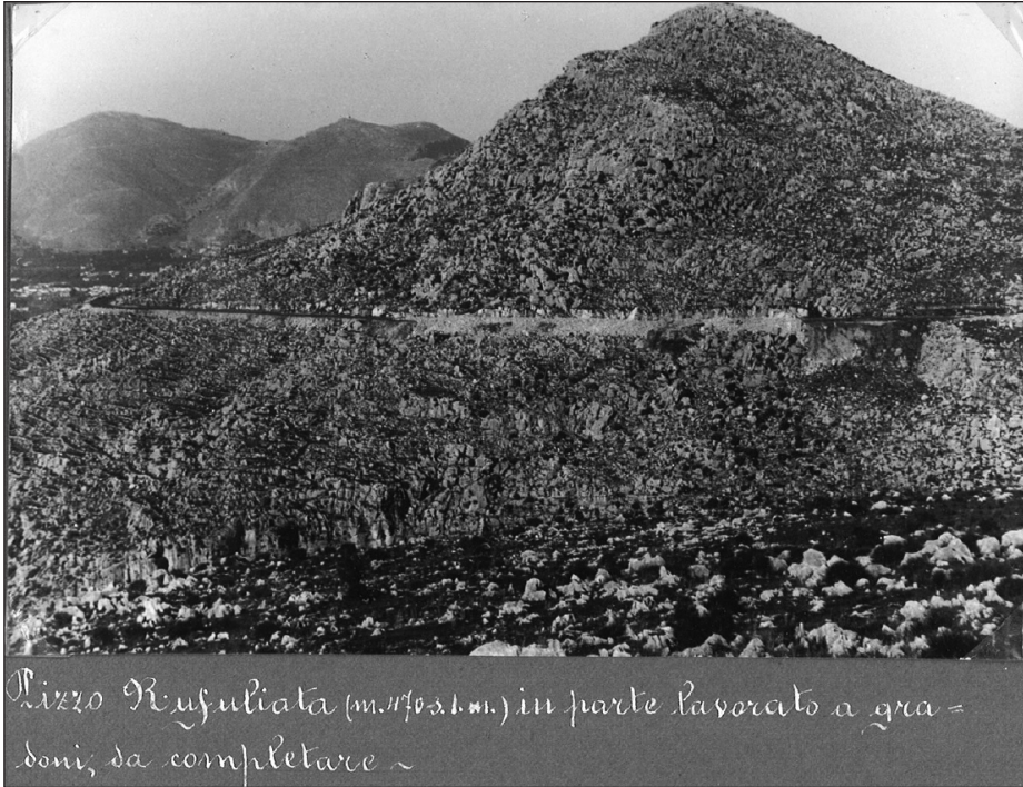
Fig. 3 — Immagine del 1952 presa dal “Progetto esecutivo dei lavori di sistemazione idraulico-forestale del Monte Pellegrino ...”, in cui sono evidenziati i gradoni realizzati per mettere a dimora le piante. — Picture taken in 1952 from the “Executive project of the hydraulic-forestry works on Monte Pellegrino...” highlighting the terraces built to plant out the seedlings.

analizzare i risultati per ciascuna specie. In un altro paragrafo, “Cura degli alberi”, lo stesso autore scrive: “A che varrebbe piantare se poi dovesse aver- si una grande incuria nella conservazione e nella manutenzione?”; e prosegue elencando i mali della mancata manutenzione dei boschi sino ad allora realizzati, mali comuni a quasi tutte le aree rimboschite e che tanti problemi hanno causato in futuro tra cui in primis i mancati diradamenti. SCROFANI (1946) affronta la questione del pascolo, con parole che riporto di seguito, perché è una analisi di un problema odierno in tutte le aree “marginali della Sicilia”: “Nelle condizioni in cui si trova, il pascolo è povero di specie pabulari, predominandovi delle erbacee di scarso o niente affatto valore nutritivo. Questo stato di fatto è stato anche determinato dal continuo ed eccessivo sovraccarico degli animali pascolanti, i quali, gradatamente, hanno determinato il peggioramento sempre più accentuato della cotica erbosa. Anche in un programma ridotto in cui si ammetta la continuazione del pascolo per ragioni economiche, per un migliore sviluppo qualitativo e quantitativo di esso si