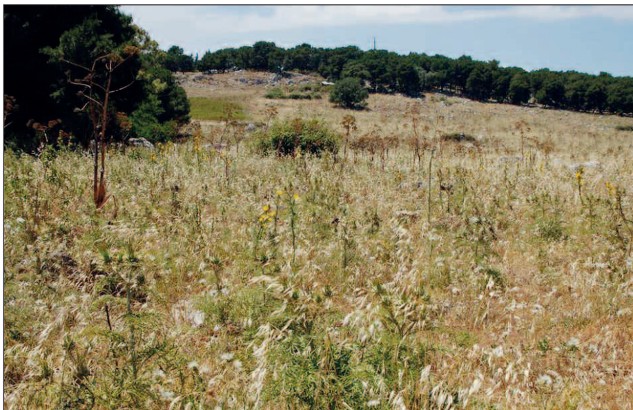
Fig. 7 — Anche la porzione di Monte Pellegrino priva di vegetazione arborea svolge un ruolo importante nella conservazione della biodiversità. — The portion of Mt. Pellegrino devoid of tree vegetation also plays an important role in the conservation of biodiversity.

E purtroppo rimangono vere le parole di SILDARELLI (1951): “Ben altro però resta da fare per dire che il rimboschimento del Monte Pellegrino sia un fatto compiuto, ma tutto lascia bene a sperare: stanziamenti adeguati e continui, direzione tecnica idonea e capace, sorveglianza adeguata e sempre più efficiente”.