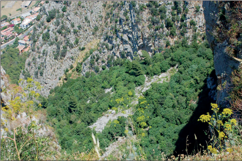
Fig. 5 — Foto scattata alcuni anni fa che mostra straordinari nuclei di vegetazione probabilmente unici superstiti della costa settentrionale della Sicilia. — The photo taken a few years ago shows extraordinary vegetation spots, probably the only survivors of the northern coast of Sicily.

inutile e quelle piante furono distrutte, solo dalla parte occidentale, negli appicchi della Real Favorita, in punti inaccessibili anche alle capre, vegeta qualche raro cespuglio di elce”. Lo stesso autore scrive: “Per concludere: il Monte Pellegrino nei tempi storici, dagli arabi e noi, è stato sempre adibito per libero pascolo pubblico e privato di bestiame, è pertanto non vi potè mai vegetare bosco di sorta alcuna”. In definitiva siamo di fronte ad un esempio di distruzione molto antica e continuata della vegetazione forestale, ma ciò nonostante la vegetazione di Monte Pellegrino è importante con riferimento soprattutto alla vegetazione rupicola (GIANGUZZI et al. , 1996) ed anche per i lembi di vegetazione forestale che rimangono dove si hanno anche manifestazioni biologiche peculiari come la rifiorenza del leccio dovuto al particolare microclima (LA MANTIA et al. , 2003) (Fig. 5). Questi lembi sono rimasti relativamente indisturbati, sebbene in qualche caso interessati da incendi (cfr. LIVRERI CONSOLE, 2002) questi ultimi però hanno interessato recentemente (giugno 2016) i rimboschimenti con effetti importanti. A differenza di quello che è accaduto in altre aree dei monti di Palermo, dove gli incendi hanno innescato delle dinamiche “positive” (MAGGIORE et al. , 2005), gli effetti su Monte Pellegrino sono decisamente negativi per la stabilità di queste fitocenosi.