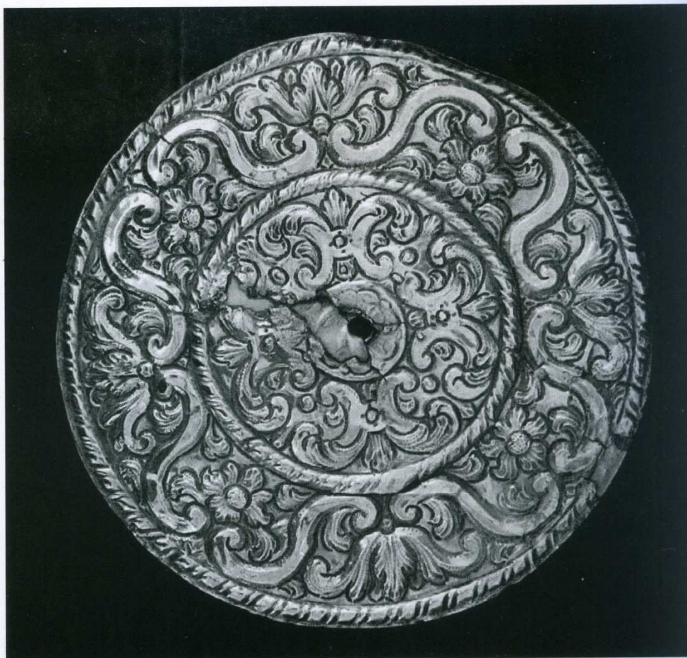
LAMINA 4. Argenteo Palermitano. Aureola (1739-1740). Chiesa di Maria SS. del Carmine, Bisacchino.