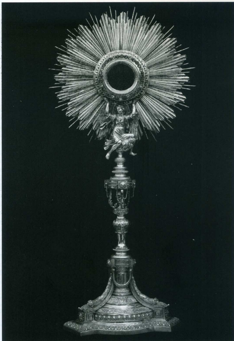
LAMINA 3. Argentiere Palermitano. Ostensorio (1818). Chiesa Madre, Bisacquino.