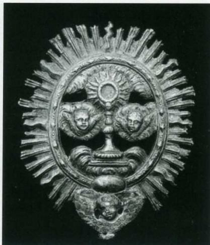
LAMINA 2. Argenteo Palermitano. Insegna (1737-1738). Chiesa Madre, Bisacchino.