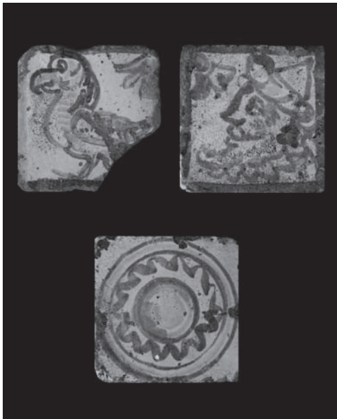
Fig. 1 - Maestranza di Burgio, Gruppo di mattonelle , fine del XVI secolo, maiolica policroma, Prizzi, Chiesa Madre.

Alla fine del XVI secolo ancora le maestranze saccensi fornivano mattoni maiolicati per l'eremo dei Minori Osservanti di Santa Maria delle Vigne di Corleone nella contrada omonima 10 , da quanto testimoniano due inediti frammenti dell'antica pavimentazione. Il primo a cellula compositiva, similmente al pannello di collezione privata reso noto da Maria Reginella 11 , è decorato in blu e bianco con treccia centrale che delimita due stilizzati motivi floreali. Il secondo invece presenta motivi floreali, alcuni dei quali inglobati in un motivo a treccia, decorati in bianco e blu con qualche pennellata di giallo.