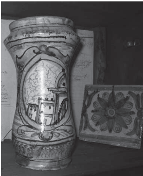
Fig. 2 - Maestranza di Burgio, Albarello , fine XVII-inizi XVIII secolo, maiolica policroma, Palermo, collezione Bona di Giardinello; Maestranza palermitana, Mattonella , XVIII secolo, maiolica policroma, Palermo, collezione Bona di Giardinello.

custodiscono ancora, invece, qualche mattonella proveniente da altri ambienti della nobile dimora, tra cui un inedito elemento di bordura. Il pregevole manufatto, ascrivibile alla vasta produzione settecentesca dei maiolicari palermitani, presenta uno stilizzato frutto, forse una melagrana, camuffato da un fiore stellato nei toni del verde e del giallo (fig. 2). Tra gli inediti arredi mobili in maiolica provenienti dalla casa bisacquinese si ricorda ancora un albarello con una scena paesaggistica entro medaglione ovale di produzione di Burgio della fine del XVII - inizi del XVIII secolo (fig. 2), un vaso con raffigurazione antropomorfa contornato da ornati fitomorfi di bottega di Caltagirone del XVIII secolo e due più tarde bocce, caratterizzate da una decorazione policroma a largo fogliame, fiori e frutti sul fondo blu con medaglioni raffiguranti profili di guerrieri e virili, realizzate nel XIX secolo, verosimilmente nella bottega calatina di Giuseppe Di Bartolo, «l'unico cannataro» attivo in questo periodo