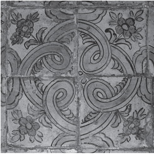
Fig. 3 - Maestranza palermitana, 1765, Pavimento (part.), maiolica policroma, Corleone, oratorio di Maria SS. del Carmine.

torio annesso all'antica chiesa di Maria SS. del Carmine di Corleone, che accoglie all'altare maggiore il dipinto su tavola della Madonna del Carmine del quarto decennio del XVI secolo 30 . Le maioliche con motivo vegetale e geometrico in verde, giallo e blu su fondo bianco (fig. 3) sono verosimilmente databili al 1765, data incisa sull'apertura marmorea della sepoltura della Compagnia del Carmine, inglobata nel pavimento.