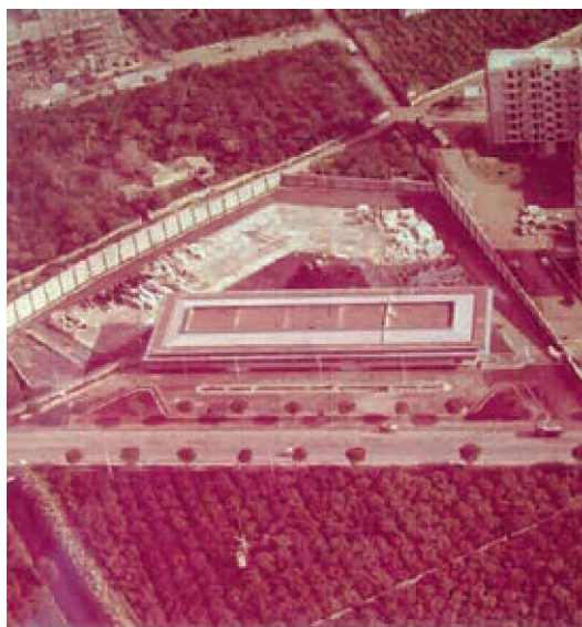
Fotografia aerea del 1967. Sul retro del lotto sono visibili le fondazioni dei magazzini

Già questi pochi tratti distinguono l'edificio dalla coeva produzione palermitana: un'intensa attività edilizia fortemente connotata da fenomeni di speculazione e abusivismo, leva economica del sistema affaristico mafioso che consolidò così la sua profonda influenza sulla dimensione politico-economica di Palermo. Lungo la circonvallazione, importante asse di espansione marcato con intensità dagli interventi speculativi, il padiglione rimarrà fra i pochissimi edifici esito di un processo compositivo. L'edificio si distingueva per i suoi valori architettonici principali, che si colgono bene per esempio attraverso le fotografie realizzate con un volo aereo nel 1967, al completamento delle prime due elevazioni 3 . Il padiglione, parallelo alla strada, di volumetria