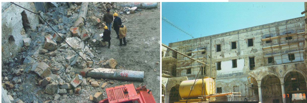
Figures 1, 2. Collapse following a mafia-style vandalism and related survey construction phases.

La colonna di Billiemi, nel precedente paragrafo menzionata, nell'urto