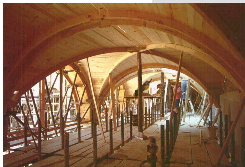
Figures 10, 11. Ribs of wooden centering and view of continuous intrados of the same supporting framework.