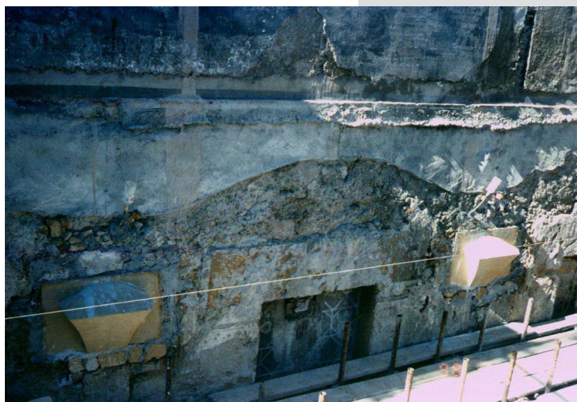
Figures 8, 9. “Pulvini” ashlars newly made from the stonemason, ready to receive the starting device of the stony cross vault.