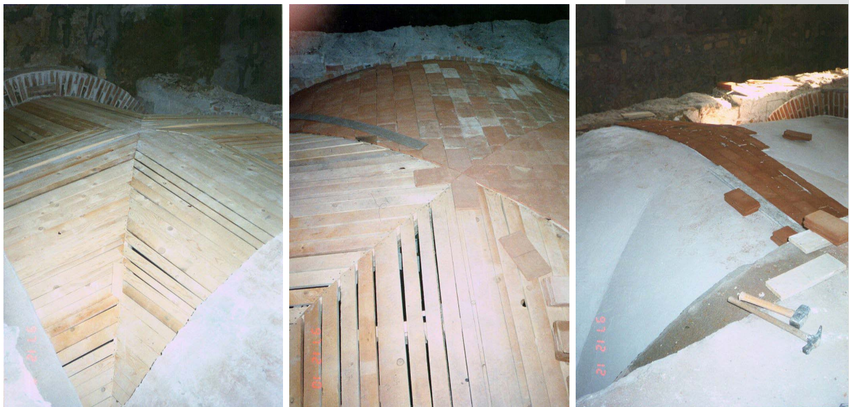
Figures 17, 18, 19. First "sheet" of thin dry bricks and second sheet of bricks overposed on the still fresh layer of gypsum paste.