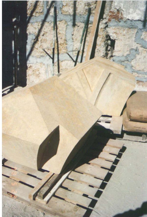
Figures 26, 27. A stonemason shaping the arches ashlar or that supporting the vaults at S. Anna la Misericordia convent.