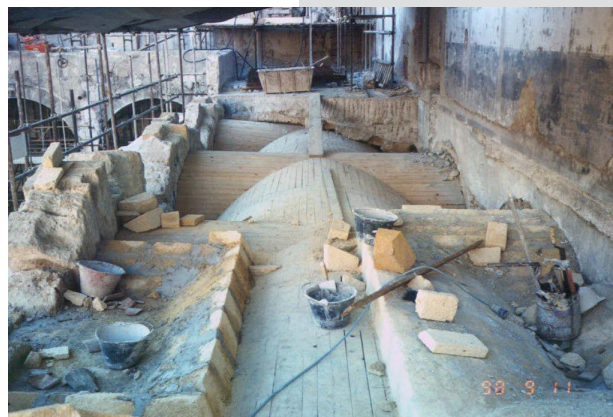
Figures 12, 13. Construction of stony vaults on the realized wooden supporting structure.