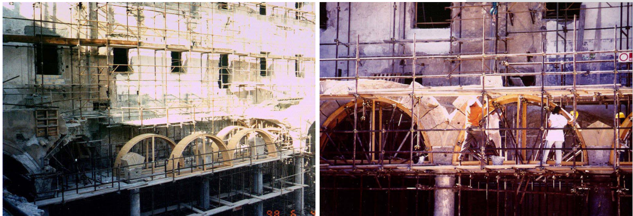
Figures 6, 7. Realization of wooden supporting structure of stony arches and of the carved stony ashlars of portico arches.

This construction experience allowed us to go beyond the pragmatism of the building yard's need and to review the construction phases as a fundamental chapter of stereotomic knowledge of an historical building: "doing" also resulted "explaining" how this architecture had been constructed, in a continuous and renewed dialogue between designer and employed stone masons; not only, through (re)construction phases the acquisition of knowledge reached high levels of technical depth, denouncing constructive defects and quality of technical elements, often being able to have true constructive sections, that only the collapse could determine. (Figures 8, 9)