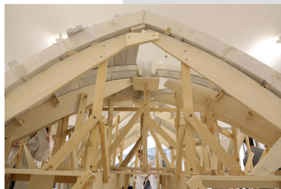
Figures 24, 25. Control of compliance of carved stone, respecting a “modano” model and realization of wooden centering, positioning the dry-carved ashlar to verify the exact matching of surfaces.