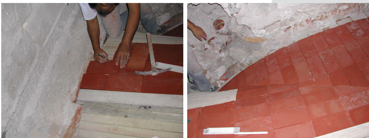
Figures 20, 21. Cutting and shaping of dry bricks in the construction site of Palazzo Bonocore.