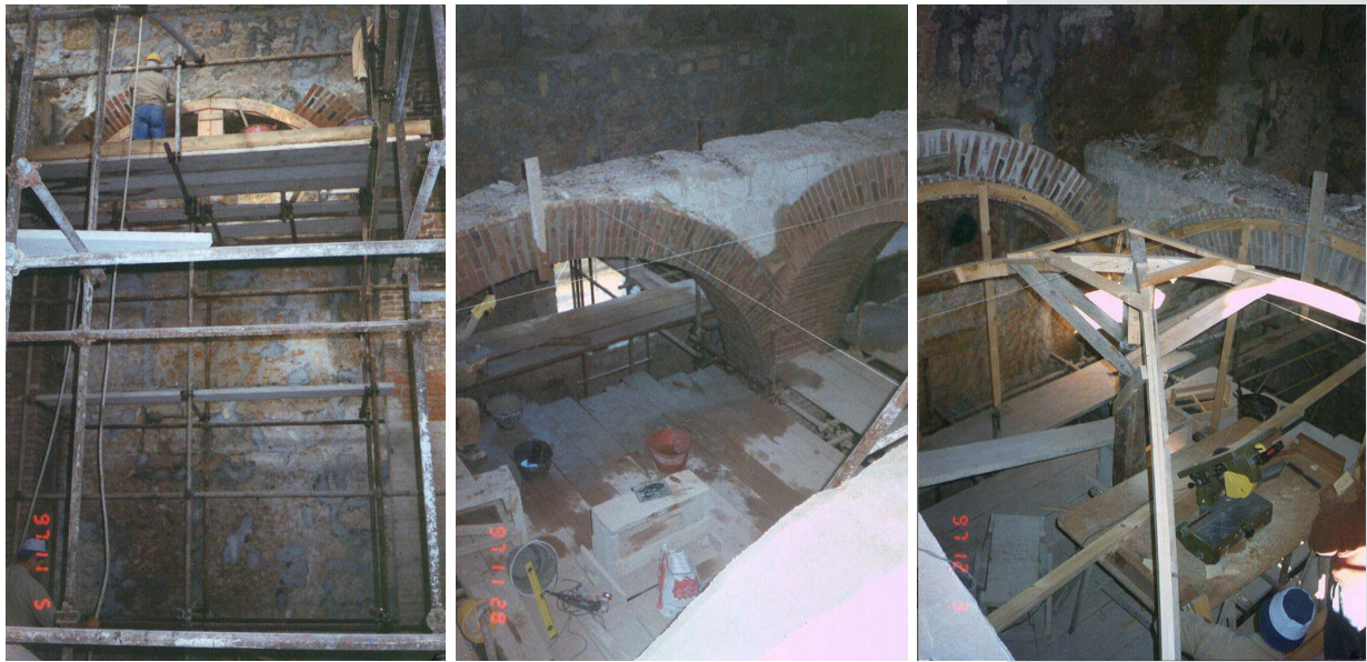
Figures 14, 15, 16. Construction of perimeter arches, using solid bricks and supporting the timber vaults.