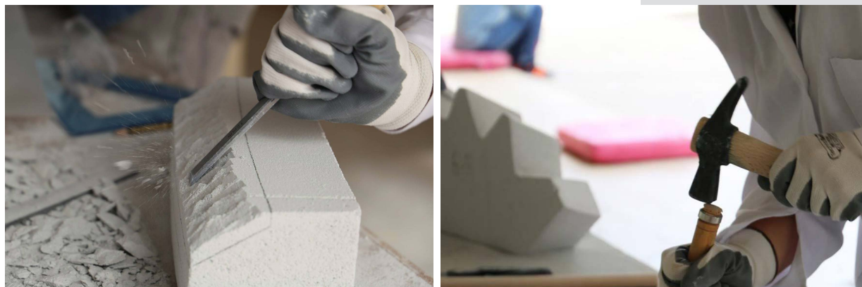
Figures 22,23. Carving phases related to rough-hewn cutting of ribs ashlars and completion operation of a cutting stone of the vault.