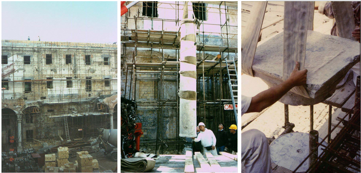
Figures 3, 4, 5. Construction of scaffolding; positioning of a new Billiemi column, re-positioning of a capitals of collapsed portico.