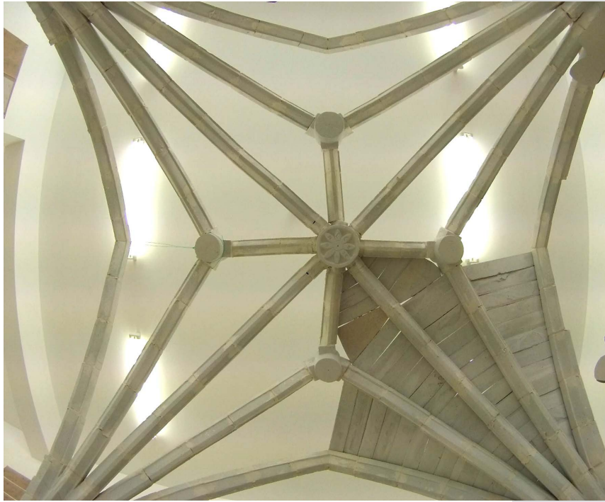
Figure 28. The structural rib system of the S. Maria della Catena church's vault, following dismantle phase. (©labstereounipa).