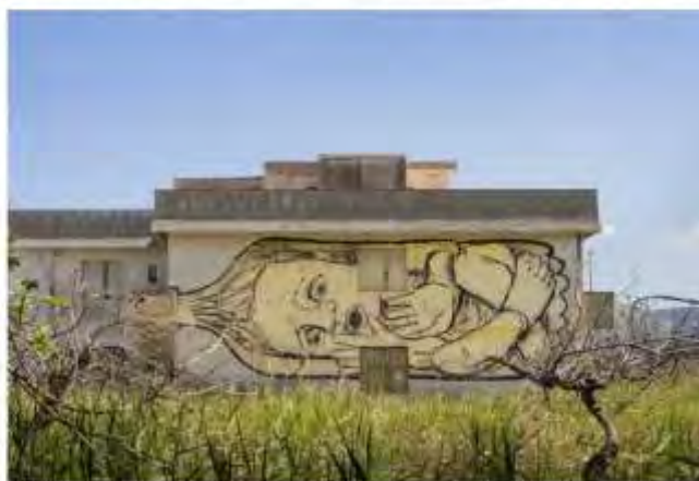
3: Lungomare di Carini (a) Un murale di NemO's. (b) Un murale di Collettivo FX con I mangiatori di patate (c) Un murale di Collettivo FX.