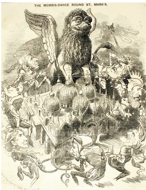
Fig. 1 - A satirical drawing taken from a pamphlet dating back to 1880 shows William Morris' defensive intention in protecting ancient buildings.

Tempo senza tempo e nuove forme di memoria – La Prima Rivoluzione Industriale, avendo interrotto la continuità tecnica della tradizione costruttiva, può essere considerata il fattore principale a cui ascrivere l'origine della stessa idea di patrimonio architettonico, basata sulla distanza dalla contemporaneità e sulla consapevolezza della irriproducibilità di quanto ereditato dal Passato. La svolta tecnologica oggi in atto, indicata come Quarta Rivoluzione Industriale (Rifkin, 2011; Schwab, 2015), ha già iniziato a produrre condizionamenti su questa idea, agendo sul piano culturale dei significati, molto più