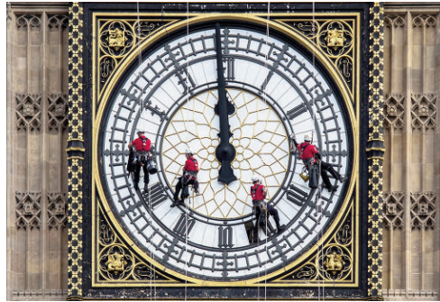
Fig. 7 - Big Ben Clock in London, under continuous maintenance.

teract with each other in the same message. The space of flows and timeless time are the material foundations of a new culture that transcends and includes the diversity of historically transmitted systems of representation [...]» (Castells, 2010, p. 406). 10) The 'transactive memory' is a concept used in the field of social psychology to study the effects of information sharing. This concept has been extended and applied to study how the ability to memorize any information is compromised by the extreme ease of finding it on the Internet (Sparrow et alii, 2011). 11) Many scientific contributions have focused on Time as a relevant theme in the field of the most common buildings, examining – for example – the effects on the architectural design (Giachetta, 2004) and on the management aspects and maintenance activities (Lauria, 2008). 12) «Inconstant world of gusty/rays, pallid hours, of perpetual / flux, cloud-glory: / a moment and see / changed forms glitter, millennia sway. / And the arch of the low door, steps smooth / with too many winters, a story in the brusque / brilliance of the March sun» (Piccolo, 1954; trans. by B. Swann and R. Feldman).