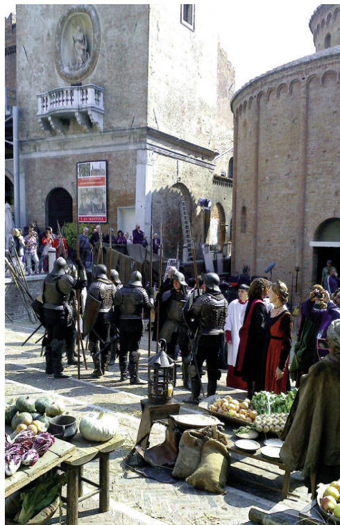
Fig. 5 - The set of the television drama second series I Medici: Master of Florence, set in Mantua with all due respect to the architectural historians (credit: www.youtube.com/watch?v=UYRqWjJpqlA ).

The ritual rebuilding of the Shinto Shrine of Ise, in Japan, has given a reference for highlighting the fact that, not only the product, but also the process can be 'authentic' (Germanà, 2013). As soon as the ceremony of transferring the goddess to the new temple is over, the twenty-year process of dismantling and replacing the previous one begins: the temporariness of the sacred construction