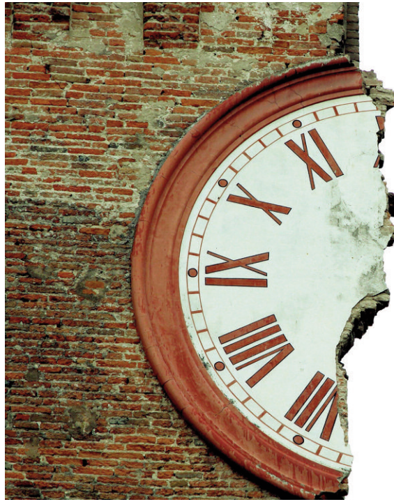
Fig. 6 - The Clock Tower in Finale Emilia (northern Italy), after the earthquake in May 2012 and subsequently entirely collapsed.

Timeless Time and new kinds of memory – The origin of the very idea of architectural heritage, based on the distance from contemporaneity and on the awareness of the irreproducibility of what was inherited from the Past, is connected to the First Industrial Revolution and to the consequent interruption of the technical continuity of the constructive tradition. The technological breakthrough currently underway, referred to as the Fourth Industrial Revolution (Rifkin, 2011; Schwab, 2015), has already begun to produce conditioning on this idea, acting on the cultural level of meanings, much more than on the technical level of the materials and construction techniques. Digitization has allowed extraordinary experiential forms, which have triggered a profound transformation in the relations between individuals, in communication and in society, with effects already evident in the short term and more controversial in the long term. Such a transformation is so incisive because it acts on two fundamental concepts in the mutually connected human experience: Space and Time 9 . On the one hand, the Space of Places, is replaced by the Space of Flows, which exists independently of the continuity with a specific physical support, at the indi-