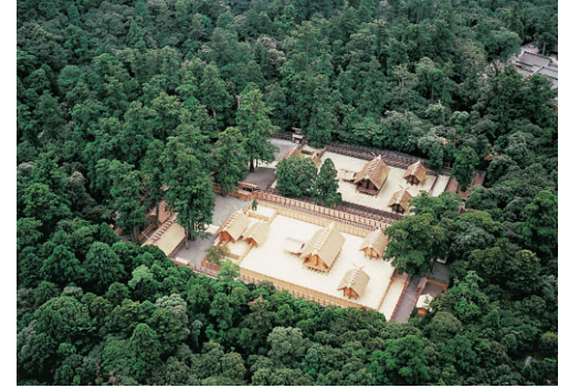
Fig. 2-4 - Left: Aerial view of Diosgyor, Hungary. Center: People in medieval costumes are posing with a background of the Borgund Stavkyrkje (Norway); the church, built between 1180 and 1250 a D. and made entirely of wood with a palisade structure, presents most of the original building elements. Right: The Great Shinto Shrine of Ise in 2013, old shrine and new, immediately prior to the Sun goddess's progress of 2 October.

che sul piano tecnico dei materiali e tecniche costruttive. La digitalizzazione ha consentito forme esperienziali straordinarie, che hanno innescato una profonda trasformazione nelle relazioni tra individui, nella comunicazione e nella società, con effetti già evidenti nel breve termine e più controversi nel lungo termine. Come ha teorizzato Manuel Castells 9 , tale trasformazione è così incisiva perché agisce su due concetti fondamentali nell'esperienza umana reciprocamente collegati: lo Spazio e il Tempo. Da una parte, lo Spazio dei Luoghi, è sostituito dallo Spazio dei Flussi, che esiste in modo indipendente dalla contiguità con uno specifico supporto fisico, a livello individuale o collettivo. Dall'altra, l'istantaneità molteplice del tempo senza tempo (Timeless Time) ha sfilacciato la continuità che caratterizzava le precedenti concezioni del Tempo, mettendo in crisi la stessa memoria, essenziale fondamento del patrimonio culturale nella sua valenza intergenerazionale.