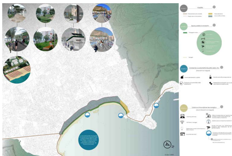
Figura 3 | Seconda ipotesi di progetto.

La seconda ipotesi di progetto è stata una mediazione tra la prima sopra descritta e gli elementi raccolti da un'intervista ad un testimone privilegiato: in questo caso, il responsabile della società Mondello Immobiliare Italo-Belga. Uno degli elementi emersi dal dibattito riguarda la presenza delle cabine in spiaggia e la loro funzione. Apparentemente queste sembrano ricoprire un ruolo secondario all'interno delle dinamiche del quartiere, ma tendono ad assumere molta importanza in quanto si caratterizzano come alcuni tra gli elementi che rappresentano l'identità di questo territorio costiero. A tal proposito le ipotesi di intervento scaturite dall'intervista vogliono mettere in risalto gli aspetti salienti del litorale di Mondello e vogliono, allo stesso tempo, promuovere una politica basata sulla sostenibilità ambientale del quartiere. Si tende, quindi, con questa seconda ipotesi progettuale a rendere il lungomare di Mondello un punto nevralgico per la città di Palermo e per la fruizione turistica, un progetto che volge il suo sguardo alla sostenibilità, all'innovazione tecnologica e alla promozione di un turismo sostenibile.