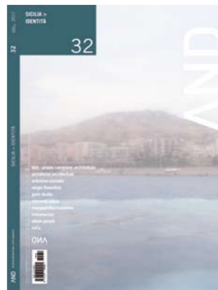
in copertina/cover: Stretto di Messina/ Strait of Messina

AND rispetta l'ambiente stampando su carta FSC