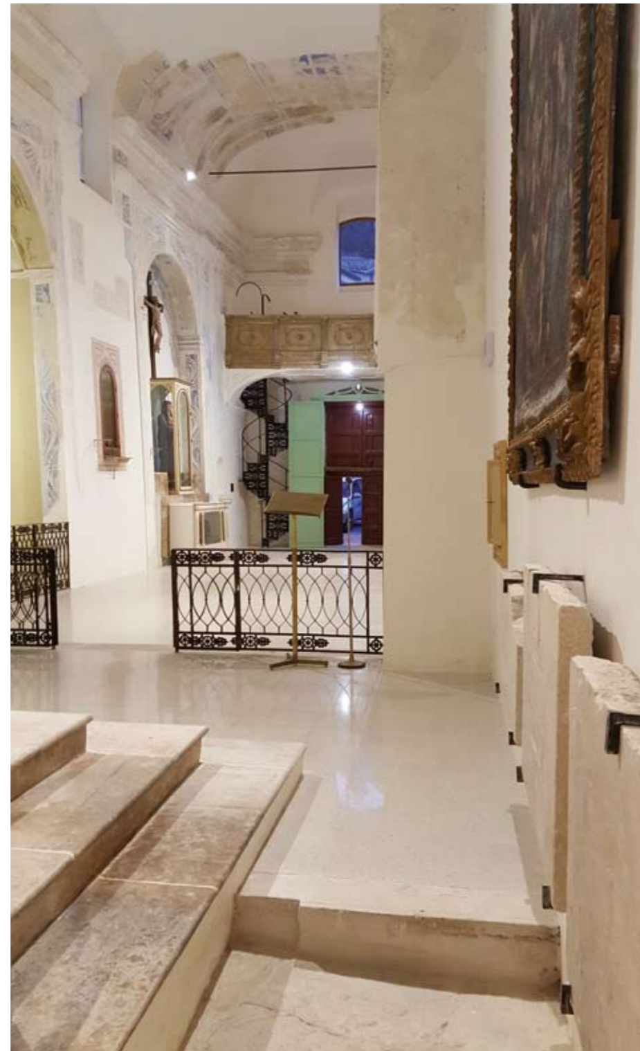
in apertura/ opening page: Vista verso l'ingresso e la cantoria/ View towards the entrance and the choir

essere state messe in sicurezza, drammaticamente narrano le deformazioni, i crolli, la corruttibilità della materia. In questa luce, idealmente, l'intervento si riallaccia alla tradizione recente di alcune architetture in Sicilia, che raccontano la tragicità della storia ed esprimono una forte capacità di interazione, come lo spazio scopercchiato della chiesa di Santa Maria dello Spasimo a Palermo (Giovanni Palazzo, 1985) in cui possono continuare a crescere due alti alberi di sambuco, o la conversione in piazza della Chiesa Madre di Salemi (Álvaro Siza e Roberto Collovà, 1987-1988) in cui si riutilizzano con una nuova sintassi parti dell'edificio e frammenti recuperati. Nonostante la natura e la dimensione dell'intervento il restauro chiesa di San Biagio consente di riaffermare una ideologia di progetto fondata sulla lettura e interpretazione dell'esistente, oltre che sulla ricerca dell'essenzialità, per cui l'architettura si libera del superfluo e reintroduce o svela, una qualità che il manufatto già possiede. Il progetto, quindi, legge ed esalta questo tipo di spazialità; e l'architettura si definisce lavorando sull'idea di continuità e sui procedimenti di scavo e di sottrazione che, nel caso specifico, consiste nel lavoro di liberazione e disvelamento dell'essenza primaria dello spazio e delle stratificazioni che un attento sguardo può adesso cogliere. L'architettura può adesso raccontare la sua storia.