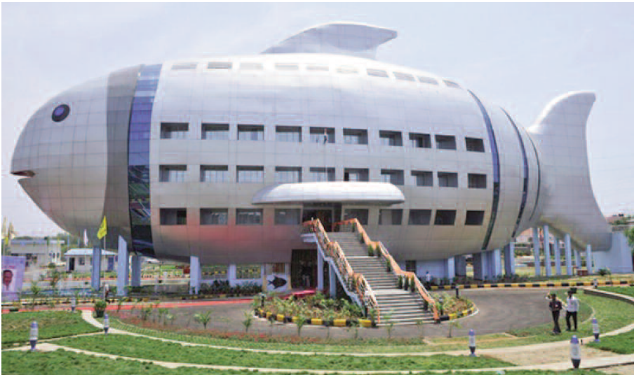
Fig. 6 - Hyderabad in India (GA. Architects, 2012). È un uccello? È un aereo? ... Banalmente un pesce.

è possibile più essere radicati ai vecchi retaggi culturali per cui “una casa è per sempre”. La nostra società ci richiede di ripensare ad ogni cosa sin qui fatta, perché tutto, in modo o nell’altro, si è dimostrato essere pesante e caduco già dopo pochissimi anni, impossibile da trasformare o adeguare. Dunque reversibilità, riconversione e rigenerazione divengono le parole chiave del prossimo futuro al passo con le trasformazioni ambientali (climatiche e sociali), con le trasformazioni necessarie in cui incorrono i nostri centri storici (terremoti, obsolescenza, abbandono), con le diverse destinazioni d’uso che il già costruito spesso necessita (Figg. 9, 10). Quindi un nuovo ordine a confronto con l’apparente disordine del costruito, mediato da un sapiente progetto che ripensi l’Architettura quale nuova risposta al “già costruito” attraverso attività realizzative condotte per pezzi (solamente da montare e smontare), capaci di rigenerare l’esistente secondo le diverse condizioni sia d’uso, sia funzionali e sia estetiche.