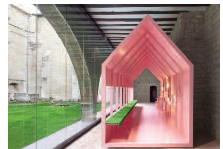
Fig. 9 - Occidens Museum a Pamplona en España (Studio Vaillo + Irigaray, 2012).

Conclusions - Today no space can be reinvented and man tries to investigate every form of living making an effort to remedy mistakes made. However, it should be borne in mind that every action, every activity related to living in one way or another is extremely energetic and invasive, both for resource consumption and for the consumption of the territory. Even today we continue to realize structures and