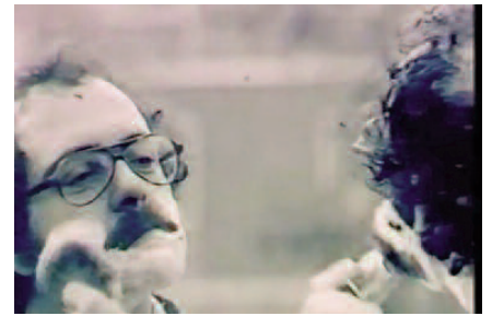
Fig. 3 - Ugo La Pietra: Abitare è essere ovunque a casa propria, immagini della performance tratte dal video (Linz, 1979).

Ciò vale sotto ogni profilo, da quello estetico a quello funzionale, da quello formale a quello strutturale; ogni azione del costruito se non entra in dialogo continuo con il “sistema città e il suo territorio” non ha più ragione di esistere. In tal senso anche la nota citazione di Renzo Piano «costruire sul costruito» 10 , secondo la quale le città del futuro potranno crescere solo per implosione o finiranno in un disastro, potrebbe diventare stretta. In primo luogo, le città non hanno più motivo di crescere, ma di trasformarsi o addirittura di ridursi. La parola stessa costruire, pertanto, dovrebbe esser indicativa di ben altro. Lo spazio usato è ormai totalmente in eccesso a ogni necessità di questa società, mentre si dovrebbero prevedere nuovi sistemi legislativi, tali da permettere al costruito di convertirsi e di rigenerarsi sotto altre capacità tecniche e tecnologiche.