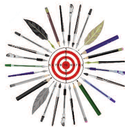
Fig. 2 - Le migliori idee e i migliori progetti sono uniti da obiettivi.

Conclusioni - Oggi nessuno spazio può più esser reinventato e l'uomo cerca d'indagare su ogni forma dell'abitare cercando di porre rimedio agli errori commessi. Tuttavia, occorre tenere presente che ogni azione, ogni attività legata all'abitare in un modo o nell'altro è estremamente energivora e invasiva, sia per consumo delle risorse, sia per il consumo del territorio. Ancora oggi si continuano a realizzare strutture e costruzioni che disprezzano il buon senso, che mortificano le logiche del giusto e del corretto, dell'equilibrio. Amiamo solo parlare di "eco-compatibilità e sostenibilità", ma in vero non riusciamo ancora a progettare con metodi e sistemi costruttivi leggeri e non invasivi. Nuove costruzioni offendono ogni logica di coerenza verso la nostra Terra: presuntuosi atti costruttivi di questo tempo (Fig. 6) che ancora una volta si dissociano dalle necessità che invece dovremmo avere nel rispetto dei delicati equilibri ambientali. L'uomo dovrebbe smettere definitivamente di macchiare, di contaminare, di pretendere che lo spazio continui ad accogliere ogni costruzione figlia dell'idiozia: l'Architettura è, e rischia, di esser materia del sempre. Ogni cosa che realizziamo segna in modo indelebile il territorio e lo spazio. Le città brulicano di strutture e costruzioni che cadono a pezzi, i cui costi manutentivi sono sempre più onerosi e impegnativi; ancor più costosi rimangono gli oneri di dismissione, di trasformazione e di rigenerazione.