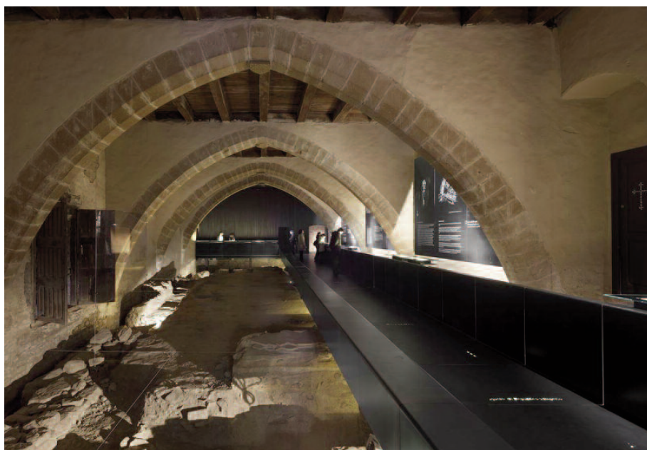
Fig. 10 - Occidens Museum a Pamplona in Spagna, (Studio Vaillo + Irigaray, 2012).

In this sense, “dry structures” can be an immediate response to this new logic of building; last but not least, as being ‘isostatic’, they would be more effective against natural disasters, so more resilient (earthquakes, cyclones, floods, etc.), with the advantage of cutting down to 70% the times of realization and minimizing the costs of maintenance to the point (in some cases) of eliminating them completely, replacing components and recycling old ones. A new easy 12 Architecture composed only of smart pieces that can be assembled each time in a different way, so as to regenerate with little nature, shape, function and location. Pieces of Architecture that will allow Architecture itself to be reconsidered as a response to the immediate