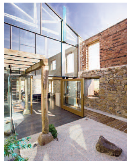
Fig. 7 - Casa La Ruina Habitada a Palencia in Spagna (Oli, 2016).

Order, disorder, design - Order is determined by any sort of relationship among two or more objects that can be expressed by a rule. This concept, that is most generic, was articulated by Gottfried Wilhelm