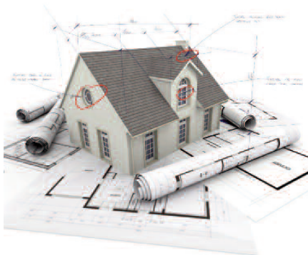
Fig. 1 - Strumenti da regista.

KEYWORDS: Ordine, disordine, rigenerazione. Order, disorder, regeneration.