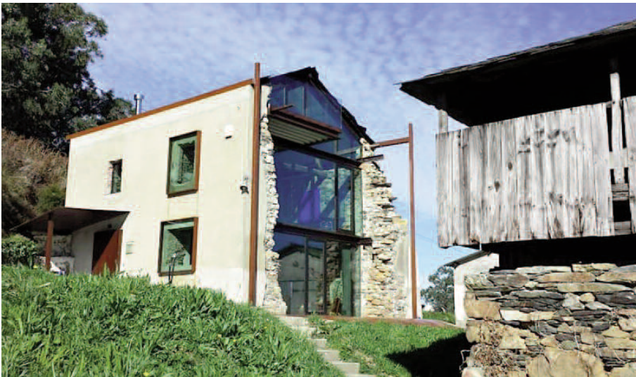
Fig. 8 - Reforma Vivienda Unifamiliar a Gijón en España (De Miguel, 2016)..

von Leibniz for the first time in a passage of Discourse on Metaphysics (1686): «What passes as extraordinary is only with respect to some special order established between creatures because, as far as universal order is concerned, everything is perfectly harmonious. This is so true that nothing just happens in the world that is absolutely out of order, but you cannot even imagine something that is as such [...]. For example, there is no face whose contour does not form part of a geometric line and cannot be traced out of a single stretch by means of a certain set motion. But when a rule is very complex, its attributes go uneven. Thus it can be said that in any way God created the world, the world would always have been regular and provided with a general order» 3 . On the other hand, the positive function of disorder is outlined in an analysis by the philosopher Henri-Louis Bergson which states that this term does not mean the absolute absence of order but only the absence of the sought order and the presence of a different order. Bergson then reduces to two fundamental types of order, which, by substituting each other, lead to talk of disorder, that is, the geometric order and the vital order: «Astronomical phenomena will be said to show an admirable order, meaning that it can be predicted mathematically. And there will be a no less admirable order in a Beethoven Symphony that is the brilliance, the originality and consequently the unpredictability itself». 4