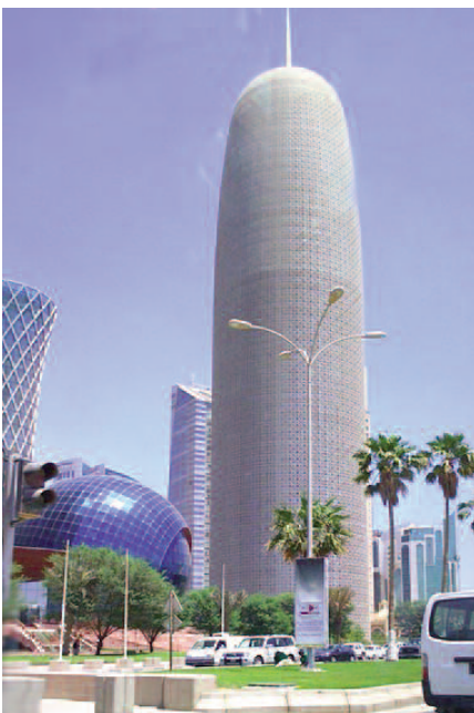
Fig. 4 - La Torre di Doha (Qatar) o Burj Tower, la cui fallica forma gode della virilità assunta del suo progettista (Nouvel, 2004).

Così se questo approccio costruttivo temporaneo potrà essere connesso con al sistema off-grid 13 , sarà possibile re-immaginare le città in smodo liquido e dinamico e coerente con il nostro ambiente. Non