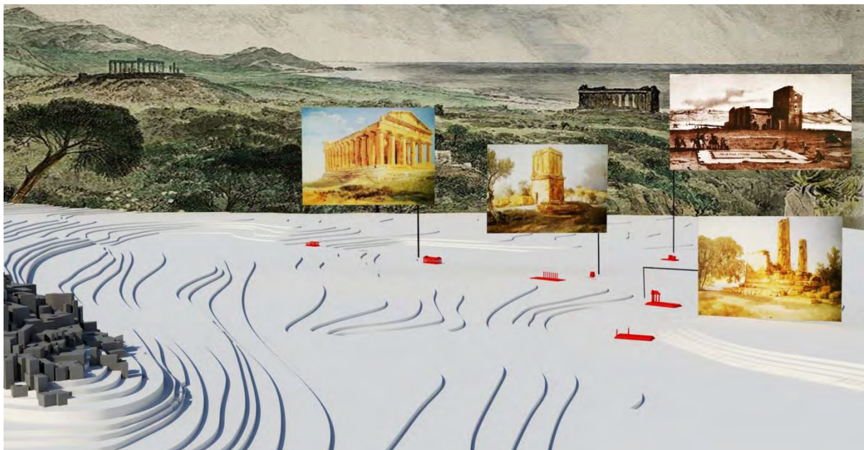
Fig. 3 – Ricostruzione digitale del modello orografico di Agrigento. Da sinistra a destra le vedute originali del tempio della Concordia, della tomba di Terone, del tempio di Esculapio e del tempio di Vulcano (J. P. Houël, 1787). Sullo sfondo, una vista dalla città medievale verso il mare di J. Schubring del 1865

Molto spesso alcune delle rappresentazioni realizzate da questi viaggiatori riportano ricostruzioni grafiche che danno contezza dei valori armonici e proporzionali che definirono i dettami compositivi dell'architettura classica. Nella Figura 3 è stata inserita una veduta originale del tempio di Esculapio, realizzata da J. P. Houël, nella quale il viaggiatore fa poggiare sul suolo una ricostruzione planimetrica del tempio.