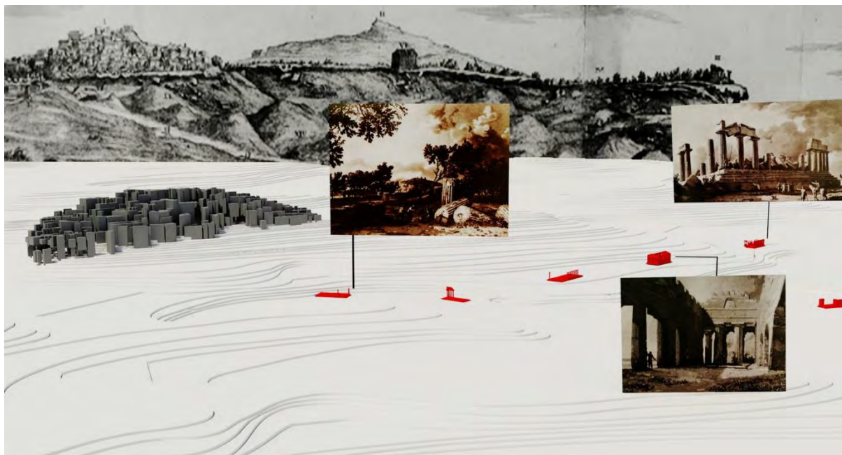
Fig. 4 – Ricostruzione digitale del modello orografico di Agrigento. Da sinistra a destra le vedute originali dei templi di Giunone, della Concordia e di Vulcano (J. P. Houël, 1787). Sullo sfondo, una vista della città medievale di G. M. Pancrazi del 1751

In riferimento alla corrispondenza visuale e immaginativa configurata da Houël si rimanda all'idea di pianta quale «luogo privilegiato dell'elaborazione dei dati funzionali e distributivi, del gioco delle chiusure e delle comunicazioni, dell'impostazione costruttiva della fabbrica» 4 , suggerita da Vittorio Ugo, secondo il quale «soltanto la sua integrazione con le proiezioni 'verticali' fornisce l'informazione completa» 5 .