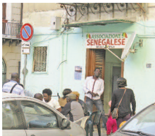
Fig. 5 - L'associazione senegalese a Piazza Santa Chiara.

Il Mercato di Ballarò all'Albergheria - Particolare attenzione meritano i mercati storici di Palermo, un tempo punto nevralgico delle attività commerciali e delle relazioni sociali dei Palermitani, assumono oggi una nuova dimensione simbolica, da