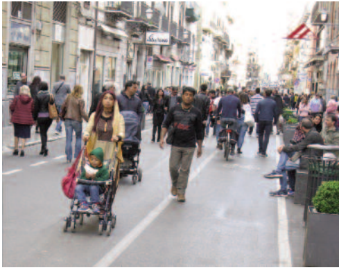
Fig. 10 - Un tratto di via Maqueda.

importance for history and culture, it finds its origins in the Punic-Phoenician city: a limb of land bordered by two of the many rivers (Kemonia and Papireto), which once paved the territory of what that will be the city of Palermo. The foundation date of the city is unknown, but the archaeological finds of the remains of the Phoenician Palermo date back to the 7th century B.C. In Roman times the city included an older nucleus, Paleapolis, located on the highest part of the hill, and the most modern Neapolis, located below (Fig. 4). The city expands in the Arab era, with its urban texture characterized by a building textiles marked by a capillary system of alleys and streets from which the medieval city emerges.