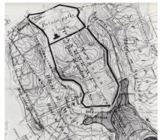
Fig. 4 - Carta realizzata nel 1910 da Columba con la ricostruzione ipotetica dell'area del primo insediamento umano.

La nuova facies di Via Maqueda - La “strada nuova”, così chiamata fin dalla sua realizzazione,