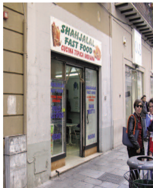
Fig. 7 - Una tipica cucina indiana in via Maqueda.

Conclusioni - Sono questi i nuovi contesti culturali e sociali di una città che vive la presenza di identità etniche differenti in un tessuto urbano ricco e articolato in cui emergono pratiche di organizzazione spaziale che pur nelle loro differenti espressioni trovano il loro punto di riferimento nel Centro Storico, polo di immigrazione