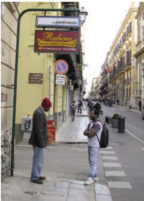
Fig. 9 - Dei forestieri in via Maqueda.

Ma si tratta solo di una pacifica convivenza o di una vera integrazione? Il recupero della Chiesa di S. Paolino dei Giardinieri e la sua destinazione a Moschea è senza dubbio un esempio di buona pratica di tolleranza e integrazione, così come la costituzione di numerose associazioni culturali per immigrati. Ma tuttavia, in una realtà così articolata sotto il profilo sociale, la città non è esente da occasioni sporadiche di scarsa coesione sociale e conflittualità tra le numerose e variegate comunità che vivono il Centro Storico, ognuna di esse con tempi e modi propri: vecchi residenti, studenti e lavoratori pendolari, immigrati, palermitani che tornano ad abitare i quartieri risanati, portatori di nuovi stili di vita, nuove attese e interessi. L'incendio della Moschea del Bangladesh e il più recente episodio avvenuto ad aprile di quest'anno nel quartiere di Ballarò, in occasione del quale sono state imbrattate alcune targhe delle vie del Centro Storico i cui nomi scritti in arabo e in ebraico, accanto all'italiano, sono stati cancellati con la vernice, è la dimostrazione tangibile di quanto il conflitto etnico sia un'insidia pronta ad insinuarsi e ad alterare i delicati equilibri sociali e territoriali anche all'interno