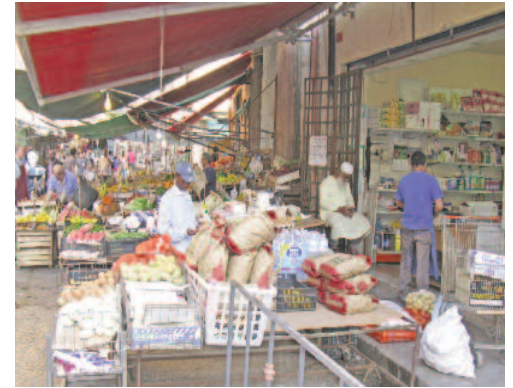
Figg. 11, 12, 13 - Al Mercato di Ballarò.