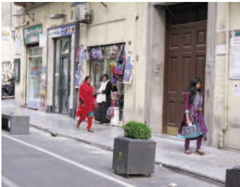
Fig. 8 - Alcuni negozi in via Maqueda.

culturale in una Palermo che si è sempre distinta nei secoli per il suo carattere accogliente e per la sua intrinseca natura multiculturale, eredità di un passato di dominazioni e contaminazioni.