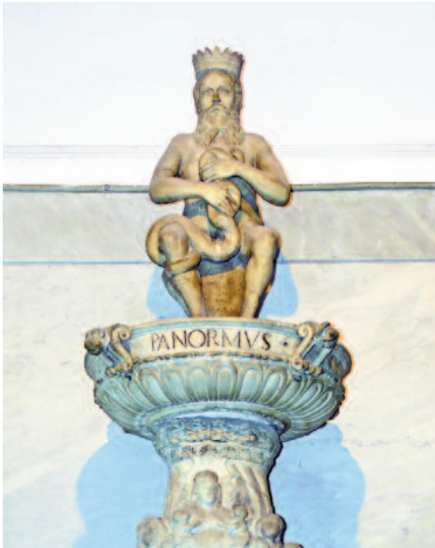
Fig. 2 - Gruppo statuario del Genio a Palazzo Pretorio.

identifichiamo con la “città compatta”, memoria storica di un passato fatto di incontri tra popoli che hanno generato mescolanze, interazioni e fusioni dando vita ad un processo di contaminazione culturale che ha reso Palermo unica nel suo genere.