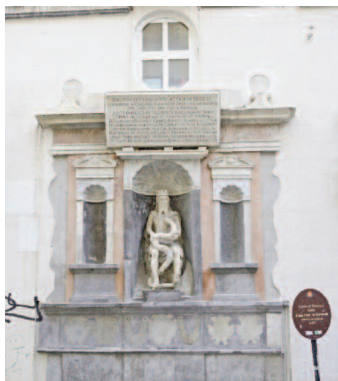
Fig. 1 - Il Genio di Palermo in via Argenteria.

Le più grandi comunità straniere sono costituite da cittadini provenienti dal Bangladesh e dallo Sri Lanka che, insieme, costituiscono oltre un terzo del totale degli stranieri appartenenti a 126 diverse cittadinanze, tra cui rumeni, ghanesi, filippini, marocchini, tunisini, cinesi, mauriziani. Queste diverse comunità sono distribuite su un territorio comunale che si estende su una superficie di km quadrati 158,8 suddivisa in otto circoscrizioni. Contrariamente a quanto avviene in altre città italiane ed europee, dove i cittadini stranieri trovano generalmente sistemazione in quartieri periferici anonimi, privi di infrastrutture e servizi primari, ai margini delle città ed esclusi dalle zone centrali, a Palermo la presenza straniera si concentra soprattutto nel cuore della città (Fig. 3). La Circoscrizione con l'incidenza più elevata di stranieri è, infatti, la Prima, che si identifica con il centro storico di Palermo: un quadrilatero di circa 240 ettari impreziosito da 158 chiese, 55 conventi, oltre 400 palazzi nobiliari, 7 teatri, edifici residenziali su circa il 40% della superficie totale, strade, piazze e spazi pubblici, risultato di un costante e incessante processo di stratificazione urbana che si è succeduto nei secoli dando vita a quello che oggi