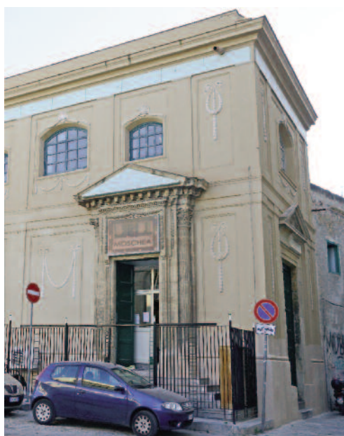
Fig. 6 - La moschea sunnita-tunisina in via del Celso.

cui trae forza l'identità etnica delle comunità straniere, che hanno operato su questi spazi un processo di lenta ma determinante rifunzionalizzazione, dando nuovo impulso vitale anche alle attività tradizionalmente presenti in questi luoghi e con le quali spesso si instaura una rete di contatti e relazioni che coinvolge anche i residenti autoctoni. I primi insediamenti urbani del quartiere dell'Albergheria 6 risalgono alla dominazione arabo-normanna, durante la quale questa porzione di territorio presentava un insediamento urbano a carattere produttivo e residenziale, caratterizzato prevalentemente da catoi , abitazioni modeste che ospitavano perlopiù contadini, artigiani e giardinieri che vivevano in estrema povertà e degrado ambientale dovuto anche alle pessime condizioni igienico sanitarie e ai frequenti straripamenti dagli argini delle acque del fiume Kemonia 7 che attraversava il quartiere.