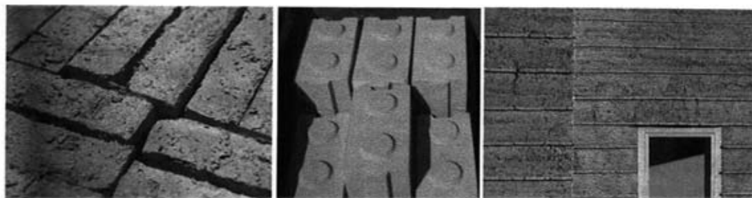
Figg. 3, 4, 5 – Adobe (a sinistra); blocchi compressi (al centro); muro in pisé (a destra).

apposite casseforme: il materiale viene inserito in strati di cm 5-12 e battuto fino ad arrivare a strati di circa cm 80.