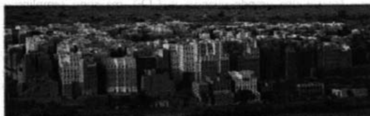
Fig. 2 – La città di Shibam nello Yemen del sec. XVI.