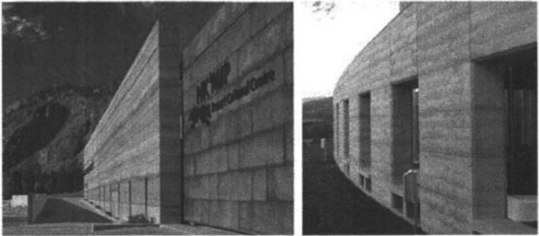
Figg. 6, 7 - Il muro in pisé del Nk'mip Cultural Centre in Canada (a sinistra); il TarraWarra Museum of Art in Australia (a destra).