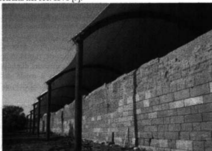
Fig. 1 – Le fortificazioni di Capo Soprano a Gela del sec. IV a.C.

maggior numero possibile di persone; promuovere le risorse locali, sia umane che naturali, il miglioramento delle condizioni di vita, valorizzare la diversità culturale e mantenere sistemi di sostegno sociale per la costruzione e la manutenzione dell'ambiente costruito; utilizzare un calcestruzzo naturale, che offra una vera alternativa ecologica ed economica rispetto a materiali e processi produttivi nocivi per l'ambiente. L'uso della terra cruda nelle costruzioni vanta una tradizione millenaria che si è sviluppata in tutte le aree geografiche: secondo Berge [2] ed altri studiosi [3] le testimonianze più antiche sono da ricercarsi nella Valle del Tigri, risalenti al 7500 a.C.; la Grande Muraglia cinese la cui costruzione iniziò circa 3000 anni fa, presenta ampie sezioni costruite in terra cruda così come il Tempio Horyuji in Giappone risalente a 1300 anni fa [4]; le rovine della città di Chanchán in Perù e il villaggio di Taos nel New Mexico sono tra le testimonianze più antiche di costruzioni in terra cruda [5]; i resti delle fortificazioni greche di capo Soprano a Gela in Sicilia [6-8], risalenti al sec. IV a.C. note anche per la presenza di muri in terra cruda (Fig. 1) o le città mediorientali interamente realizzate in terra, come Shibam nello Yemen (Fig. 2), costruita nel sec. XVI [9].