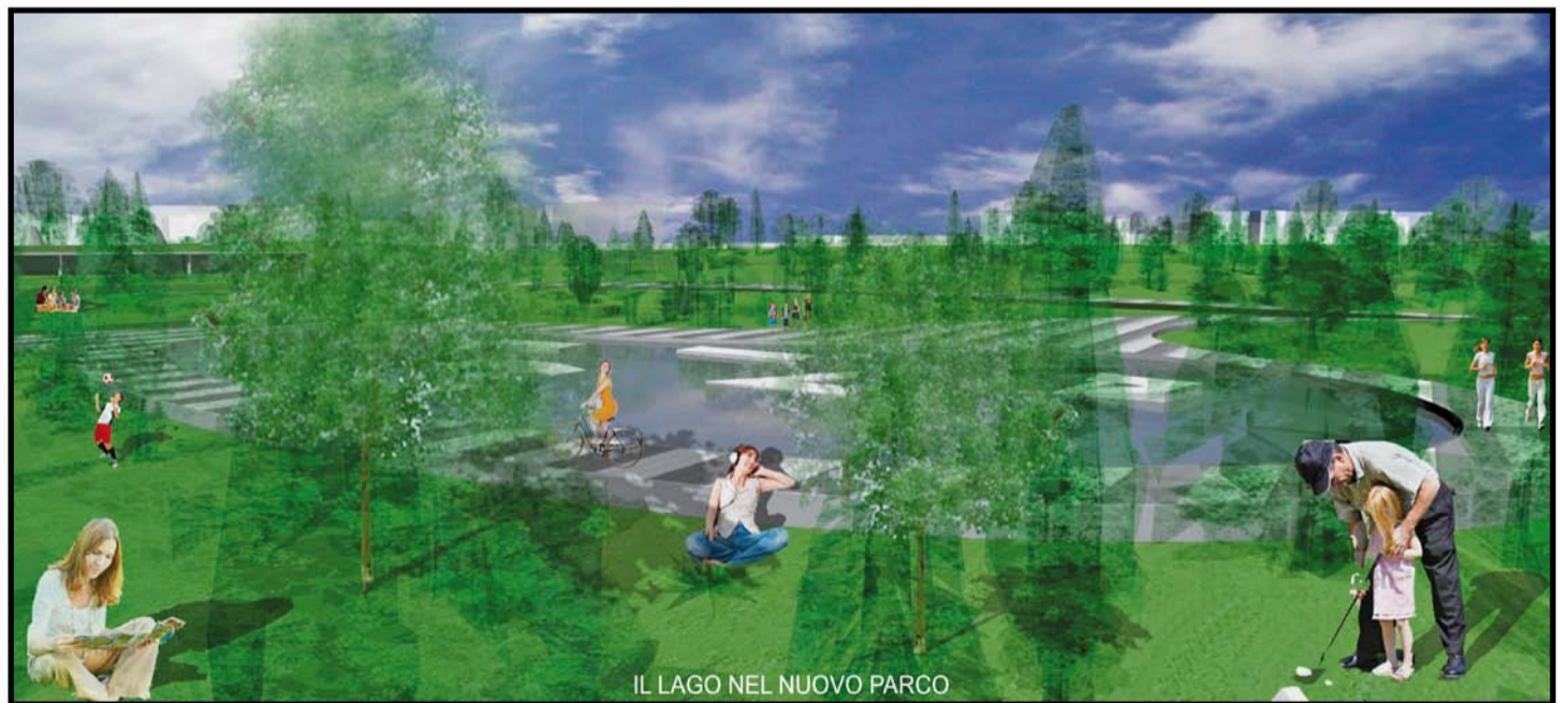
IL LAGO NEL NUOVO PARCO