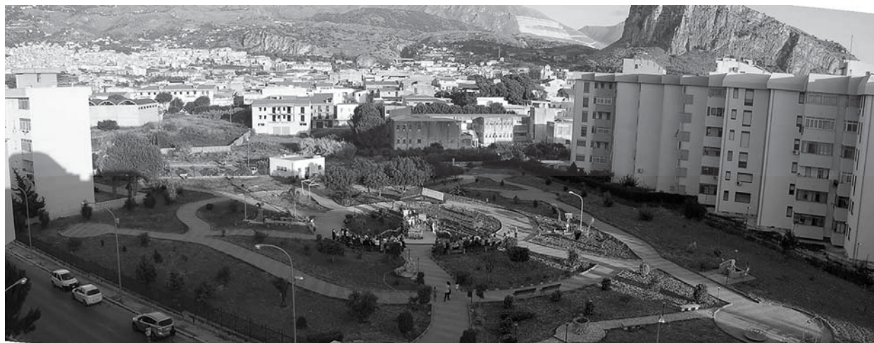
Fig. 3 – Villa San Pio durante una celebrazione religiosa, luglio 2014.

vano se necessario, per chiarire meglio i punti che li riguardavano in prima persona (ad esempio chi si occupa maggiormente della cura del verde è intervenuto quando si è affrontato quell'argomento). Gli abitanti hanno dimostrato sicurezza assoluta nel ribadire che le azioni intraprese non sono, a loro avviso, illegali, in quanto l'amministrazione non ne contrasta l'operato ed è presente soltanto in occasione di avvenimenti religiosi; questo aspetto, peraltro, genera ancor più malcontento e delusione.