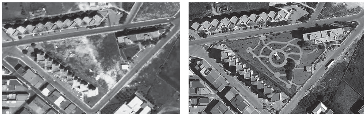
Fig. 2 – Confronto tra foto aerea del 2002 e foto aerea del 2013.

All'interno si trovano alcune opere finanziate o realizzate dai membri del comitato spontaneo e da alcune imprese locali, che spesso forniscono parte del materiale gratuitamente. Sono stati costruiti l'altare di cui sopra, un pozzo ornamentale, una fontana, cappelle e percorsi secondari. Molte attività si svolgono durante ricorrenze religiose, organizzate nel periodo primaverile ed estivo fino al 23 settembre (anniversario della morte di San Pio), portando in processione la statua del Santo per le vie del quartiere. Inoltre sono presenti giochi per bambini, donati da asili in dismissione, e gli abitanti curano minuziosamente il verde della villa.