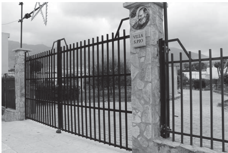
Fig. 4 – Cancelli di Villa San Pio chiusi nelle ore diurne, febbraio 2016.

Nel caso di Villa San Pio, la contraddizione è esemplificata magnificamente dalla cancellata di accesso, che impedisce l'uso di questo spazio "pubblico" a chi non gode della fiducia dei suoi custodi, a chi è estraneo alla comunità. Il commoning , allora, è uno strumento di apertura o di chiusura? E, nel caso di Partinico, sarebbe possibile ipotizzare commons aperti ma che allo stesso tempo non cadano in situazioni di degrado o di noncuranza degli enti pubblici? Oppure la chiusura è l'unico modo che può garantire un miglioramento della qualità della vita per la comunità?