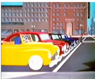
Fig. 6. Carros parados ao semáforo, posicionados em posição de partida

o semáforo imediatamente se torna outra coisa: não um instrumento de regulação do tráfego urbano, mas algo muito similar a seu contrário: uma espécie de gongo a partir do qual se empreende uma verdadeira corrida automobilística. Os carros se dispõem nervosamente ao longo da linha de partida [fig. 6], de modo que, assim que surge o sinal verde, todos disparam como loucos, até... o sinal vermelho seguinte, e assim continuando até o exaurimento nervoso, ou melhor, até a demasiado humana perda de controle do veículo. Wheeler bate contra o poste de outro sinal vermelho e então, como enésima variação, o carro quase destruído, em uma pausa obrigatória, torna-se lugar de passagem para um cortejo de passageiros que desce do ônibus parado ao lado [fig. 7]. Não mais meio de transporte, portanto, mas um tipo de passarela formada inesperadamente e uma criativa bricolagem urbana. Até que o último passageiro, muito educado, feche a porta do carro cumprimentando o pobre Wheeler, derrotado pelo vergonhoso acontecimento que está suportando. Menos mal – como válvula de escape infantil – que há pé-móveis desventurados para descontar: é ótimo espirrar água suja sobre eles, passando com velocidade sobre poças de água.