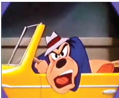
Fig.12. Olhar de Walker/Wheeler no carro

Por outro, em uma observação aprofundada, não há mais o Wheeler de sempre, sistematicamente oposto ao dócil Walker, mas uma espécie de termo complexo entre os dois personagens: um Walker-Wheeler que, tendo encontrado um inimigo em comum, se aliam inesperadamente entre si. De quem se trata? Obviamente do narrador, que enquanto expõe sua óbvia moral benfeitora – “que isso lhe sirva de lição, dirija com atenção, respeite as regras...” – recebe um conclusivo, e útil, “ shut up! ” [fig. 12].