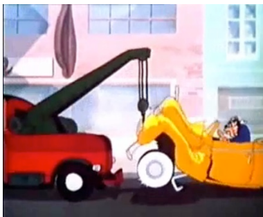
Fig.11. Carro e caminhão guincho

a do acidente. Tentando sair do estacionamento de forma ruidosa e desajeitada – uma batida à frente, outra atrás – Wheeler não percebe um carro em disparada ao longo da rua e é atingido em cheio. Seu carro fica compassivamente em pedaços, e enquanto ele continua insensível a buzinar, sentado no veículo, é rebocado por um caminhão guincho que parte piedosamente em direção ao cemitério [fig. 11].