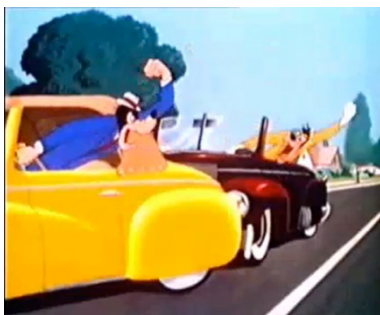
Fig. 3. Conflitos entre Wheelers

periféricas em direção ao centro da cidade, cruzando e se embrenhando junto com outros tantos monstros que correm com ele. Atropelará um pedestre (um walker , como ele era até pouco antes), se chocará com um carro à saída da viela de casa [fig. 3], e depois partirá em direção à grande via de quatro pistas que se revela ser – como assinala a tomada do alto – uma espécie de videogame ante litteram . O fato é que Wheeler, como declara a si mesmo, satisfeito, acredita ser “o dono da rua”, imagina assim que todas as vias – avenue, street, drive, boulevard, place, way, turnpike, detour , o caminho que sejam – portem o seu nome próprio porque, precisamente, no fundo lhe pertencem [fig. 4]. Para conseguir o que quer, entre os carros enlouquecidos e enfurecidos, faz uma voz grossa, se impõe pela força, range os dentes e encontra espaço entre as buzinas insuportáveis e o asfalto quente. Expressões como “abram caminho”, “saiam da frente”, “eu quero passar”, “calem a boca” constituem o discurso regular do average man no volante.