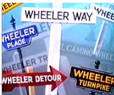
Fig. 4. Todas as estradas são de Wheeler

Ao ponto que, para desprezar os outros automobilistas, não é regra que a velocidade seja o melhor instrumento: desacelerar pode ser igualmente irritante, tática agógica sutil que ocupa o lugar da ânsia pela intensidade a todo custo. E essa é outra rima figurativa importante: enquanto o carro segue vagarosamente ao centro do boulevard da cidade, impedindo a ultrapassagem dos outros, a capota se abre, e com ela o chapéu de Wheeler, como predispondo ambos ao eufórico “ar fresco” identificado pelo narrador. Assim, não é apenas o corpo do humano que deseja um pouco da brisa irascível que causa tanto nervosismo aos carros engarrafados e barulhentos, e aproveitar a música do rádio do carro, mas o híbrido em sua completude, ou melhor, a matéria que o constitui. Há uma espécie de curiosa intercorporeidade acolhida em um único invólucro, ao mesmo tempo humano e não humano: uma espécie de sensorium commune que não é o sinestésico, do corpo antes de ser dividido em modalidades sensoriais, mas outro, que precisamente, equipara os dois seres que o senso comum tende a manter separados por princípio: o guia de um lado, o guiado de outro.