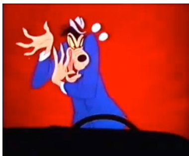
Fig. 2. Mr. Wheeler

Espaços, corpos e tecnologias, em suma, desde o início se constituem e se reconstituem em sua relação recíproca: se a casa é o espaço próprio de Walker, e a garagem o espaço próprio do carro, o percurso de um a outro implica uma colocação em continuidade dos dois espaços e, com isso, a constituição, por tradução, de um novo sujeito, dado pela conjugação do corpo ao veículo, que será, precisamente, Wheeler [fig. 2].