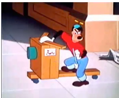
Fig.10. O menino no patinete marca seu veículo com outro Walker atropelado na calçada (ao fundo o jornal, já abandonado)

Mas mais uma vez as coisas são mais complicadas do que parecem: os atores em jogo – na cidade – são sempre novos e continuamente imprevisíveis. Entra em cena um híbrido particular, de fato, metade menino e metade patinete, que se atira não pelas ruas urbanas, mas pelas calçadas, arremessando o pobre Walker de ponta cabeça com seu bem-amado jornal, além de zombar com prazer [fig. 10].