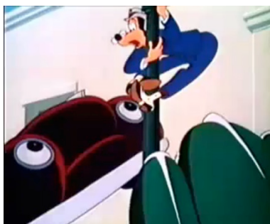
Fig.8. Walker perseguido por carros enfurecidos

a inversa é oculta e imediata). O espaço que é propriamente dele, apesar de si mesmo, é dessa vez o centro da cidade, por onde os carros passam seguindo suas vidas, enquanto os cidadãos normais passeiam tranquilos em compras ou simples caminhadas. Pelo menos a princípio. Na realidade, a guerra entre pé-móveis e automóveis sempre continua. Basta que se proponha o problema de atravessar uma rua. É impossível ou – o que seria o mesmo – uma tentativa extremamente arriscada para qualquer transeunte: os carros o recusam, devolvendo-o imediatamente às calçadas, quase demarcando o território com limites espaciais muito fortes – de um lado os pedestres, de outro os carros – que uma vez cruzados, a própria integridade física é seriamente posta em risco. E quando Walker, concentrando-se, se carrega modalmente com o dito muito fácil “querer é poder”, e tenta atravessar mais uma vez, a reação é implacável: o logotipo do carro da vez, uma estrela, situado na ponta do capô frontal, se torna subitamente a mira de um fuzil, e assim é utilizado para melhor atingir o sujeito iludido. Os carros se tornam por fim animais ferozes que, com o capô dessa vez transformado em uma grande boca dentada, tentam agarrar o pobre Walker [fig. 8].