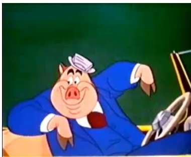
Fig. 5. Wheeler suíno

Carro => carro com rádio => buzina que grunhe dimensão do não humano Wheeler => Wheeler que ouve o rádio => suíno dimensão do humano