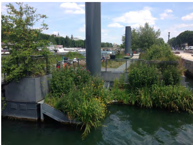
Les Berges de la Seine. (fig.14-15)

La cifra distintiva dell'operazione è la creatività (figg. 14-17): assi da carpenteria sono diventate sedute; zattere galleggianti ospitano giardini a tema, frutteti, orti urbani; corde hanno fatto i loro giri e i loro nodi per prendere la forma di amache; travi di legno si sono montate tra loro per diventare attrezzi ginnici; pennellate di vernice per terra e sui muri hanno dato vita a giochi di società, piste di corsa, segnaletica di orientamento; sui muri di controscarpa delle rive trovano posto lastre di ardesia per i writers e pareti da arrampicata per il cityclimb ; containers si sono trasformati in vetrine per esporre oggetti e vestiti in vendita, ripari per dormire, sale per meeting e conferenze, location per party e – ça va sans dire – spazi a disposizione per il pic-nic!