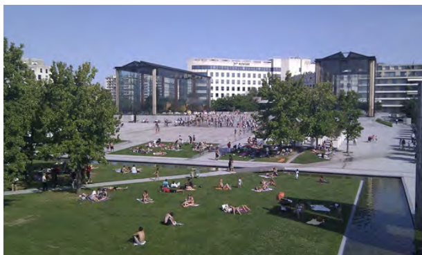
Parc André Citroën. (fig.4)