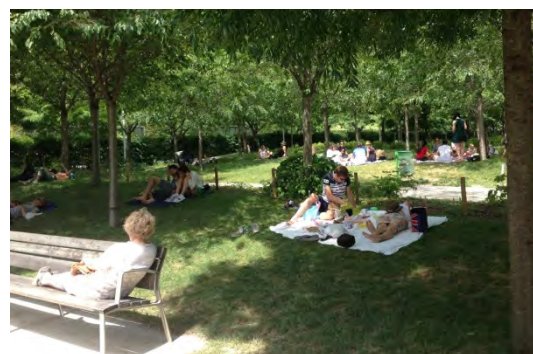
Parc Martin Luther King. (fig.6)