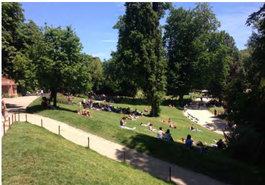
Parc des Buttes Chaumont. (fig.3)