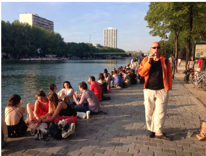
Canale Saint-Martin. (fig.9-10)

Il pic-nic non si consuma esclusivamente in occasione del pranzo delle domeniche soleggiate: ogni raggio di sole che fende le nuvole della capitale viene celebrato con rapide e fugaci tovaglie e vettovaglie; ma è soprattutto la sera, quando i Parigini (di nascita, d'adozione o solo di passaggio) trattengono con i loro occhi il lento tramontare del sole, che file ininterrotte di appassionati del pic-nic si assiepano lungo le sponde della Senna o del Canale Saint-Martin (figg. 9, 10).