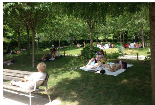
Parc Martin Luther King. (fig.6)