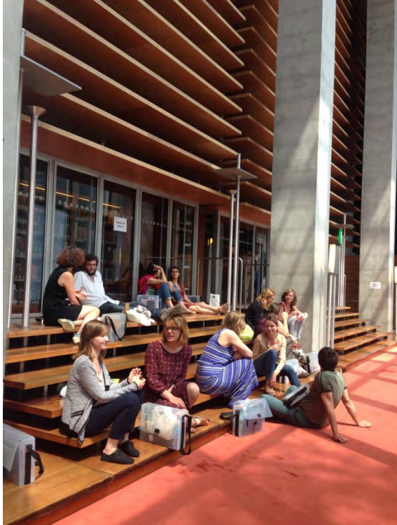
National Library of France François Mitterrand. (fig.11-12)