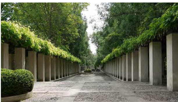
Parc Bercy. (fig.5)