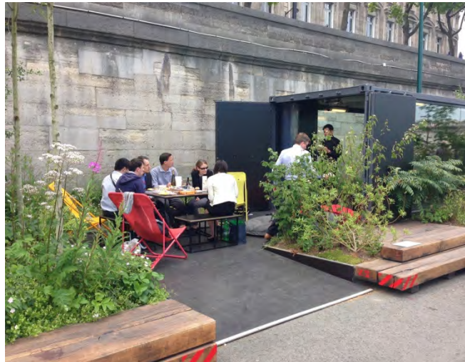
Les Berges de la Seine. (fig.16-17)