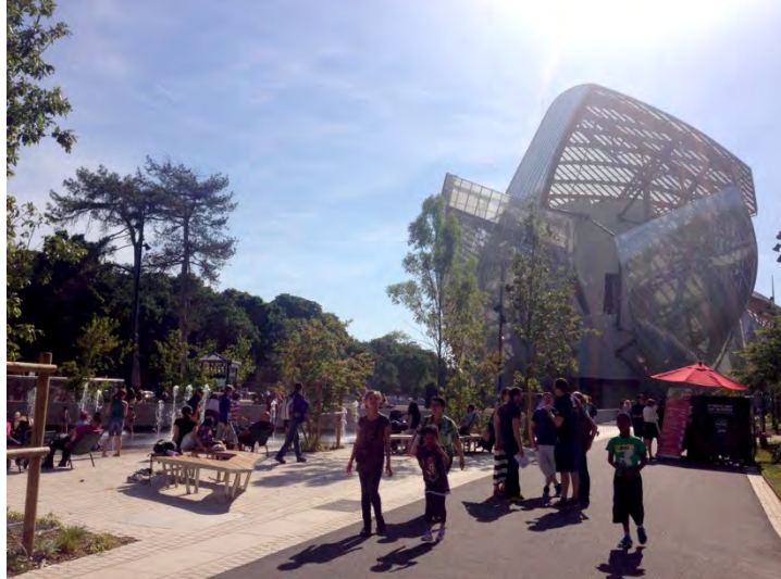
Fondazione Louis Vuitton. (fig.8)

Il pic-nic non si consuma esclusivamente in occasione del pranzo delle domeniche soleggiate: ogni raggio di sole che fende le nuvole della capitale viene celebrato con rapide e fugaci tovaglie e vettovaglie; ma è soprattutto la sera, quando i Parigini (di nascita, d'adozione o solo di passaggio) trattengono con i loro occhi il lento tramontare del sole, che file ininterrotte di appassionati del pic-nic si assiepano lungo le sponde della Senna o del Canale Saint-Martin (figg. 9, 10).