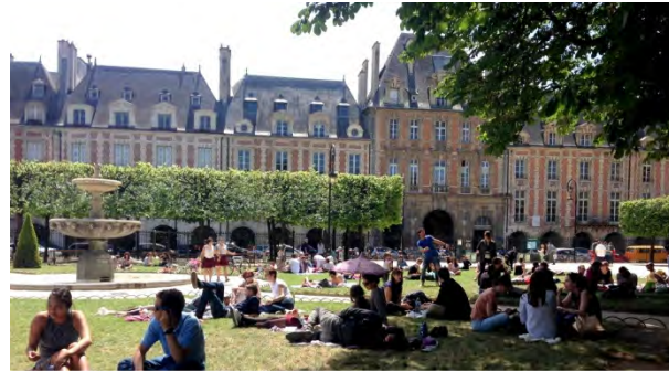
Place des Vosges. (fig.2)