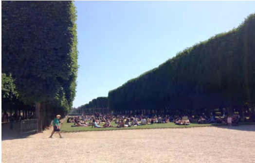
Jardin du Luxembourg. (fig.1)