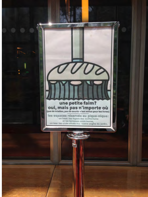
Biblioteca Nazionale di Francia François Mitterand. (fig.11-12)

Tra i luoghi più amati sono senz'altro le rive della Senna al centro della città, dove prospettano gli edifici storici più rappresentativi (Notre-Dame, Tour Eiffel, Louvre, Hôtel-de-Ville, etc.) (fig. 13).