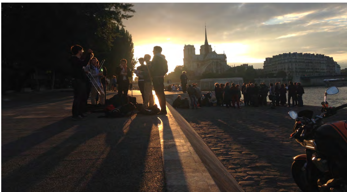
Apses of Notre Dame views from Seine. (fig.13)

The most favorite places are with no doubt the quays of river Seine in the heart of City Center, where the most representative historical buildings stand (Notre-Dame, the Eiffel Tower, the Louvre museum, the Hôtel-de-Ville, etc.)(fig 13).