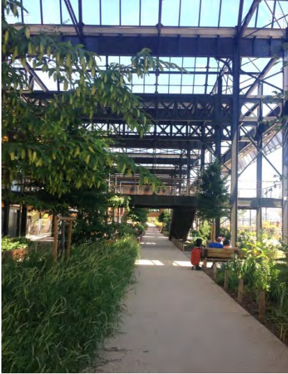
Jardin Rosa Luxemburg. (fig.7)