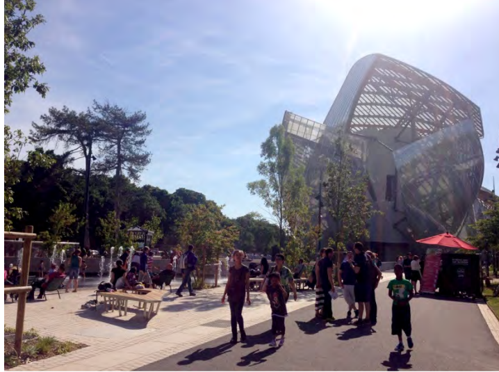
Louis Vuitton Foundation. (fig.8)

Picnic is not organized exclusively for sunny Sunday lunches: every single sunbeam that filters through the clouds overcasting the City is celebrated by fleeting tablecloths and nibbles. But action takes place above all in the evenings, when never-ending lines of picnickers crouch down on the quays of Saint-Martin Canal or the river Seine. Right there, every Parisian (native, of adoption or just passersby), loses sense of time while catching with his eyes the sun slowly setting down (fig 9, 10).