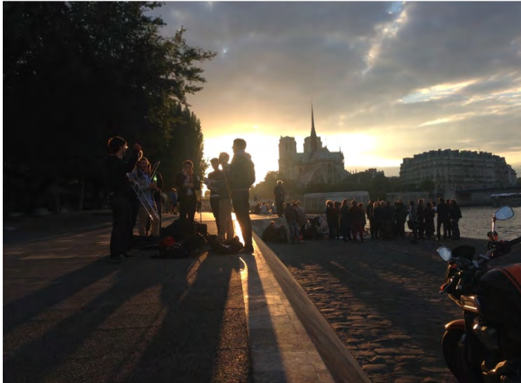
Apses of Notre Dame views from Seine.

A n old tradition renews the relationship existing between Paris and her inhabitants: the social and public use of lawns, gardens, stairways and riverfronts to hold, with extreme nonchalance , the ceremony of picnicking.