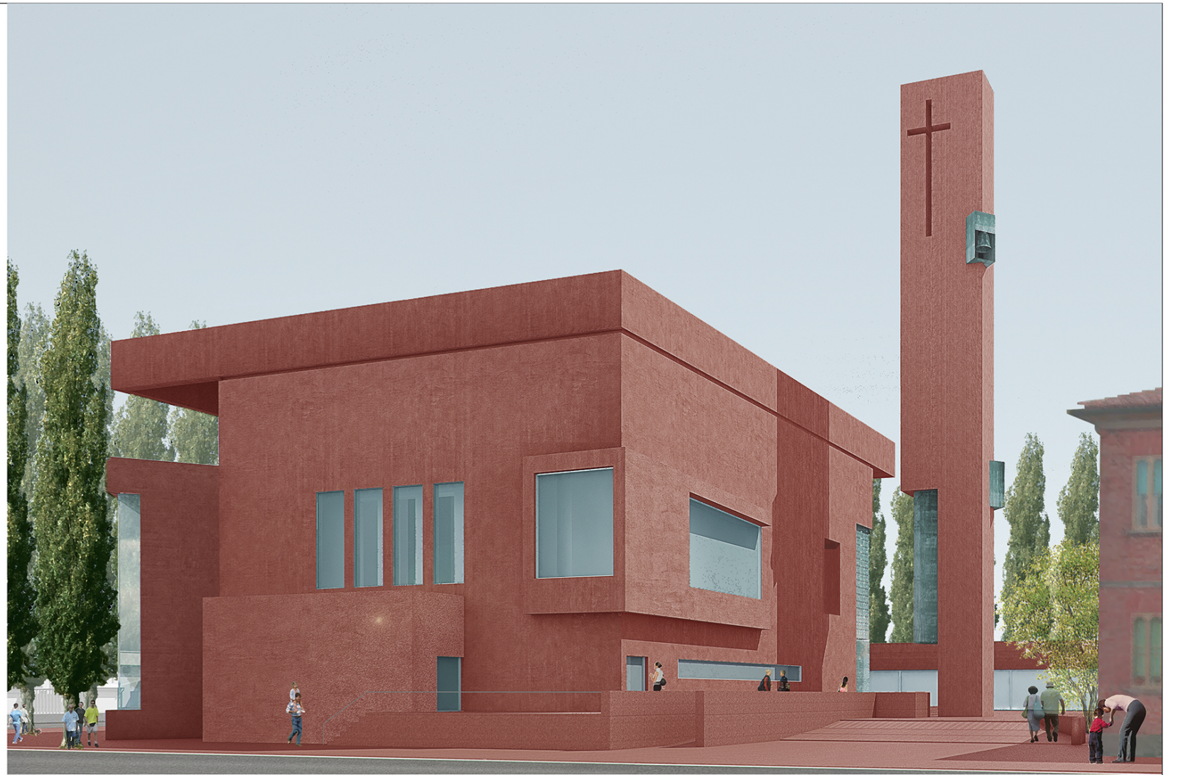
Vista dalla via Arginone