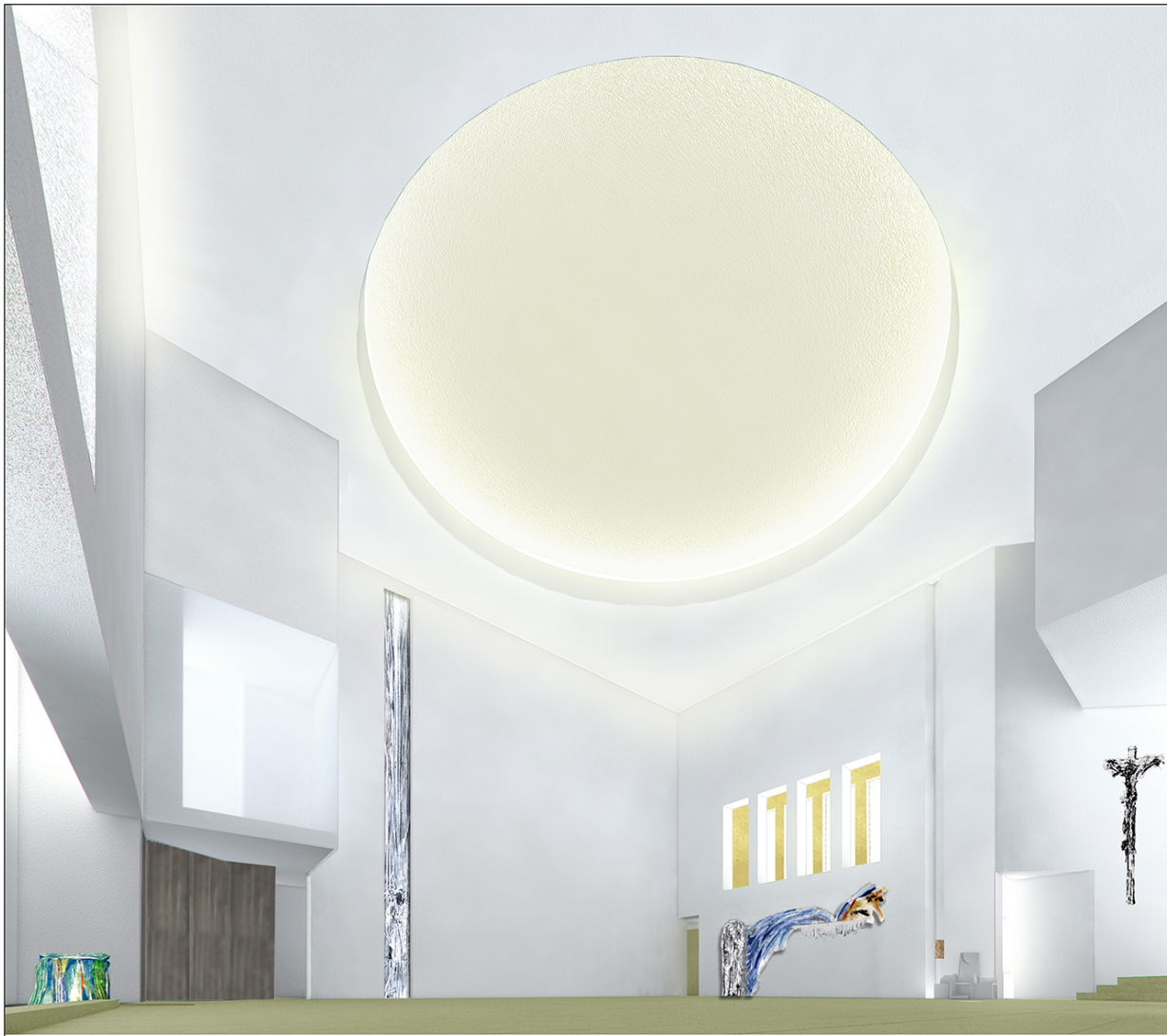
L'interno della chiesa