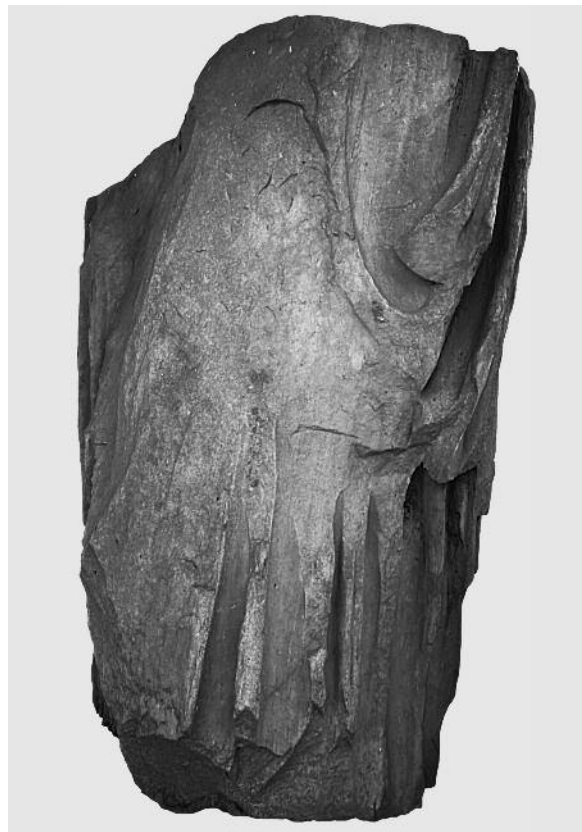
Fig. 18. Frammento della peplophoros colossale dal SE Temple. Atene, agora