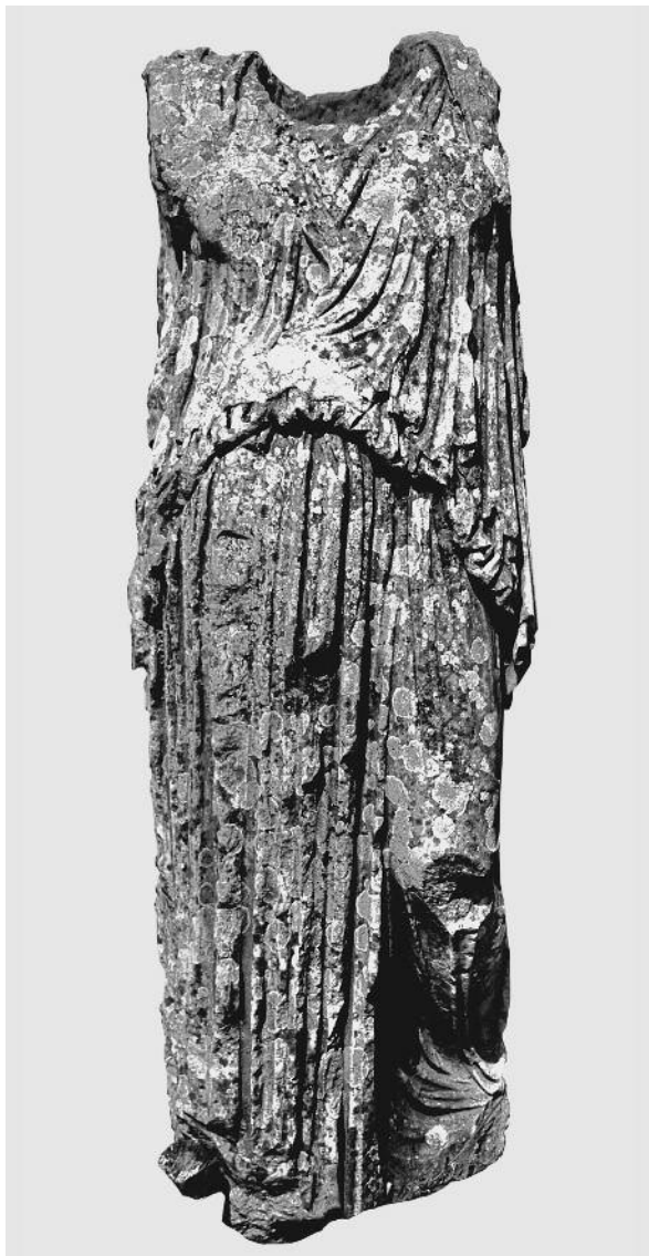
Fig. 10. Statua acefala del tipo “Demetra Capitolina”. Cirene, santuario di Apollo

del nostro, in sintonia con l’idealizzazione del volto, rispetto ad un esempio coevo di Typenklitterung dei tipi “Fayum” e con Mittelscheitelfrisur restituito da un contesto romano-urbano centrale: la testa di Colonia 20 (Fig. 15), rinvenuta sul Palatino insieme ad un ritratto di Augusto e forse uno di Tiberio, per cui l’ infula , la velatio capitis e la corona vegetale enfatizzano le connotazioni religiose, in riferimento a Cerere, dell’effigiata, divenuta, dopo l’adozione nella gens Julia e la morte di Augusto, Julia Augusta, sacerdos divi Augusti e madre del nuovo imperatore 21 .