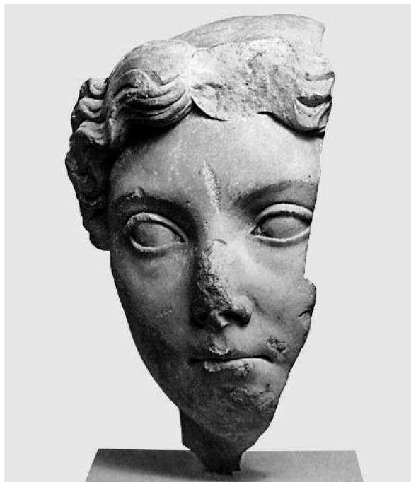
Fig. 12. Ritratto di Livia tipo "Salus". New York, Metropolitan Museum (Bartman 1999, fig. 148)