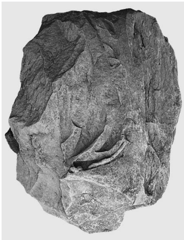
Fig. 16. Frammento della peplophoros colossale dal SE Temple. Atene, agora