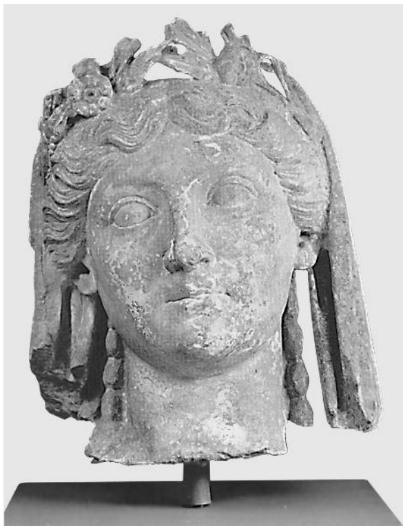
Fig. 15. Ritratto di Livia, Typenklitterung dei tipi “Fayum” e “Mittelscheitelfrisur”. Colonia, Römisch-Germanisches Museum (Bartman 1999, fig. 83)

dicata a Leptis, nel ciclo giulio – claudio risalente al 45/46 (o per taluni al 53) d.C., presenta l’Augusta, ormai ufficialmente diva , ornata di vitta e diadema, nella maestosa posa in trono appropriata ad una divinità matronale, Giunone o Cerere 24 . In tal guisa maiestatica doveva apparire già nel gruppo tiberiano del tempio di Roma e Augusto l’acrolito (quasi in scala 3:1) dell’imperatrice, all’epoca vivente (ca. 23 d.C.), qui ancora con una Nodusfrisur del tipo “Copenhagen 615” 25 .