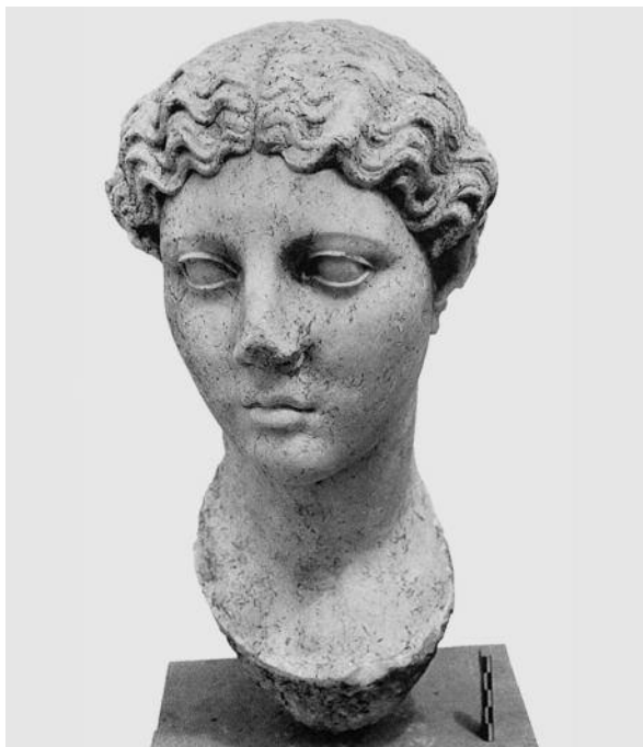
Fig. 11. Ritratto femminile. Atene, Museo dell'agora (Harrison 1953, tav. 9)