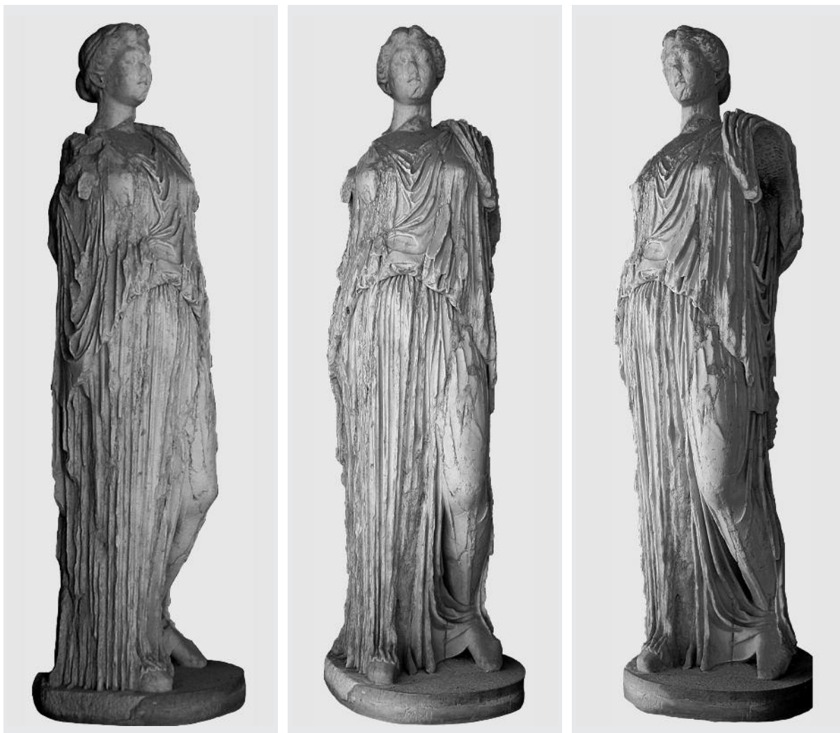
Figg. 1-3. Statua iconica nel tipo “Demetra Capitolina”, veduta tre quarto da destra, veduta frontale, veduta tre quarto da sinistra. Lebda, Museo Archeologico di Leptis Magna

peraltro di un archetipo stilisticamente vicino, è dato dalle più antiche repliche delle Cariatidi dell’Eretteo, dai frammenti AF1-AF2 Schmidt dal Foro di Augusto all’esemplare di Firenze della primissima età imperiale 6 ; tra le copie finora note della stessa “Demetra Capitolina”, solo il torso coevo del Magazzino Vaticano (Figg. 8-9), dall’area del Teatro di Pompeo, consente un discreto accostamento, mentre gli esemplari dei Musei Capitolini, Cirene (Fig. 10) e Museo del Prado appartengono ad un orizzonte nettamente più tardo, antonino (e forse già protoseveriano per l’ultimo di essi), presentando un trattamento semplificato e più uniforme dell’abito 7 . Nella figura leptitana la resa dell’orlo della veste minutamente smerlato sul piede del lato portante (Fig. 6), insieme al dettaglio delle calzature, denuncia l’affinità con alcune figure ico-