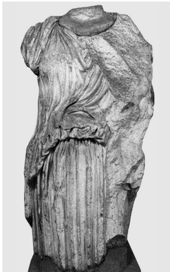
Figg. 8-9. Torso del tipo “Demetra Capitolina”, profilo destro e vedura frontale. Roma, Musei Vaticani, Magazzino (Baumer 1997, tav. 15,3-4)

yumtypus”, dipendente da un modello della media epoca augustea replicato ancora in età tiberiana 16 . La treccia o fascia che corre attorno alla testa subito dietro le bande anteriori dei capelli (Fig. 4) risale, a sua volta, ad un’ulteriore redazione della Nodusfrisur , lo “Zopftypus”/ tipo “Copenhagen 616”, pure augusteo, diffuso in territorio greco-asiatico e, nell’interpretazione di R. Winkes, suggestivo di un’assimilazione ad Hera: tra le repliche superstiti, sembra illuminante il confronto con l’esemplare dal teatro di Butrinto (Figg. 13-14), che fornisce una versione appena più antica dello stile “attico” del nostro ritratto 17 .