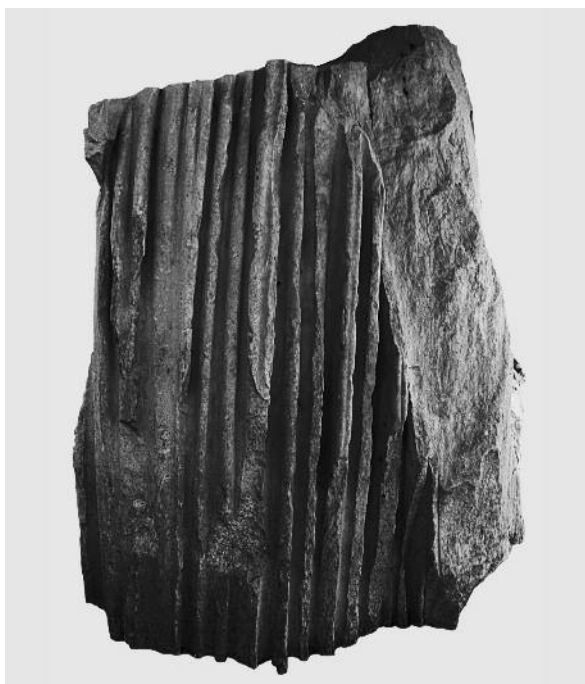
Fig. 17. Frammento della peplophoros colossale dal SE Temple. Atene, agora

σι superiore al vero, ma non colossale. Per la nostra, le lacune della documentazione archeologica e le sensibili oscillazioni nella valutazione dei pochi elementi