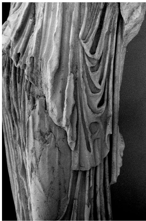
Figg. 6-7. La statua della Fig. 1-3, dettagli

con Nodusfrisur certo più dissonante rispetto all’acconciatura semplice ed elegante del ritratto ateniese e a quella della testa leptitana.