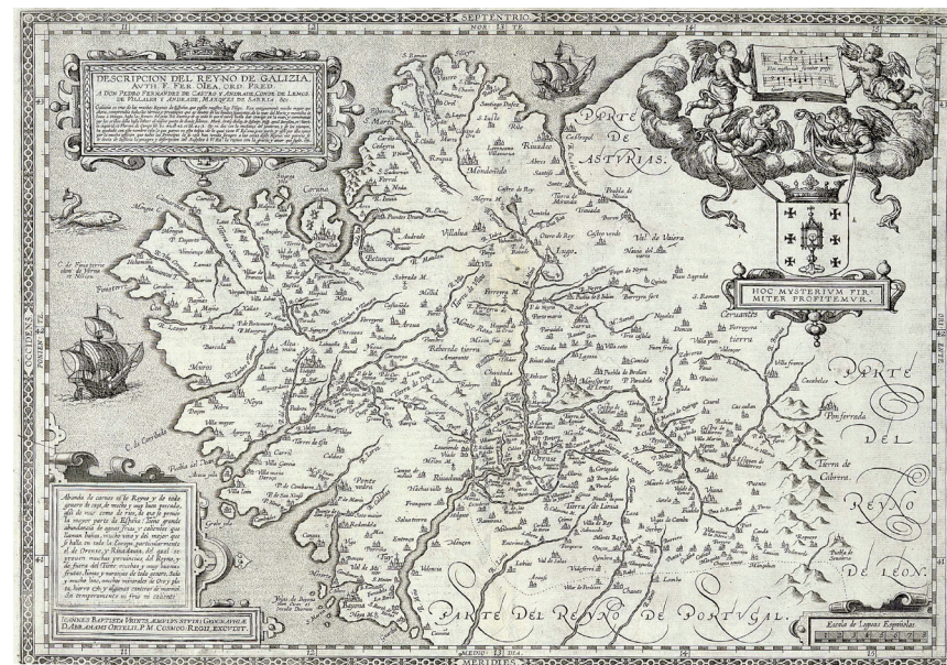
Mappa Galizia (1603) Bne, MR/33-41/289