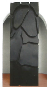
Capolavori in Valtiberina tra Toscana e Umbria.