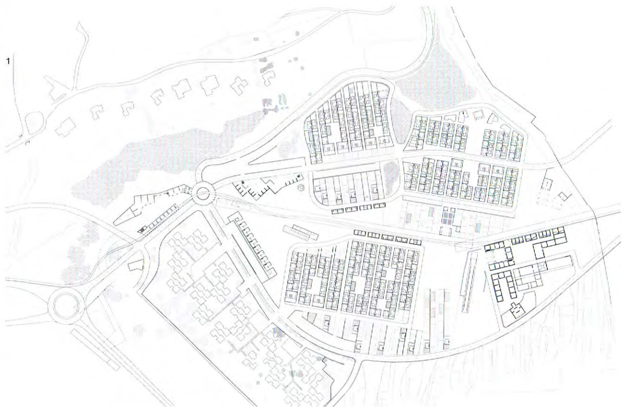
1 Masterplan dell'area "Densità alta".

*Professore Ordinario in Progettazione Architettonica