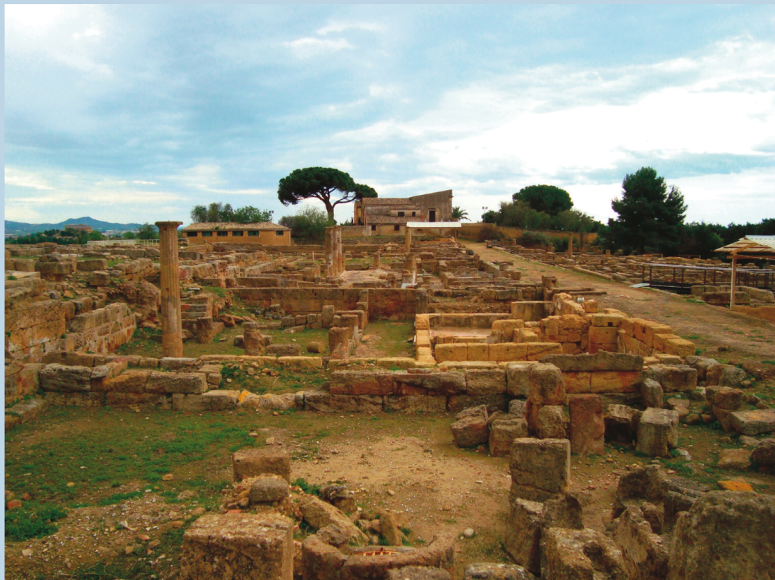
2. Il Quartiere ellenistico-romano all'interno del Parco Archeologico e Paesaggistico della Valle dei Templi di Agrigento.