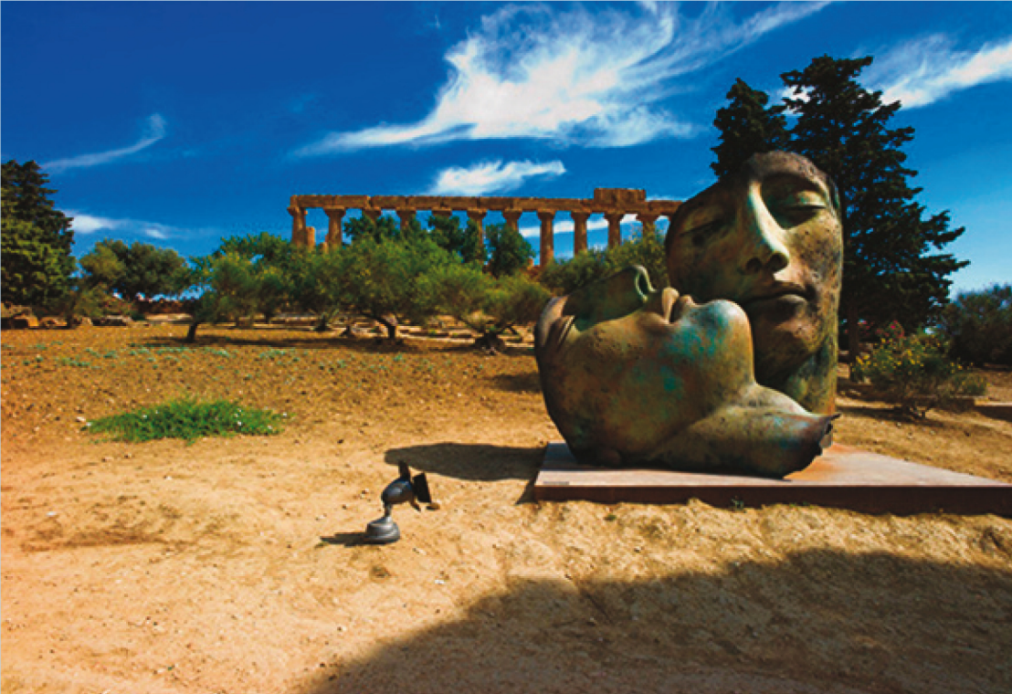
4. L'esposizione en plain air delle sculture di Igor Mitoraj all'interno della Valle dei Templi di Agrigento (2012).

potrebbe diventare un luogo di riferimento per organizzare attività didattiche per le scolaresche, facendo conoscere il sito alle nuove generazioni. È necessario quindi realizzare un percorso museografico che valorizzi il Quartiere e lo renda più interessante agli occhi dei turisti e coinvolga i cittadini. A supporto di una migliore fruizione del sito risulta necessario realizzare un sistema di arredo urbano e un impianto d'illuminazione per renderlo accessibile anche durante le ore notturne, inoltre occorre progettare un accesso, una struttura di accoglienza, dei servizi igienici e un'area di sosta e ristoro adeguati alle esigenze dei visitatori. Riprendendo il secondo itinerario proposto dal Piano del Parco, che collega il Quartiere alla Collina dei Templi, si potrebbe ipotizzare l'utilizzo della mobilità dolce, attivando un servizio di bike sharing , per permettere ai visitatori di raggiungere le diverse zone della Valle attraversando il paesaggio naturale. È necessario che l'intera area del Parco venga chiusa al traffico, attivando un servizio di bus navetta lungo il perimetro esterno dell'area, in modo da rendere più accessibile un sito che ad oggi è difficile da raggiungere per chi non ha una vettura. L'obiettivo è la progressiva valorizzazione dei tracciati urbani e dei manufatti archeologici e la loro integrazione con l'offerta di nuove infrastrutture museali e servizi per i visitatori.