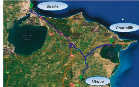
La région d'Utique