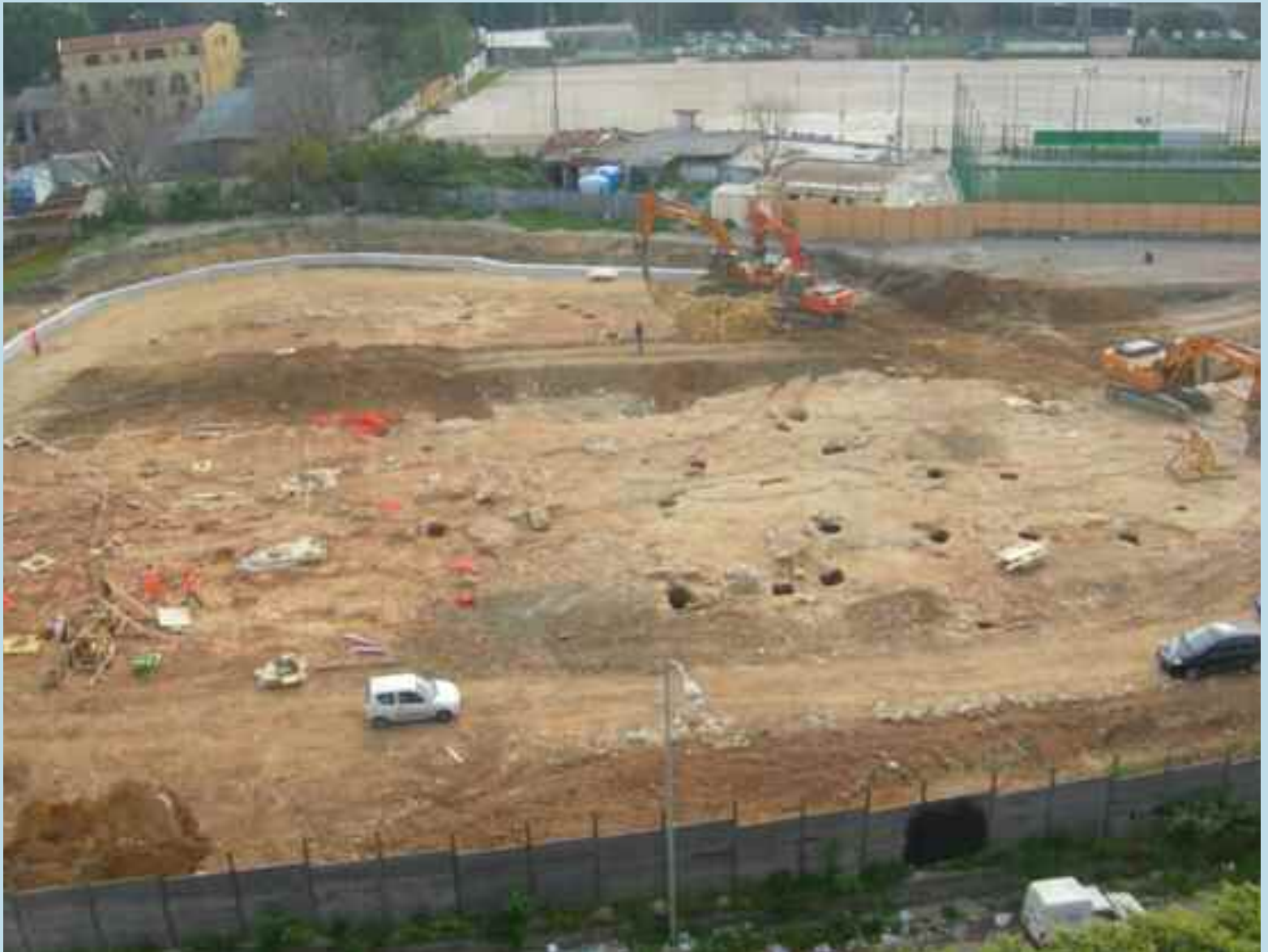
1. Palerme. Fouilles archéologiques préventives (fosses à déchets médiévales) pour la construction de la station Palazzo di Giustizia-Imera du réseau urbain inter-gares. 1. Palermo. Intervento di scavo archeologico preventivo (butti medievali) per la costruzione della stazione Palazzo di Giustizia-Imera del passante ferroviario.