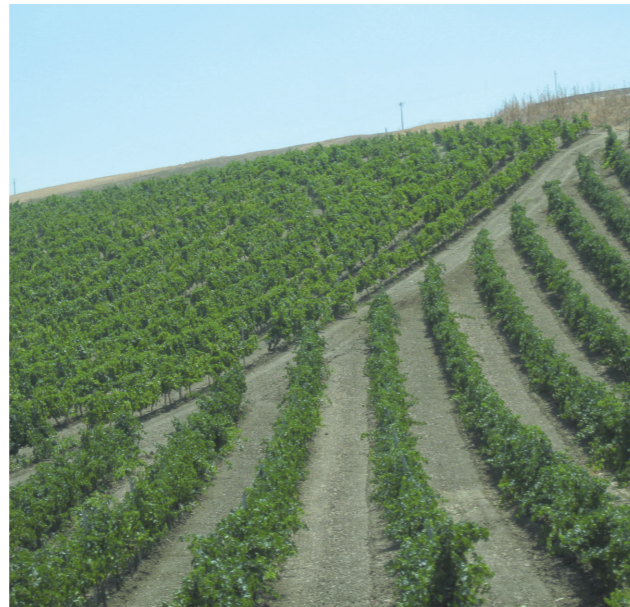
07 agosto 2013. Vigneto con alta sostenibilità ambientale su suolo gradonato ed accanto vigneto non sostenibile, sotto l'aspetto ambientale, con filari a rittochino.