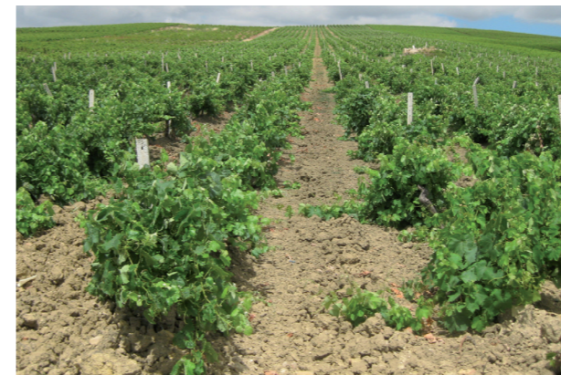
Impianto di un vigneto non sostenibile