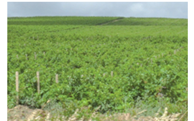
Impianto di un vigneto sostenibile