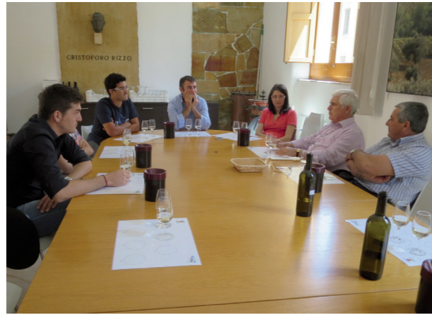
Degustazione del vino sperimentale Grillo presso la cantina Dalmasso a Marsala (TP).