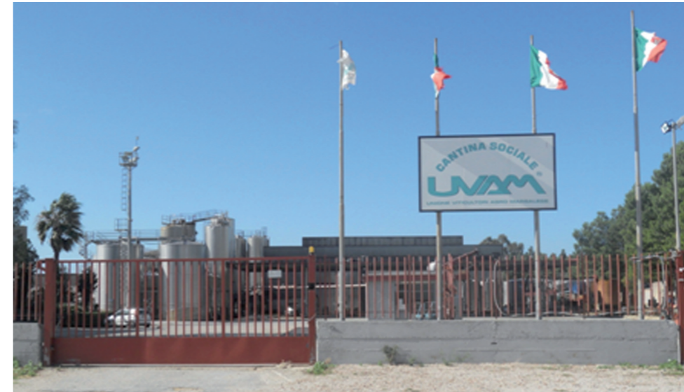
La Cantina UVAM