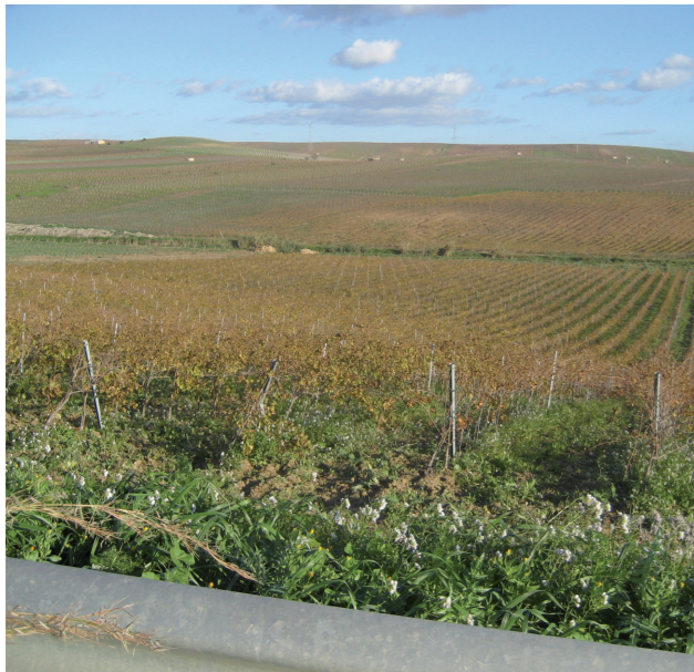
Le colline del sottobacino Iudeo-Bucari con versanti in dolce pendio costituiscono le aree migliori per la viticoltura.