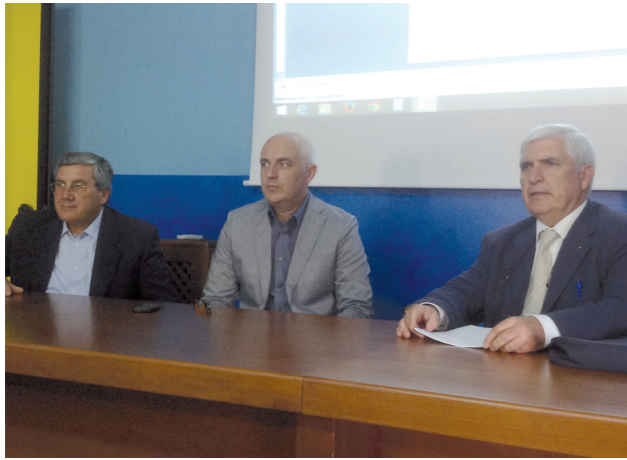
Seminario sulla sperimentazione del Grillo in tre vigneti sperimentali (Marsala, 13 giugno 2014).