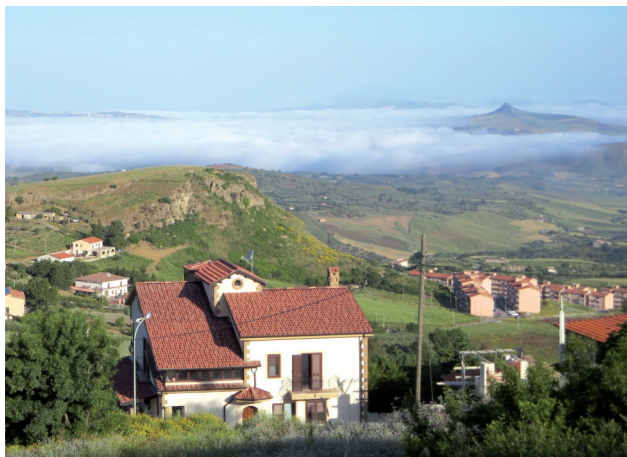
Durante il periodo primaverile nelle vallate interne siciliane si creano le condizioni di temperatura e umidità ottimali per gli attacchi dei patogeni fungini.