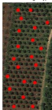
Distribuzione delle piante campionate