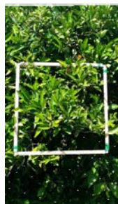
Campionamento dei germogli