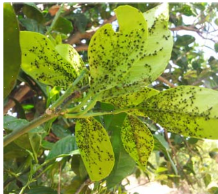
Colonie di A. gossypii su germogli

Le osservazioni hanno mostrato che, in entrambi gli anni, l'infestazione di A. gossypii è iniziata alla fine di aprile, ha raggiunto i massimi livelli tra metà maggio e inizio giugno, scomparendo verso la metà del mese di giugno. Per riprendere nel periodo autunnale. Nel 2013 l'infestazione è ripresa nella seconda decade di luglio in concomitanza alla emissione di nuovi getti vegetativi conseguenti ad una irrigazione, con valori paragonabili a quelli primaverili. Le differenze delle percentuali di infestazione rilevate ai quattro punti cardinali non sono statisticamente significative.