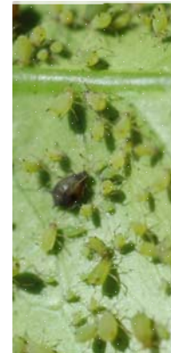
Particolare della precedente