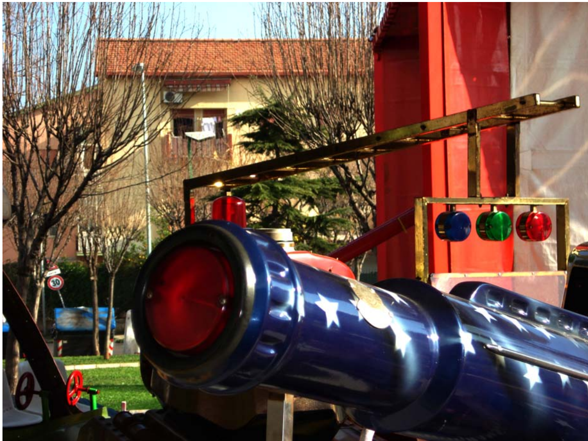
Figura 1 - Santa Rosalia, un quartiere di edilizia residenziale pubblica a Palermo