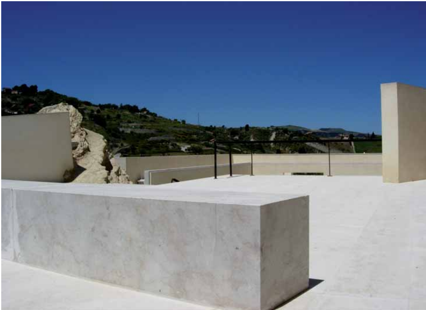
Fig. 10 G. F. Tuzzolino, A. Margagliotta, Riqualificazione del centro storico , Cammarata, 2003-06.

La pluralità delle voci e la costituzione multiforme del paesaggio urbano indicano chiaramente che non si può ricondurre la moltitudine dei suoi problemi ad un generico "problema della città". Si deve, viceversa, entrare nel merito della diversità dei valori este-