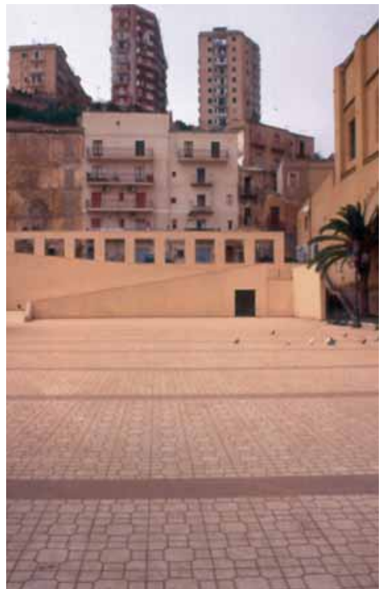
Fig. 4 G. F. Tuzzolino, A. Margagliotta, Piazza Kennedy , Porto Empedocle, 1997-98.