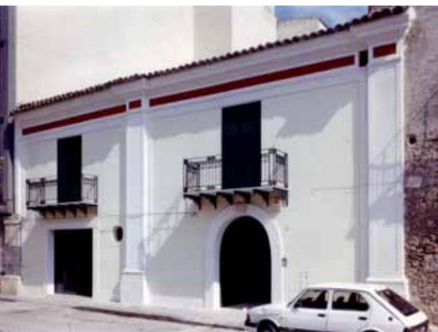
Fig. 5 G. F. Tuzzolino, A. Margagliotta, Casa Sammartino , Ravanusa, 1996-97.