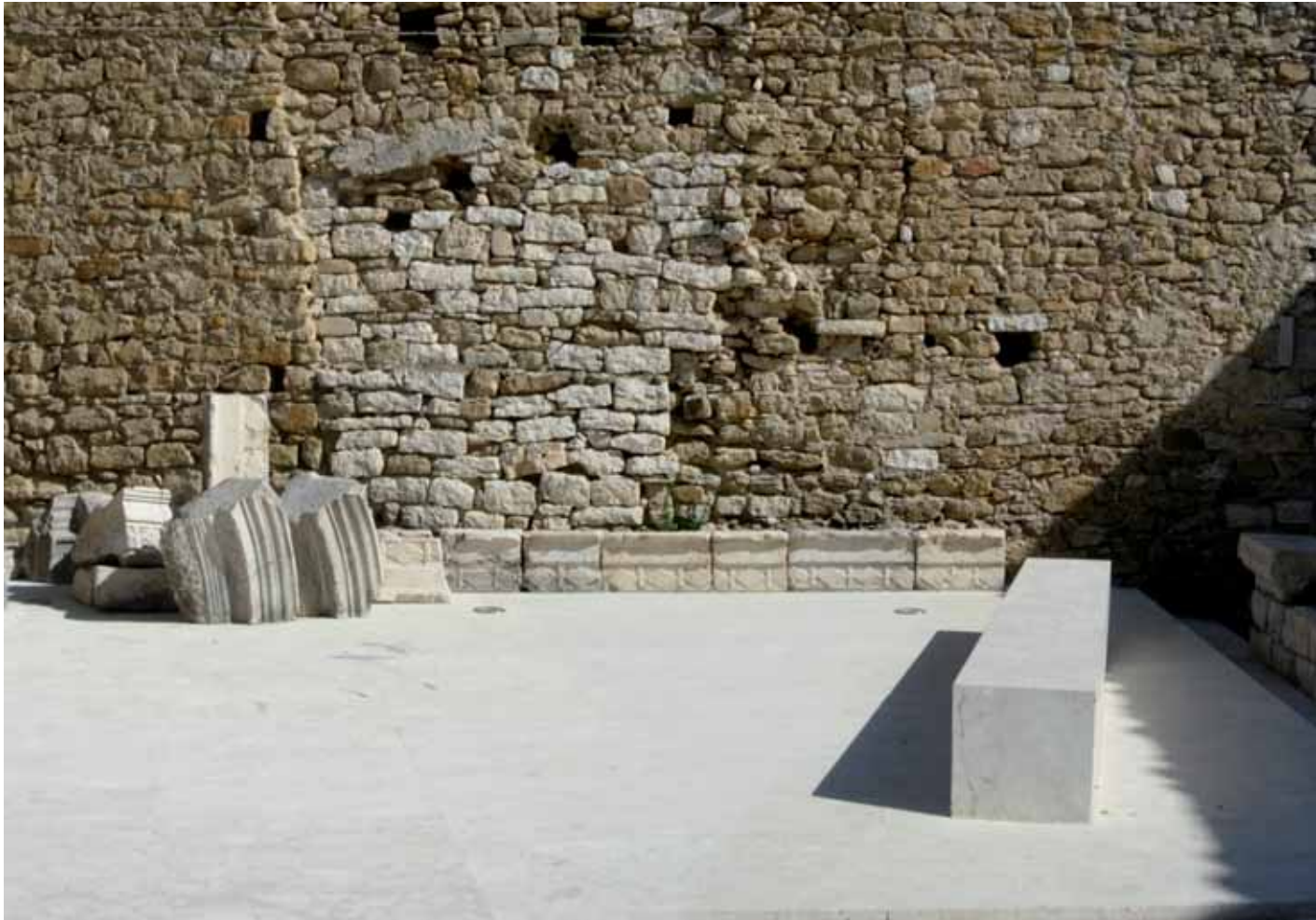
Fig. 11 G. F. Tuzzolino, A. Margagliotta, Riqualificazione del centro storico , Cammarata, 2003-06.

getto da un'eccessiva ansia funzionale e tentando un pacifico ricongiungimento della storia con il tempo attuale. È questo, a mio parere, il contributo di modernità che il progetto di architettura può e deve offrire all'ambiente costruito, nel delicato equilibrio imposto alla configurazione sfuggente del mondo. Da qui può e deve ripartire un ripensamento radicale del paesaggio urbano, confidando dell'apporto imprescindibile del progetto nella scoperta di un'immagine fondata sulle ragioni e i sui significati profondi delle tracce e dei linguaggi.