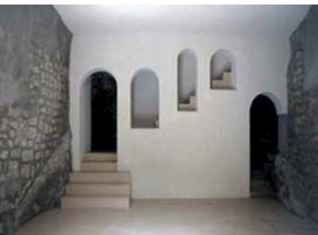
Fig. 6 G. F. Tuzzolino, A. Margagliotta, Casa Vecchio , Cammarata, 2003-04.