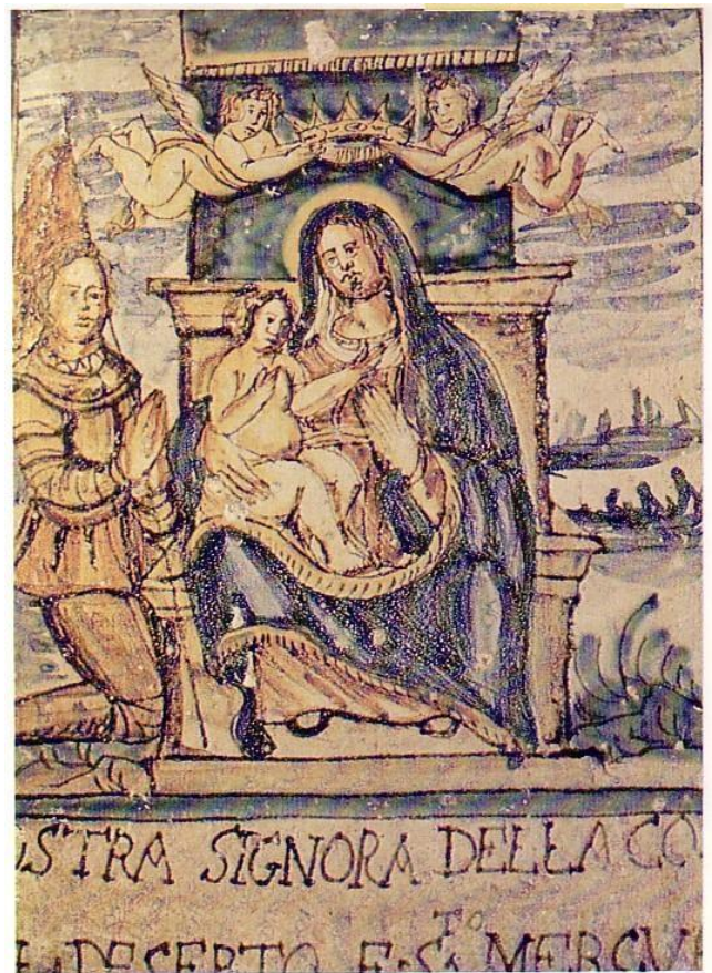
IMMAGINE N. 3