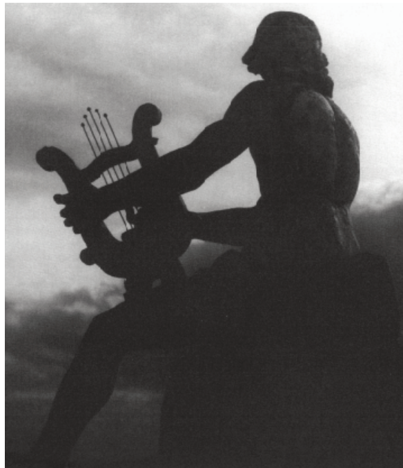
Fig. 1. Apollo, cornice d'attico di Villa Valguarnera, fronte sud (Bagheria).

cento. Lo stile calmo, chiaro e oggettivo di architetti come G.V. Marvuglia irrompeva con forza nei palazzi urbani e nelle ville fuori porta.