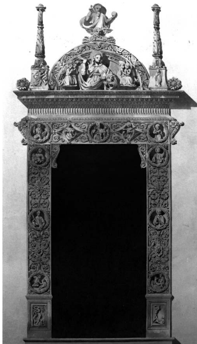
Fig. 1. E. E. Viollet-le-Duc, portale laterale della chiesa di S. Agostino a Palermo (Parigi, Centre de recherches sur les Monuments historiques, Fonds Viollet-le-Duc, 1996/083/0356/114).

e china su carta, 46 x 24,8 cm), è datato 29 aprile 1836, è firmato dall'autore e reca la scritta «Porte laterale de l'église de (...) à Palerme»; sebbene non venga indicato il nome della chiesa, l'identificazione è certa, essendo peraltro supportata dalle note riportate nel diario di viaggio.