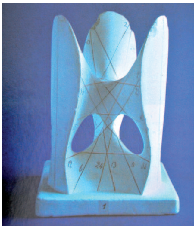
Fig. 3 - Superficie diagonale di Clebsch, modello custodito a Napoli (CARBONE et al. 1996).

ne organizzata e ulteriormente incentivata la produzione degli istituti matematici, fisici, tecnico-meccanici e geodetici esistenti presso le università e i politecnici germanici e, quindi, una ditta (una casa editrice: quella di Ludwig Brill, appositamente fondata a Darmstadt nel 1877 su stimolo di Felix Klein e Alexander Brill, poi continuata, dal 1899, ad opera di Martin Schilling nella città di Halle an der Saale, in un primo momento, e a Lipsia successivamente) viene a fungere da centro di raccolta con un catalogo unico suddiviso per serie formate quasi sempre da modelli riconducibili al medesimo tema scientifico, ideati e, spesso, costruiti presso una data sede sotto la guida di un dato professore. Catalogo che non si presentava come semplice elencazione di pezzi ma, arricchito com'era da puntuali esposizioni dell'argomento coinvolto e dai rimandi ai saggi scientifici ispiratori, rappresentava, nelle sue va-