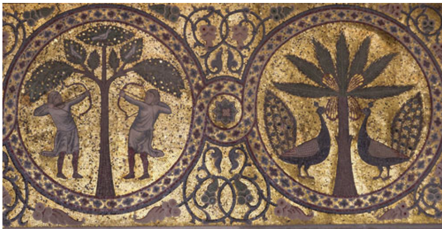
Figure 8. Mosaics in Castello della Zisa (Palermo).

A question arises: will changes in urban and natural landscape due to RPW attacks modify the perception, appreciation and total value of Sicilian arts in the future? [20-21]