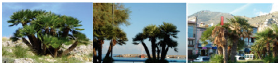
Figure 3. a) Mediterranean shrub lands with Chamaerops humilis ; b) C. humilis used as ornamental tree along sea promenade, May 2010; c) RPW infested C. humilis , October 2012. Arrow indicates infested palm.

From its first report in Sicily, the RPW rapidly attacked P. canariensis causing significant damage and amplifying the spectrum of hosts, Washingtonia spp., Sabal spp., including the endemic Mediterranean species C. humilis L. (Figures 3a-c). This poses a threat to natural plant communities, biodiversity and landscape, and especially in the case of islands and other isolated ecosystems [8].