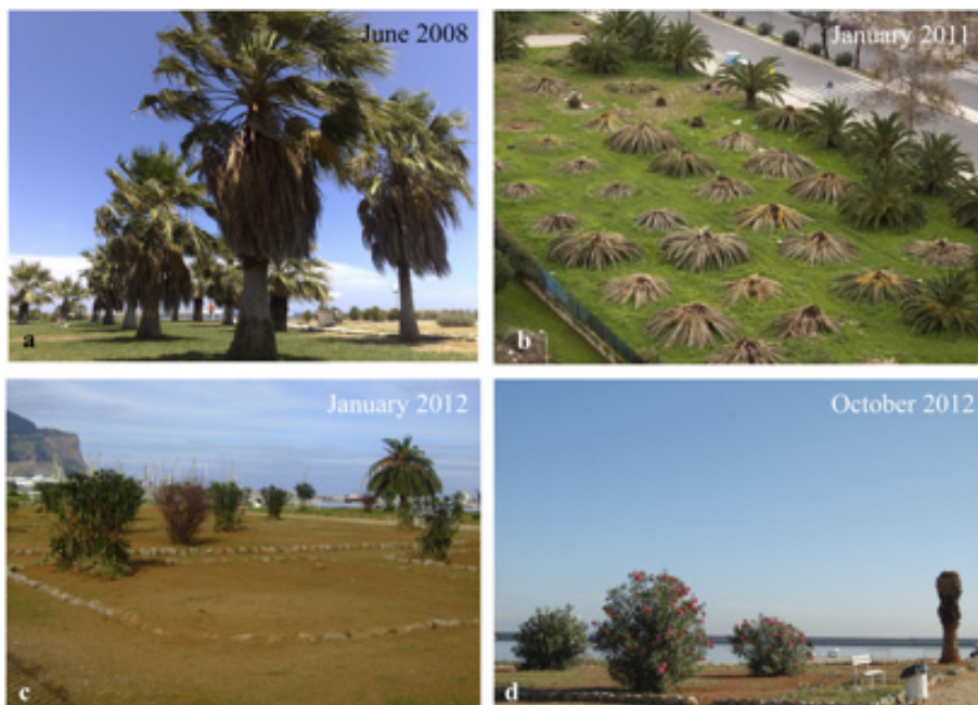
Figure 6 a-c. Palmeto, Foro Italico (Palermo, Italy): a) before; b) during RPW attack in 2011; c) RPW attack in January 2012; d) October 2012. Notice only one palm is now present and oleanders have replaced the palm trees.