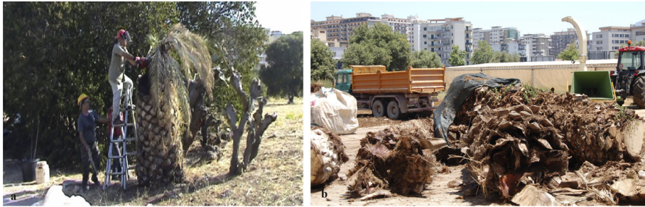
Figure 4. a) Cut down of RPW infested Phoenix canariensis , b) area dedicated to chopping infested palms into smaller pieces.

size, the species and the position of the infested palm. Private citizens must also respect this law.