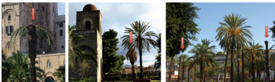
Figure 7. RPW infested palm trees in Palermo: a) in front of Royal palace (Palazzo dei Normanni) of Palermo; b) near the Church of San Giovanni degli Eremiti; c) in Piazza Politeama. Arrows indicate infested palms.

Palm trees also represent an important resource for the cultural heritage in the Mediterranean area. One of the reasons for this extensive use can be found in the strong symbolism of these plants. They have always been considered synonymous with life and fertility and are often associated with religion, mythology and tradition [18-19]. For this reason, over the centuries they have always been represented in decorative arts, mosaics (Figure 8) and frescoes, testifying to their importance since time immemorial. As is well known they are also strongly represented in most of the Norman-Byzantine monuments in Palermo, as in the Royal Palace, Monreale Cathedral and in Palazzo dei Normanni, enriching the panorama.