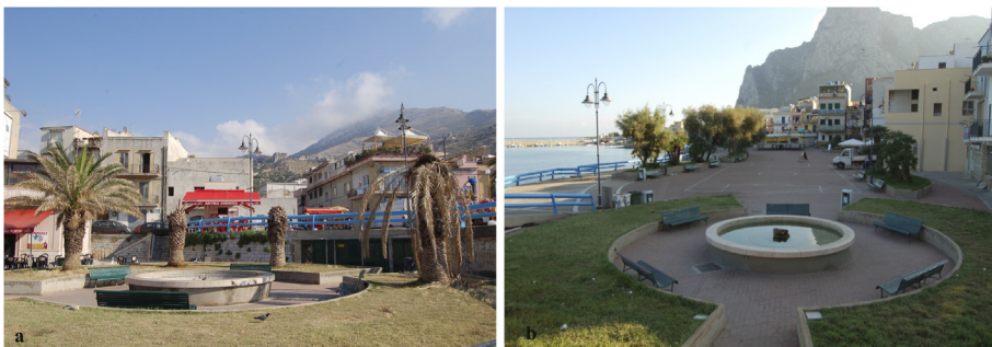
Figure 2. a) Phoenix canariensis infested by Rhynchophorus ferrugineus in Sferracavallo (Palermo) June 2009; b) October 2012, note no palm is present.

Before the accidental introduction of RPW, these Arecaceae had never been attacked by phytophages, parasites or pathogens, and for this reason were considered optimal trees in urban areas. In the Sicilian panorama, as well as in many other historical sites throughout the world, these palms are found along the main promenades, in private gardens and historical and botanical gardens. In fact, there are more than 30 different species of palm trees in the 113 Sicilian historical gardens. The majority is represented by Phoenix canariensis in more than 85% of the historical gardens, followed by Chamaerops humilis (Arecaceae) (59.3%), Washingtonia filifera , W. robusta , P. dactylifera .