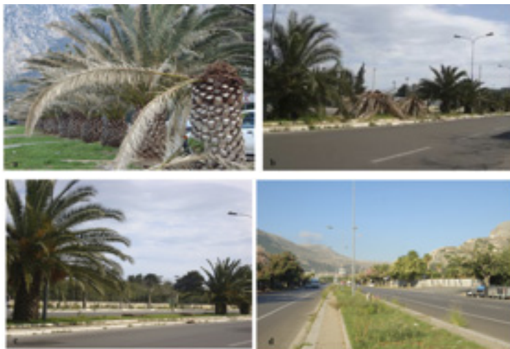
Figure 5 a-d. Palm trees of viale dell'Olimpo showing three different phases of the RPW attack. In last photo the infested palms were cut off. Different phases of the RPW attack: a) initial situation, b – c) during RPW attack; d) present situation, notice no one palm is present.

RPW attacks have led to a drastic decrease in the number of these plants, resulting in a radical change in the configuration of urban spaces which could continue to change even further. Photos regarding the same location before the presence of the RPW, during attacks and the present-day situation can give a measure of the damage (Figures 4, 6-8). Some examples shown below, give an idea of this expected tragedy. Palm trees are gradually disappearing from one of the most famous palm tree boulevards, Viale dell'Olimpo (Figures 5 a-d). Few palm trees are now present along the sea promenade, Foro Italico , where before there was a famous “ Palmeto ” (palm tree grove) there are now oleanders ( Nerium oleander L.) instead of palm trees (Figures 6 a-b). Dead palms are evident in almost every street and square of the city, even in the historical Piazza Vittoria in front of Palazzo dei Normanni (Figure 7a), close to the beautiful Church of San Giovanni degli Eremiti (Figure 7b) and in Piazza Politeama (Figure 7c).