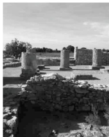
Il sito archeologico di Kerkouane.