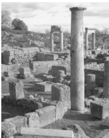
Il Quartiere ellenistico-romano nella Valle dei Templi di Agrigento.

Les résultats du projet en termes de développement sera la formation des spécialistes, des étudiants et des chercheurs siciliens et tunisiens qui participeront à une meilleure utilisation des applications de la restauration archéologique finalisés au développement du tourisme culturel durable et à la mise en valeur du patrimoine culturel et naturel, ainsi qu'à soutenir l'innovation et l'accroissement de la compétitivité, en répondant de telle façon aux exigences des deux Pays et des territoires engagées par le projet. Le résultat attendu sera mesuré par l'application des évaluations qui ont été prévues et qui seront diffusés et publiés par la suite. L'approche transfrontalière et interdisciplinaire des problématiques abordées et des résultats attendus témoignent de la volonté d'arriver à un résultat positif pour tous les Partenaires; un objectif difficile à atteindre sans la nécessaire confiance et le respect entre les Partenaires, et surtout, sans le sentiment en commun de la portée du partenariat pour la solution des problèmes identifiés au niveau du territoire.