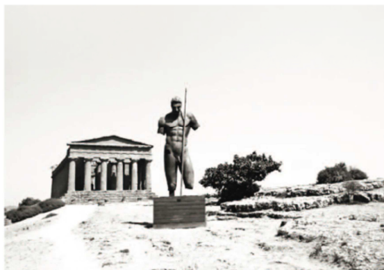
Il Tempio della Concordia nella Valle dei Templi di Agrigento.