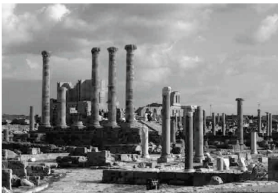
Il quartiere punico di Byrsa a Cartagine.