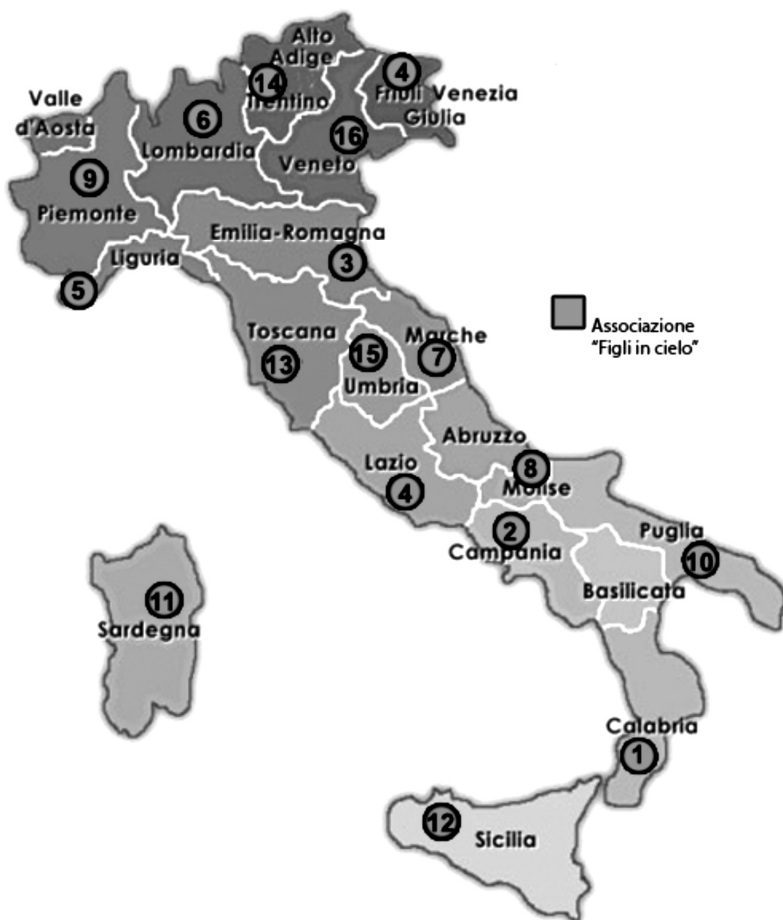
Mappatura delle sedi dell'Associazione "Figli in cielo" in Italia

storale per la famiglia nelle varie diocesi in cui è richiesta, sia in Italia che all'estero, attraverso l'incontro eucaristico del terzo venerdì di ogni mese accompagnato da una catechesi sul tema scerverato durante l'anno. Promuove, inoltre, incontri settimanali di testimonianza, di condivisione fraterna, di lectio e di meditazione profonda, visite alle famiglie e alle parrocchie, contatti epistolari e telefonici.