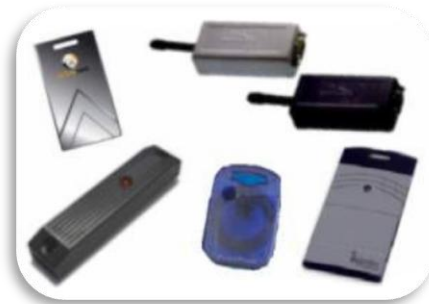
Fig.1 Tags Attivi

I tags attivi (Fig.1) sono dotati di una fonte di alimentazione completamente indipendente dal lettore, posseggono infatti una batteria, che fornisce una sufficiente alimentazione per ottenere elevate prestazioni in termini di portata radio (distanze fino a 100 Mt), velocità di trasmissione dei dati e quantità di memoria; in questi transponders i dati possono essere trasmessi senza la necessità di una interrogazione da parte del lettore.