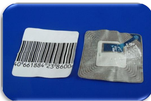
Fig.3 Codici a Barre ed RFId

Il codice a barre è attualmente la tecnologia di identificazione più diffusa, infatti quasi tutti i prodotti di consumo e durevoli hanno etichette con codice a barre. Questa tecnologia comprende, oltre alle etichette, anche tutti gli apparati utili alla loro stampa e lettura e deve la sua affermazione, in tutti i settori industriali e dei servizi, soprattutto al basso costo e alla facilità d'uso.