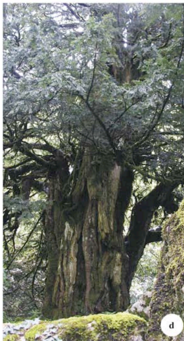
Foto 1 - a) Individuo n° 13 della popolazione naturale di Abies nebrodensis sulle pendici nord-occidentali di Monte Scalone; b) Zelkova sicula autentico “fossile vivente” gravemente minacciato di estinzione si riproduce attualmente soprattutto per via agamica; c) Individuo maturo di Fraxinus excelsior subsp. siciliensis in consorzio con agrifoglio, cerro, acero montano, tasso e leccio nel territorio di Alcara Li Fusi; d) Ragguardevole individuo di tasso all'interno della Tassita di Caronia (ME).