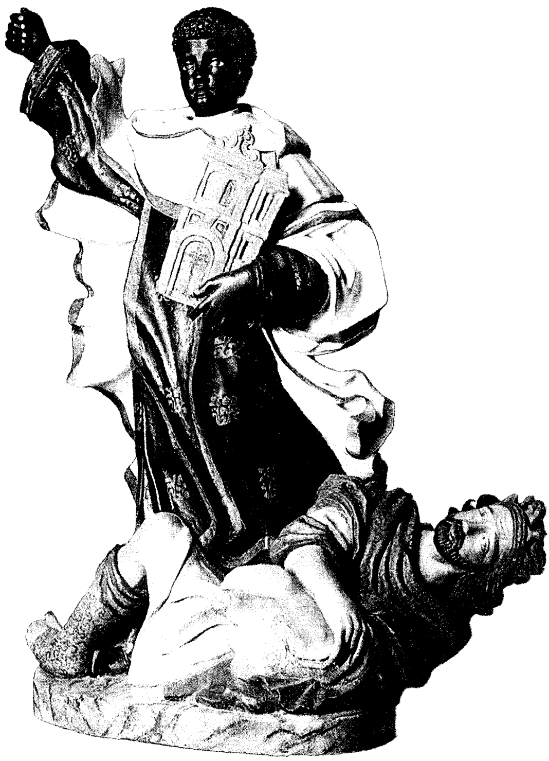
Com expressão facial jovial e bondosa, esta iconografia de Santo Elesbão com hábito carmelita, pisoteando o rei branco Dunáan, foi mantida no Brasil, em Pernambuco, capitania e depois província conhecida pelas combativas tradições confrariais negras. Escultura em madeira policromada, altura 150 cm; Olinda, Confraria de Nossa Senhora do Rosário dos Homens Pretos, século XVIII.

ual ica sua a é cio os, na nte ; 85 r". re em no us ia le m ra la se o e a ia la é