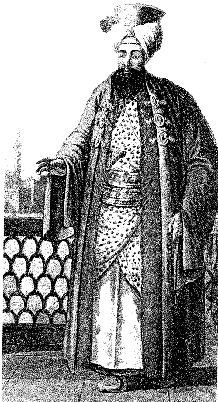
Bey, no nosso caso, é o soberano da Tunísia. O termo vem da hierarquia política do Império Turco Otomano, no qual significava senhor de uma localidade forte ou de uma região. Foi adotado em seguida pelos reis do norte da África, na esfera de influência da Turquia. Na ilustração, um bey egípcio em uma gravura anônima francesa do século XIX (N.d.T.).

s et ocie no de da ne- los lei ela ili- m- em do i e ia.