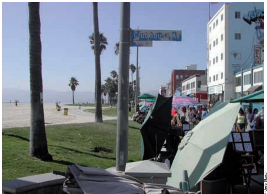
Los Angeles, Venice Beach.

La procedura ha dimostrato la sua validità quando, tornando alla redazione del bando, grazie alle riflessioni elaborate in sede di studio, si è modificata l'ipotesi iniziale di concorso: da concorso generico "per il lungomare" ad un concorso che individuava due aree specifiche di intervento che si aggiungevano al lungomare e alla