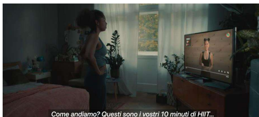
Fig. 3 – Una delle prime immagini del superspot “Welcome to the club”.

È proprio con questa frase che il superspot comincia: “Welcome to the club” di cui “c'è un nuovo club che ti aspetta” è una traduzione non troppo felice, almeno dal punto di vista aspettuale. A pronunciare la frase è una voce off maschile che giunge pochi secondi dopo l'inizio del filmato, quando una camera mobile ha fatto il suo ingresso nella camera da letto in cui una donna in tenuta da ginnastica sta in piedi davanti a un grosso televisore (Fig. 3). È a questo apparecchio che è dedicata la seconda inquadratura in cui vediamo comparire la scritta “Ready” e poi un conto alla rovescia che parte da 3. Un nuovo stacco e vediamo la donna guardare il Watch che ha al polso. Pochi attimi e l'inquadratura ci mostra il display di quest'ultimo in cui compare un 1: il conto alla rovescia cominciato sul televisore è finito sul Watch, l'allenamento inizia. Non prima che sul display che la donna ha al polso compaia la schermata che indica il tempo, le pulsazioni e le calorie. La stessa che, appena questa abbassa il braccio e la messa a fuoco della camera si rimodula sullo schermo del televisore, vediamo in alto a destra sullo schermo della TV, proprio sopra la testa di un'istruttrice di origine orientale che dà il benvenuto e annuncia che si tratta di un allenamento da 10 minuti di HIIT. Solo allora la voce off continua la sua narrazione.