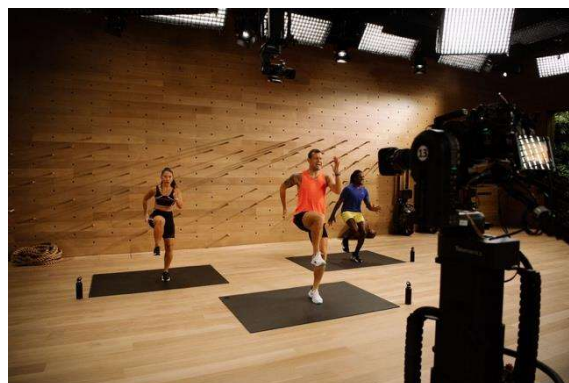
Fig. 2 – Le attrezzature all’avanguardia con cui viene realizzata la produzione.