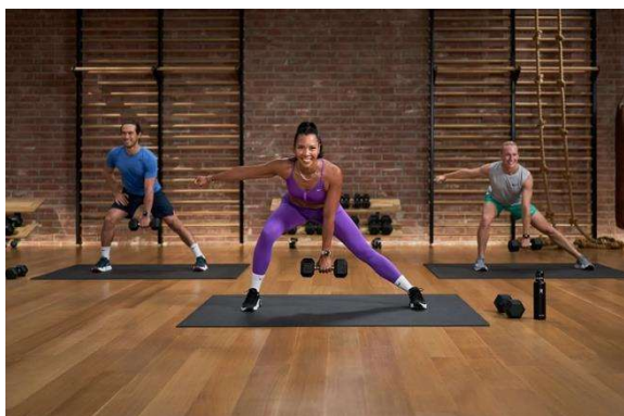
Fig. 1 – Come si presenta la palestra Apple Fitness+.